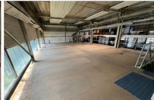
C | Galerie / Obergeschoss