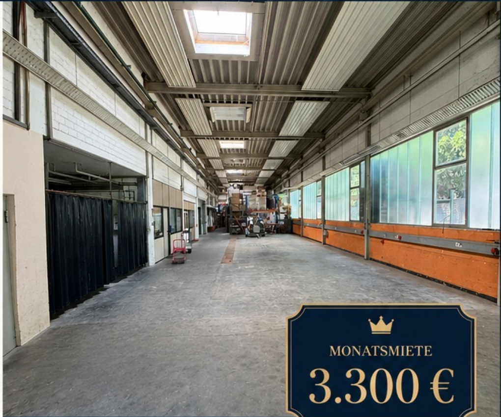
A | Haupt-Halle

Vielseitig nutzbare Gewerbeimmobilie mit Hallen-, Büro- und Außenflächen in verkehrsgünstiger Lage von Schlierbach – ideal für produktionsnahe Nutzung, Lager, Handwerk oder repräsentative Showroom-Konzepte.