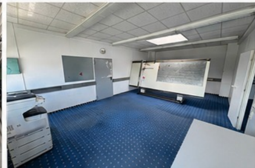
E | Büro mit Dusche