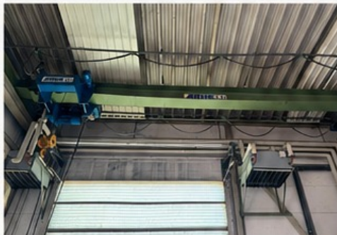
D | Krananlage – bis 3,2 t