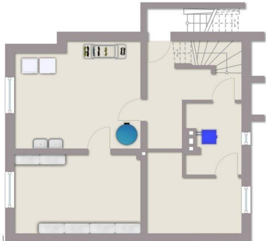
Grundriss nicht maßstäblich