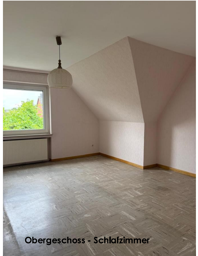
Obergeschoss - Schlafzimmer