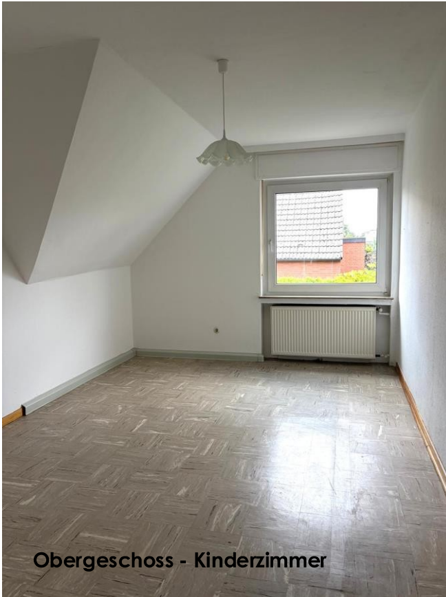
Obergeschoss - Kinderzimmer

Im Obergeschoss befinden sich 2 großzügige Schlafzimmer sowie ein Büro oder 2. Kinderzimmer.