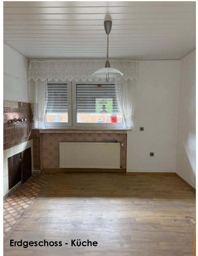
Erdgeschoss - Küche