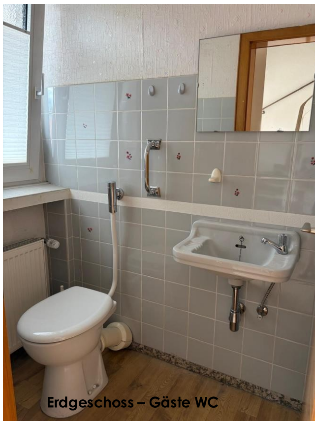
Erdgeschoss - Gäste WC