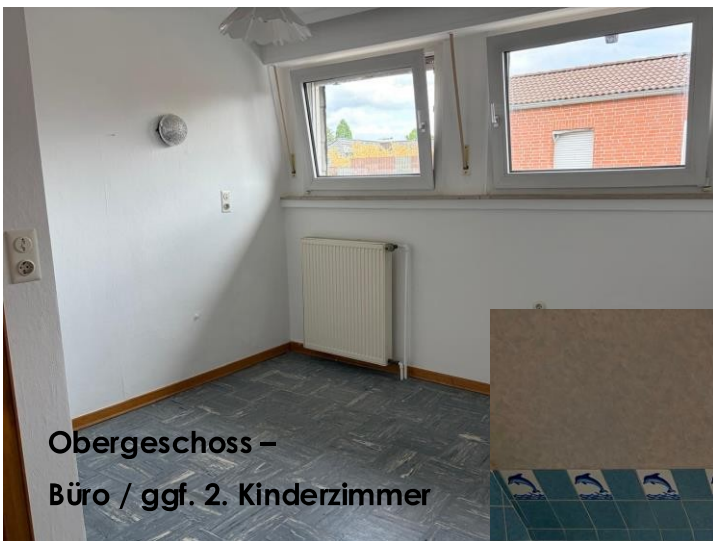
Obergeschoss - Büro / ggf. 2. Kinderzimmer