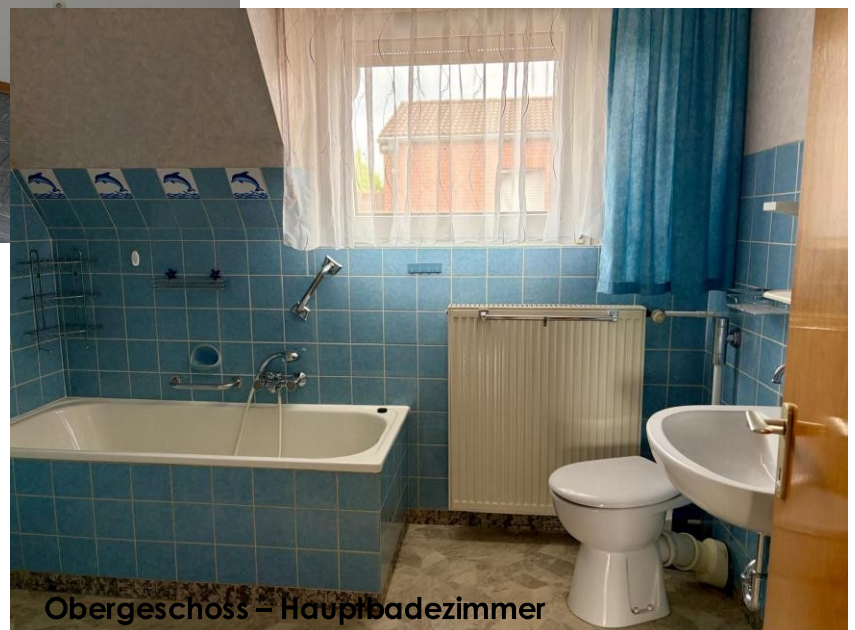
Obergeschoss - Hauptbadezimmer