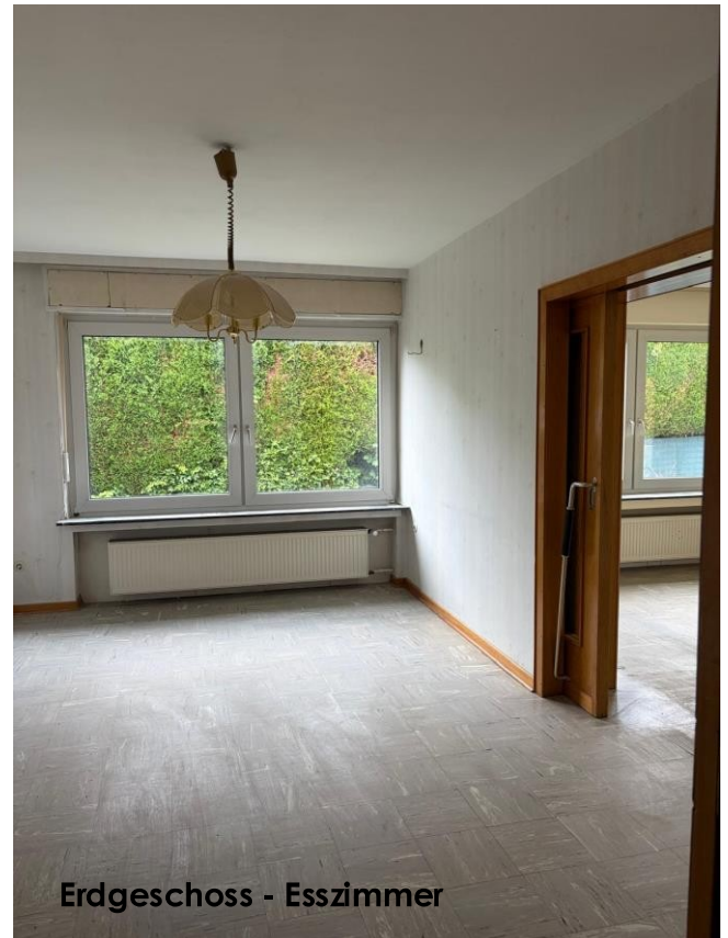
Erdgeschoss - Esszimmer