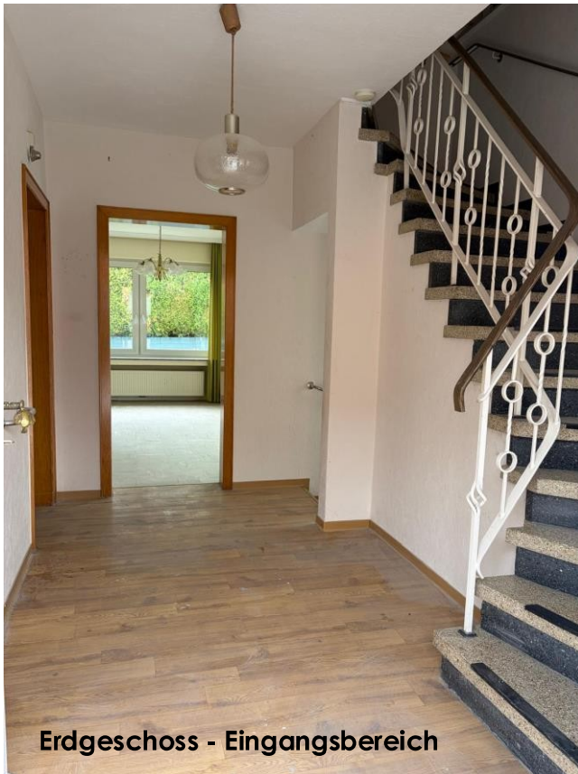
Erdgeschoss - Eingangsbereich

Die Raumaufteilung bietet Ihnen vielfältige Möglichkeiten, Ihren persönlich Wohntraum modern und individuell zu verwirklichen.