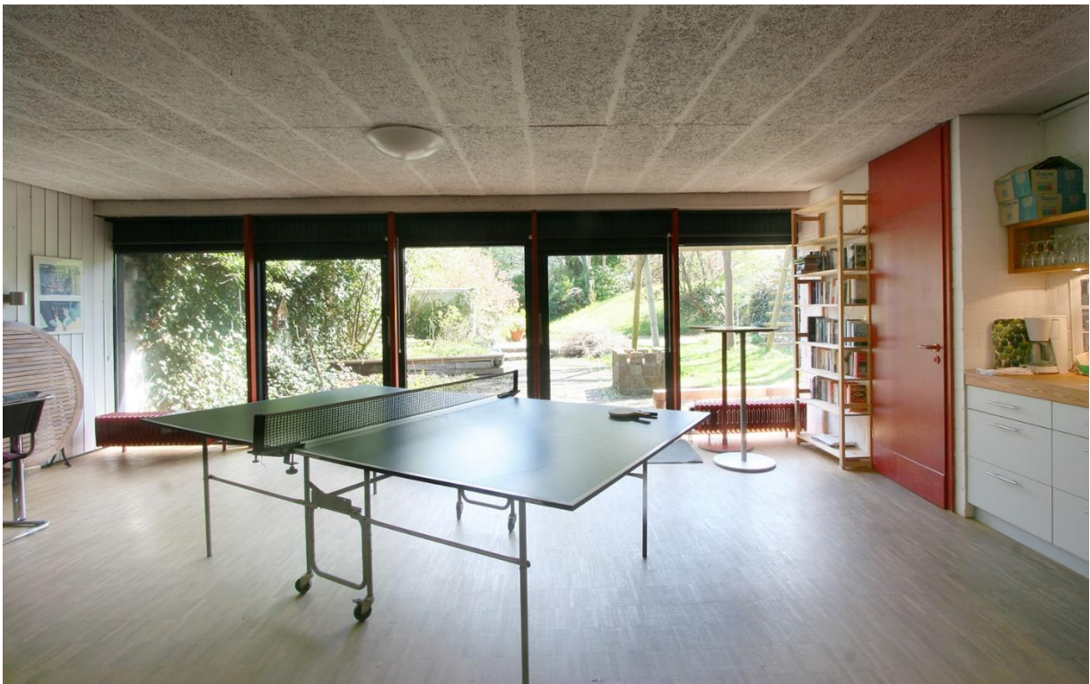
Der Veranstaltungsraum mit Küchenzeile, Beamer und Tischtennisplatte