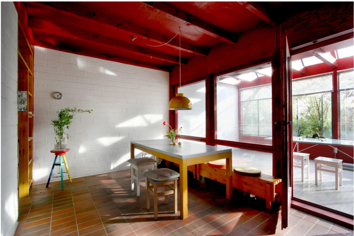
Der Essbereich mit Blick in den Wintergarten