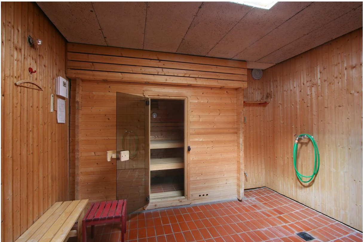
Die Sauna im Gemeinschaftshaus