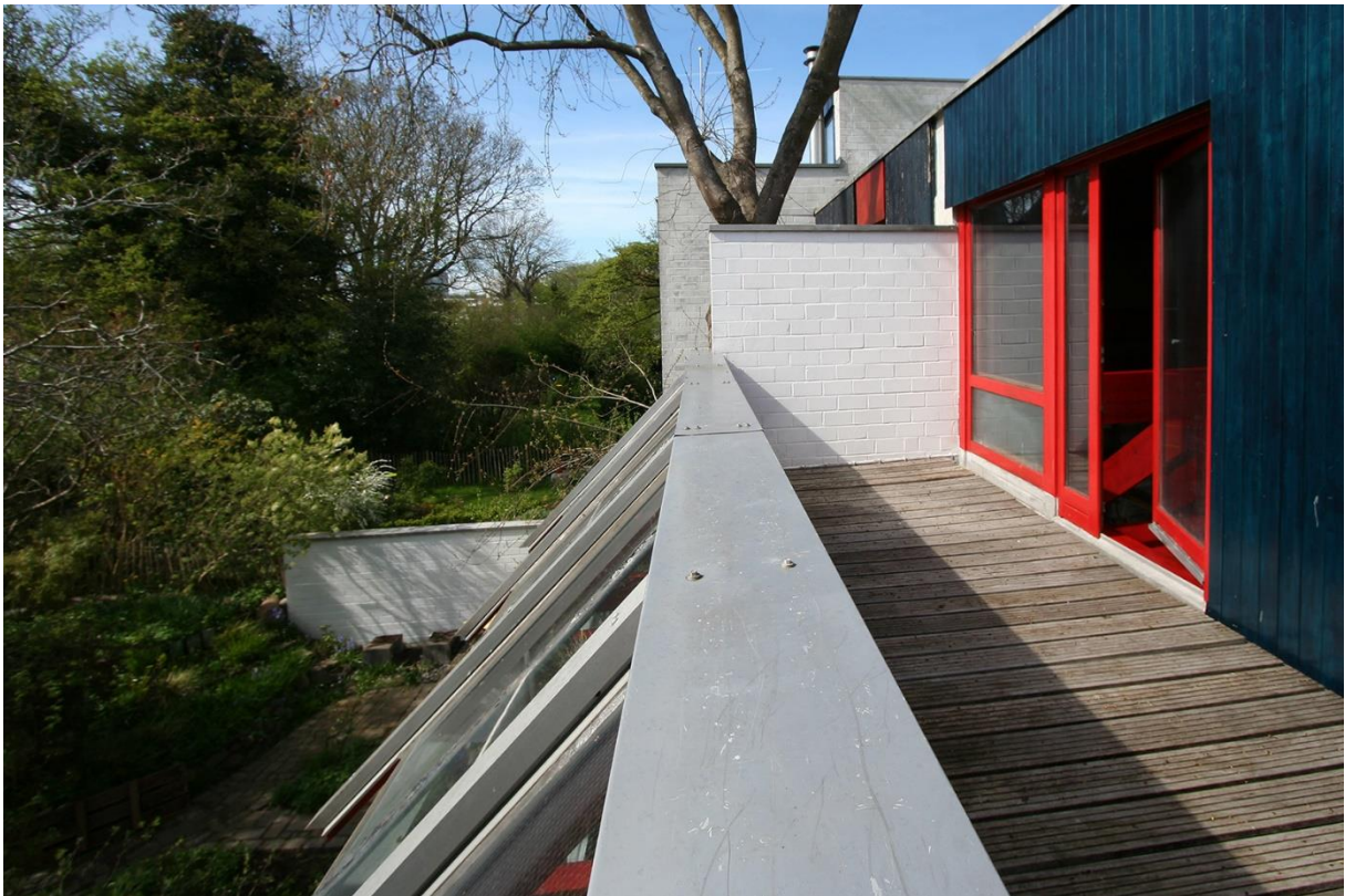
Die Dachterrasse auf der Westseite