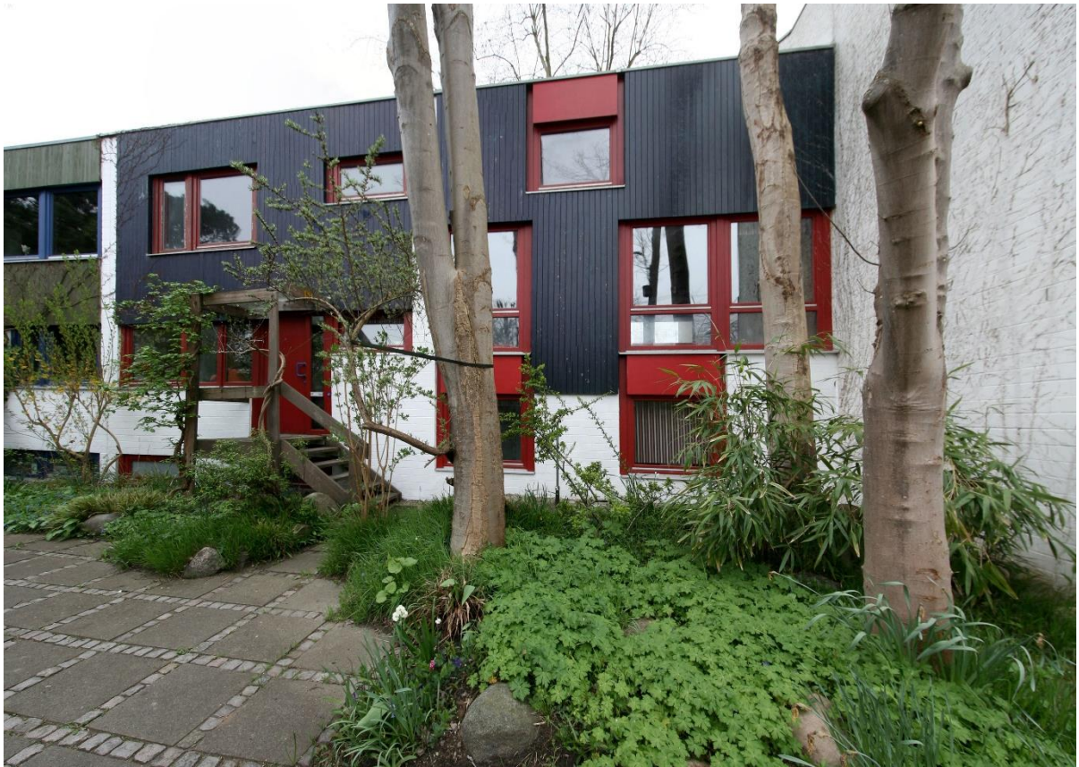
Die Vorderseite des Hauses