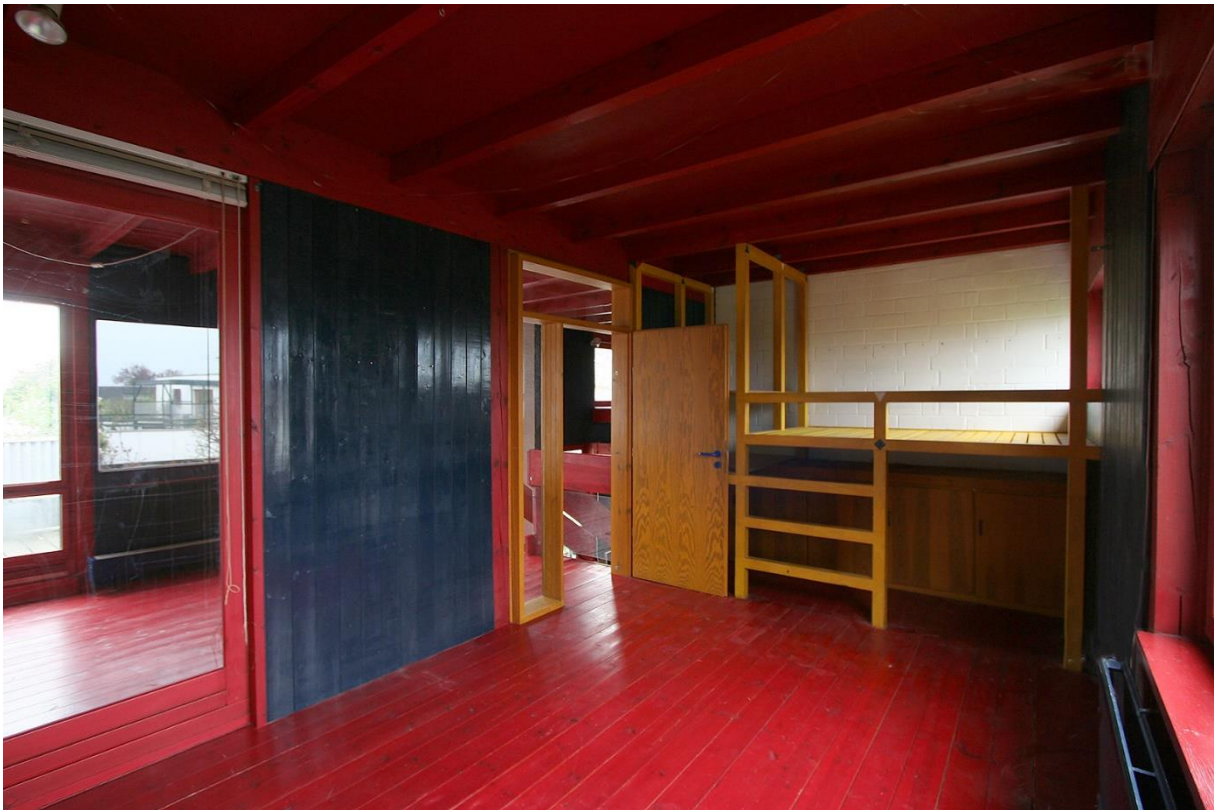
Das Arbeitszimmer im Obergeschoß