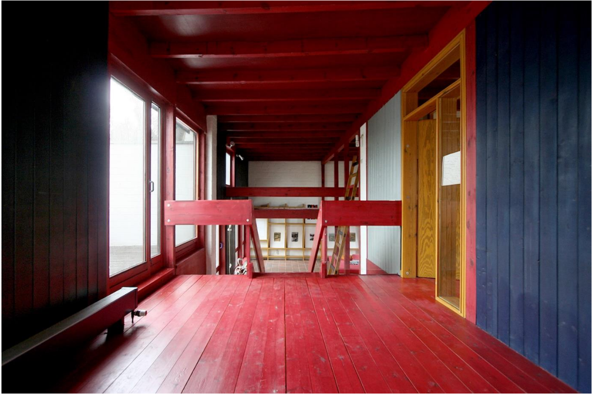
Vorraum zum Arbeitszimmer im Obergeschoß