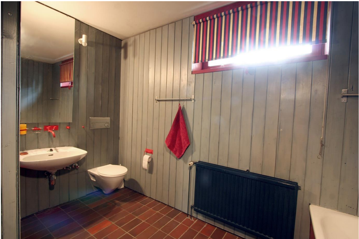
Das Bad im Souterrain