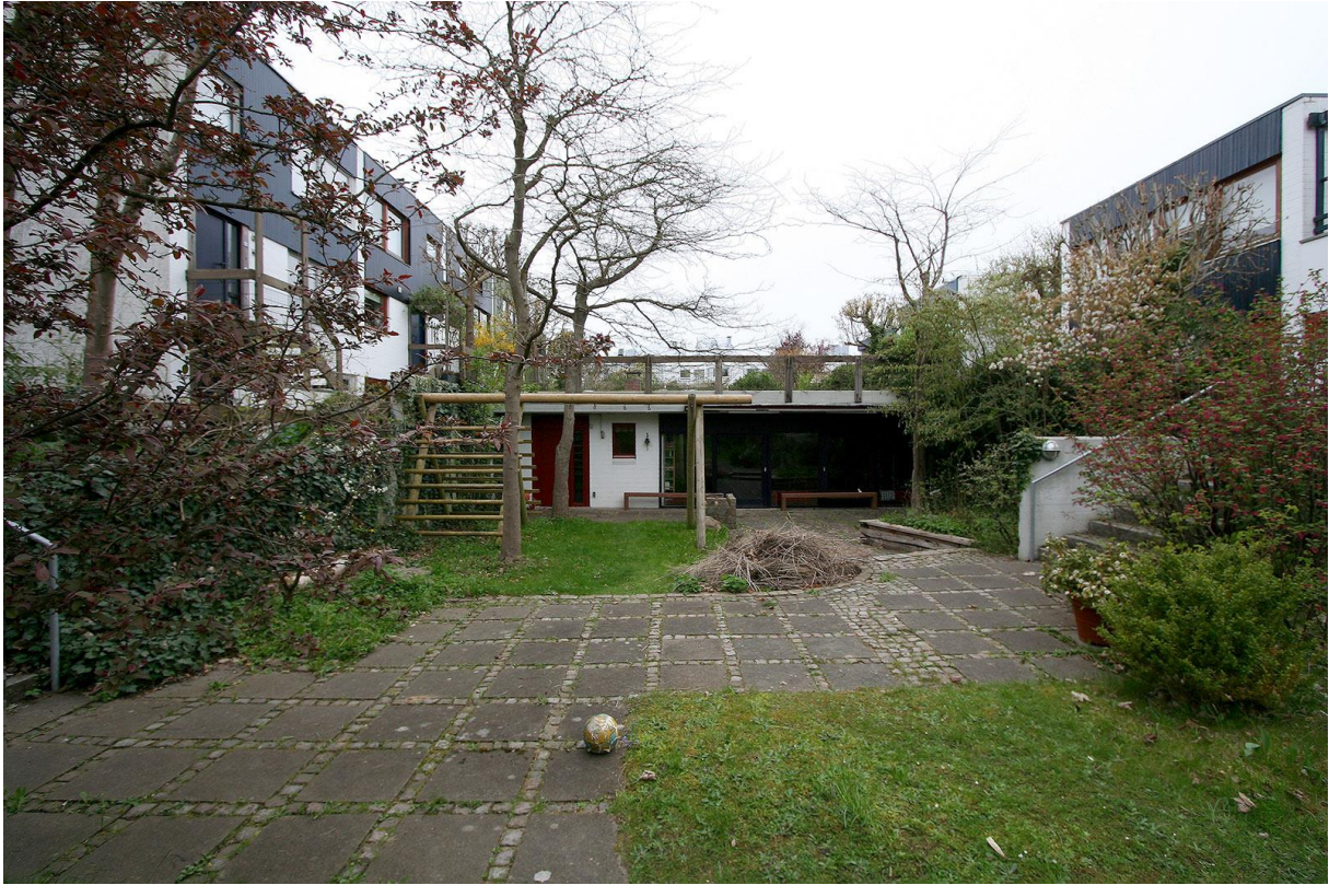
Das Gemeinschaftshaus mit Spielplatz und Feuerstelle