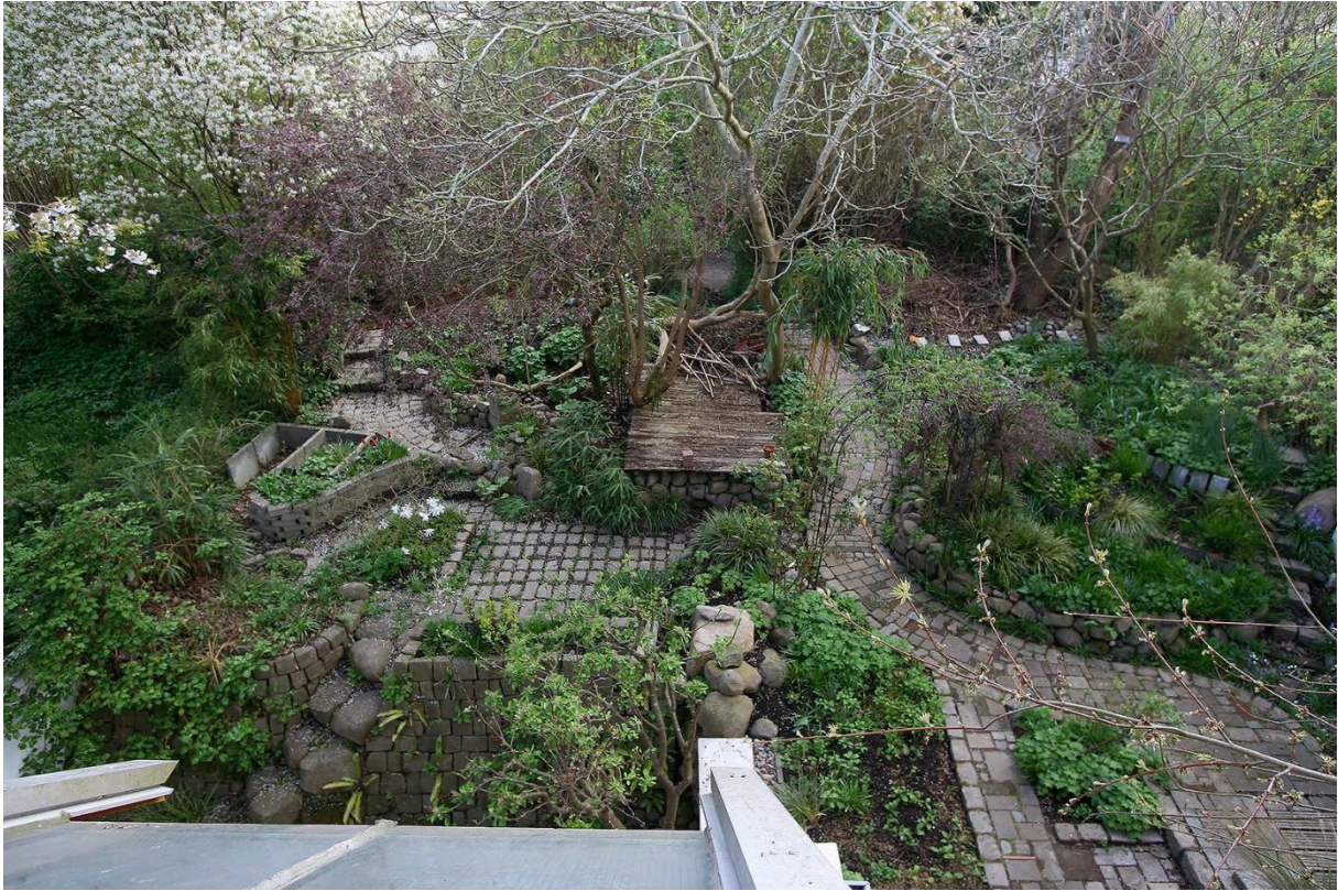
Blick von der Dachterrasse in den Garten