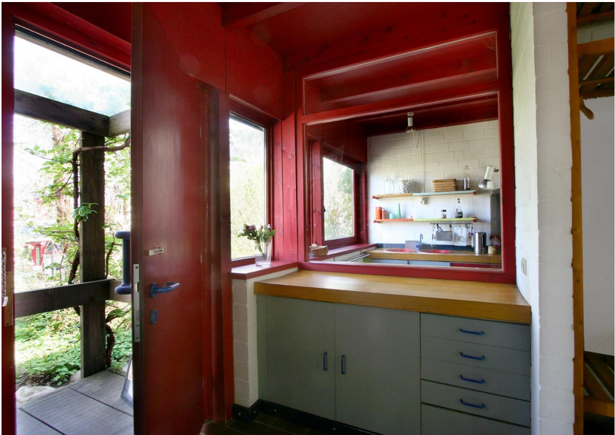
Der Eingangsbereich mit Fenster zur Küche