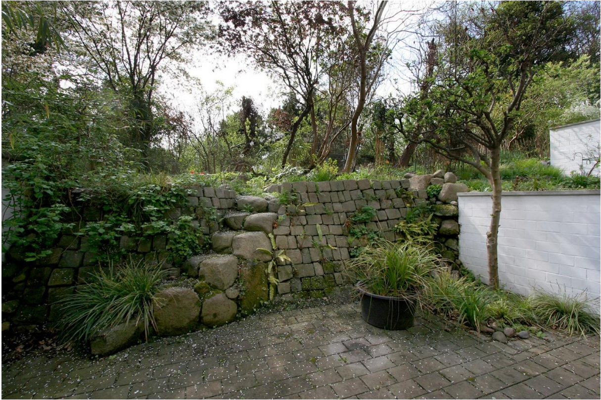
Die Terrasse vor dem Schlafzimmer