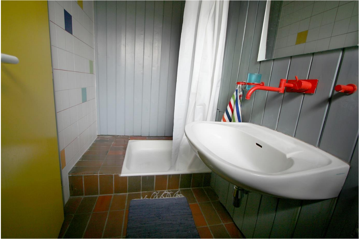
Das Gäste-WC mit Dusche