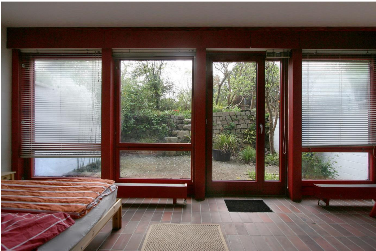
Das Schlafzimmer im Souterrain