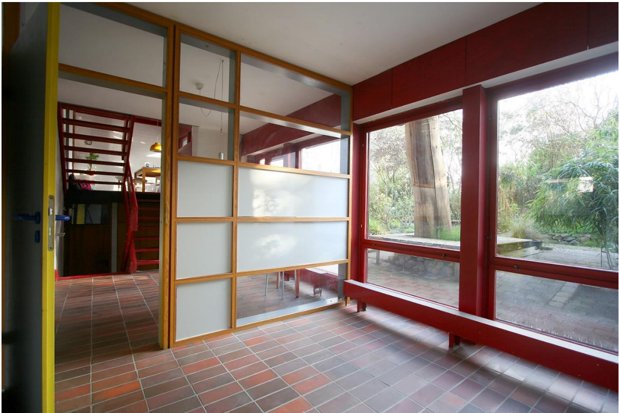
Geteilter Vorraum zu den Kinderzimmern Einbauschränke als platzsparend-pragmatische Lösung