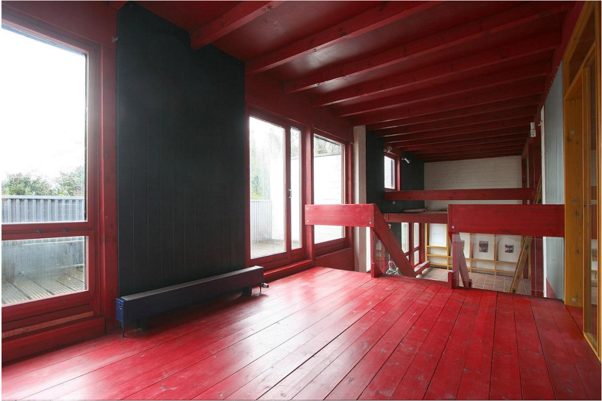
Zugang zur Dachterrasse