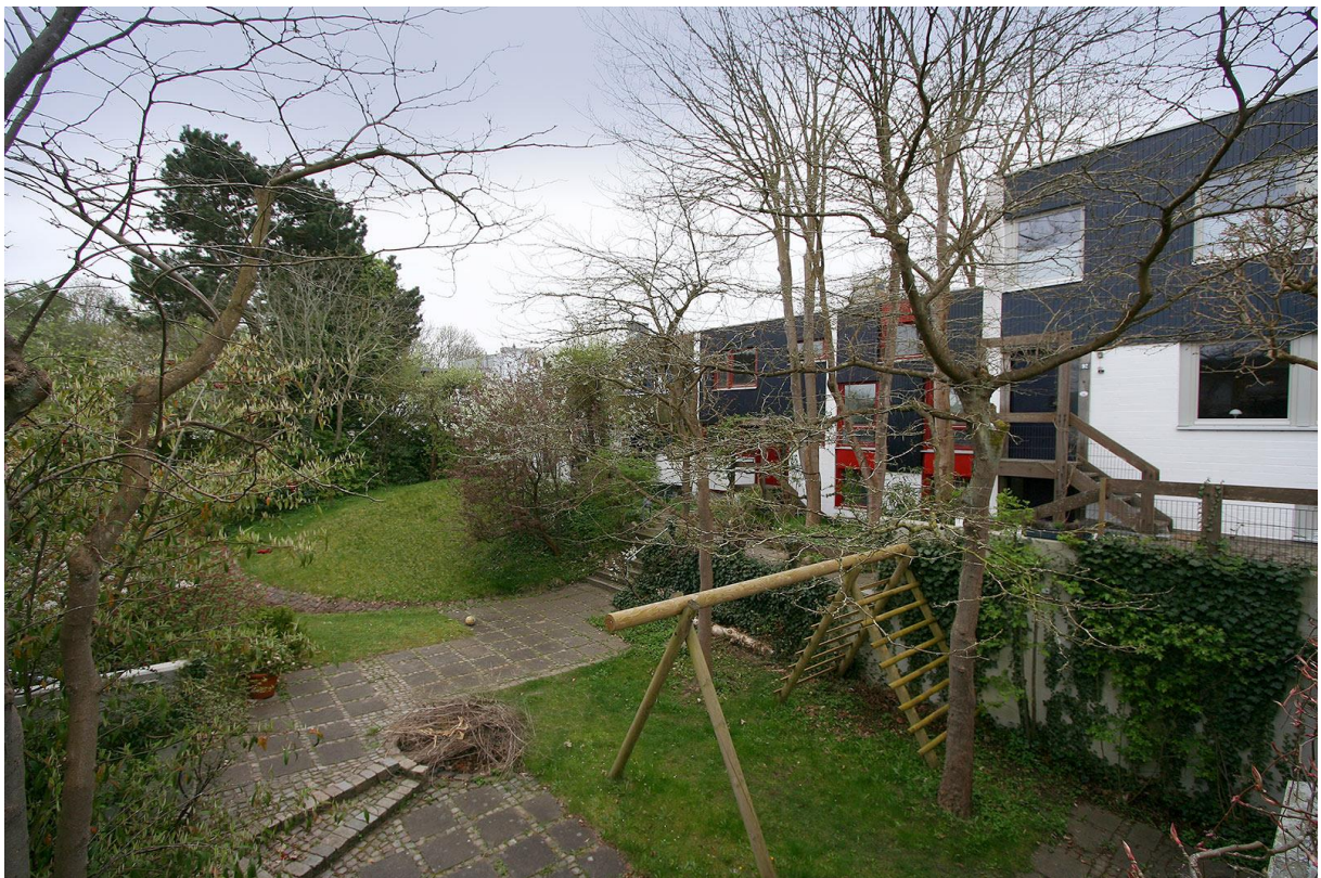
Die Vorderseite mit Spielplatz und Feuerstelle