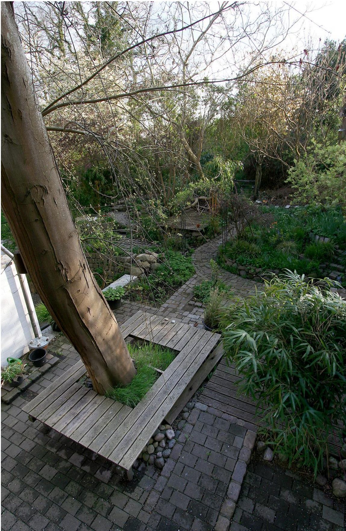
Der Garten mit Terrassen und Wegen auf verschiedenen Ebenen