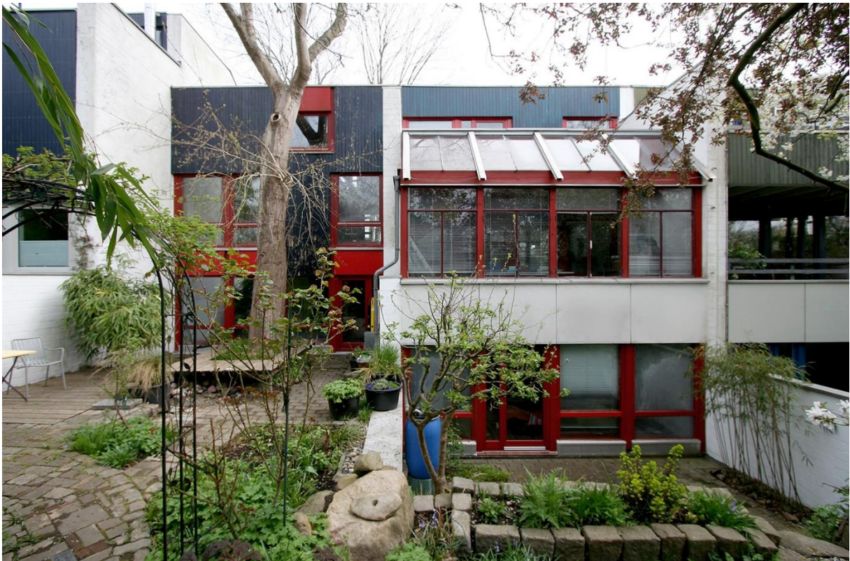
Die Rückseite des Hauses vom Garten aus gesehen