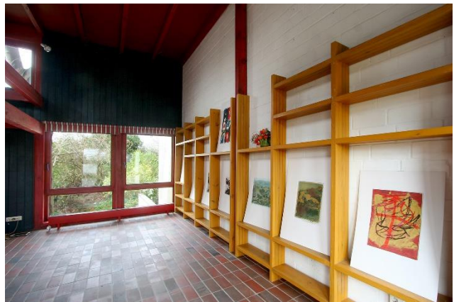
Das Wohnzimmer mit Galerie und offenem Kamin