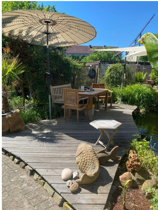
Holzdeck am Teich