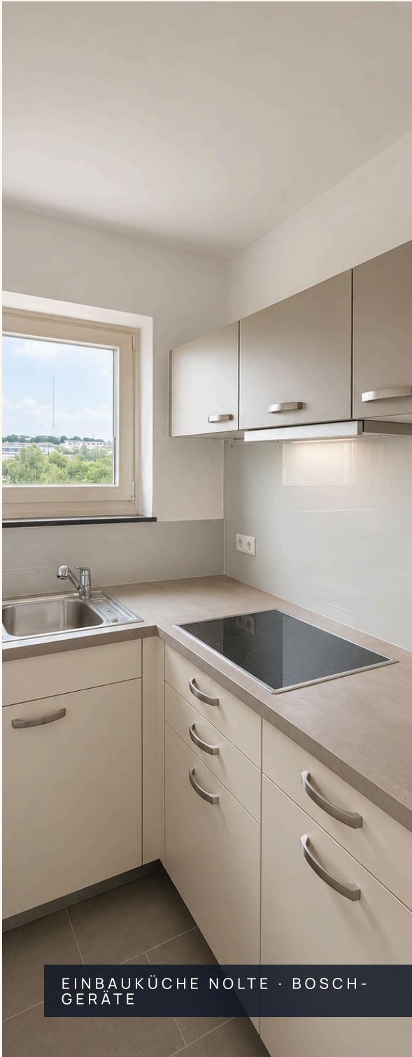
EINBAUKÜCHE NOLTE · BOSCH-GERÄTE