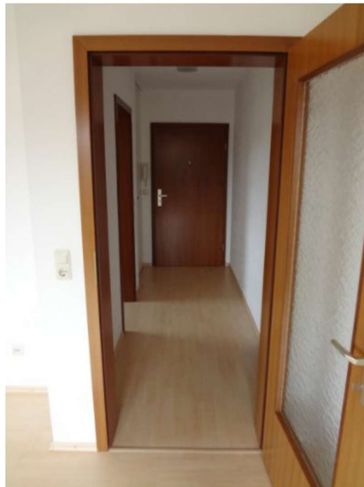
Eingangsbereich / Flur