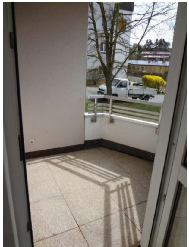
mit offener Küche und direkten Zugang zum gemütlichen Balkon