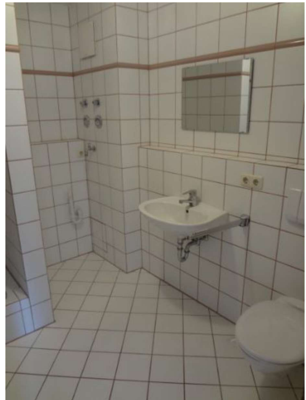
Badezimmer mit Dusche und Waschmaschinenanschluss