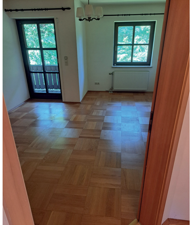
OG Zimmer (Schlafen)