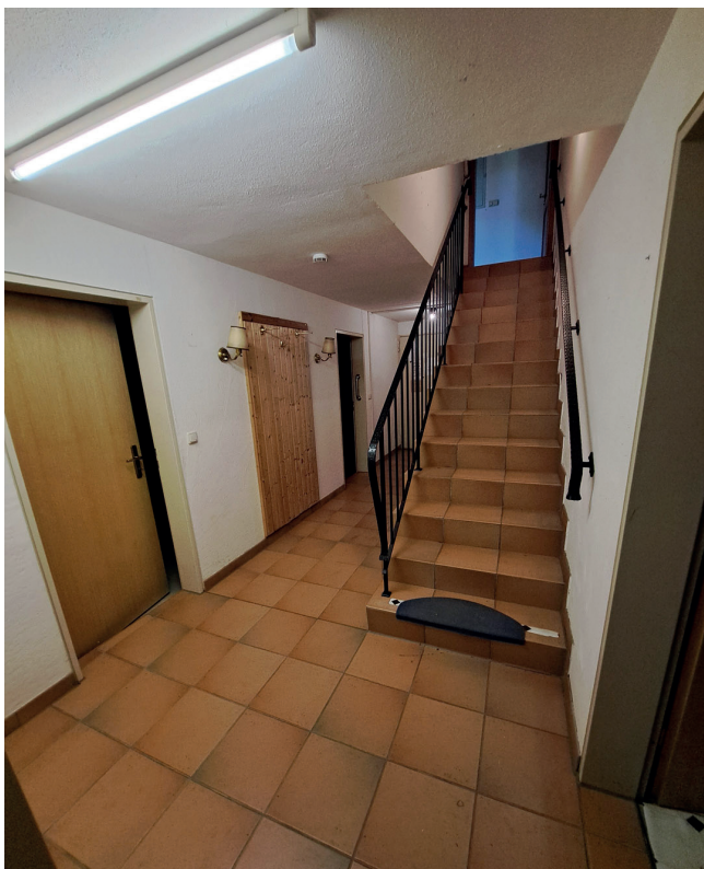
KG Flur im Keller