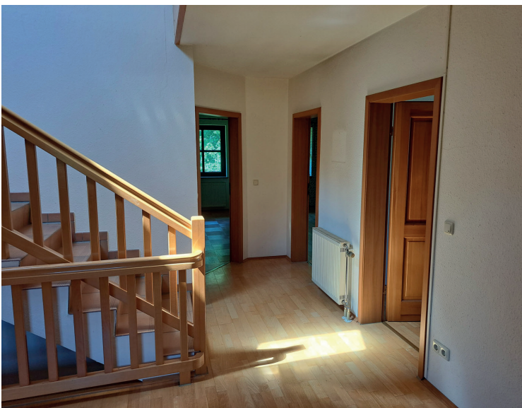
OG Blick auf Zimmer im OG