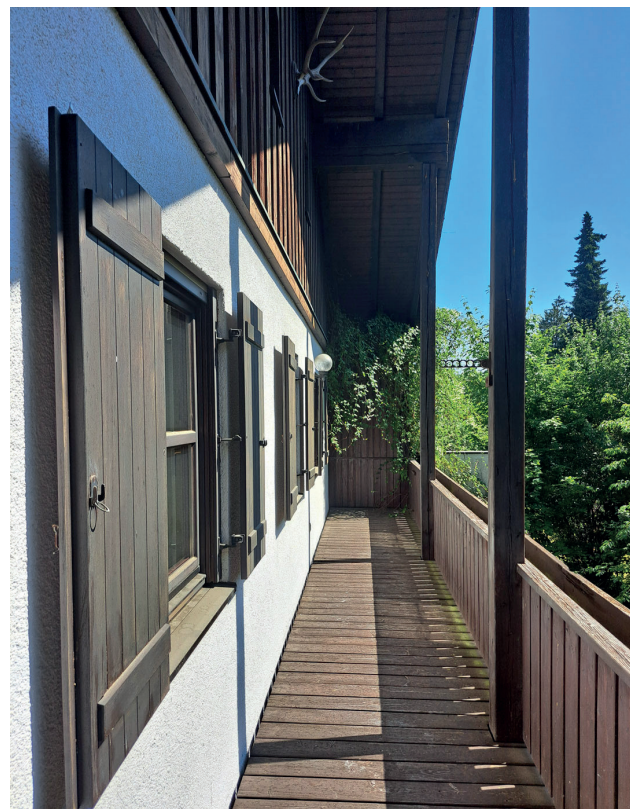
Balkon nach Südosten (vom Schlafzimmer aus)