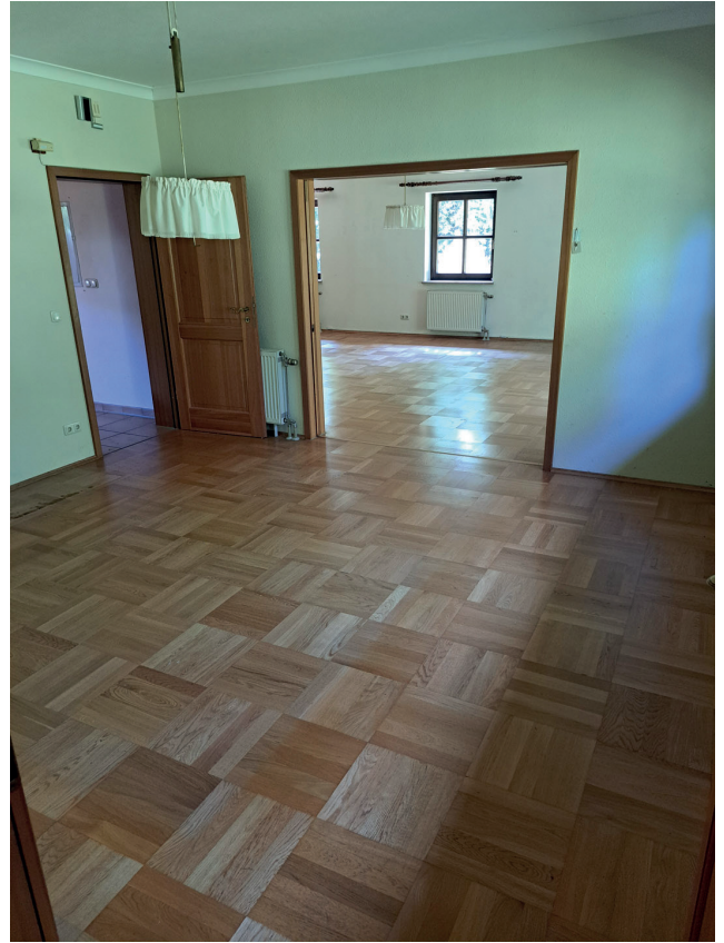
Esszimmer mit Blick ins Wohnzimmer