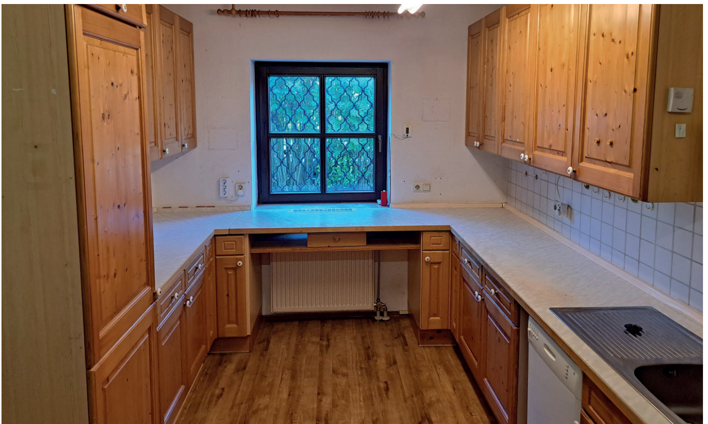
Küche zum Vorgarten