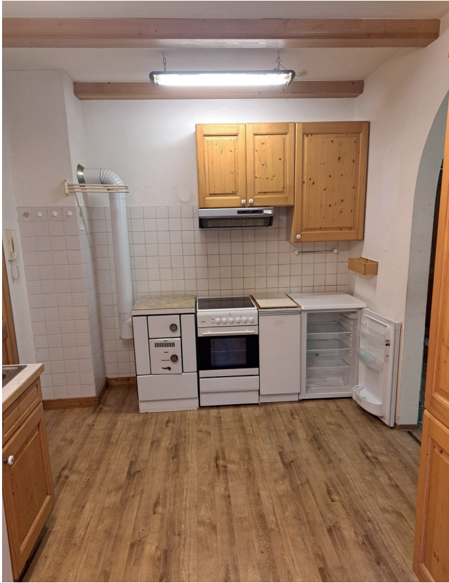
Küche Ansicht 2