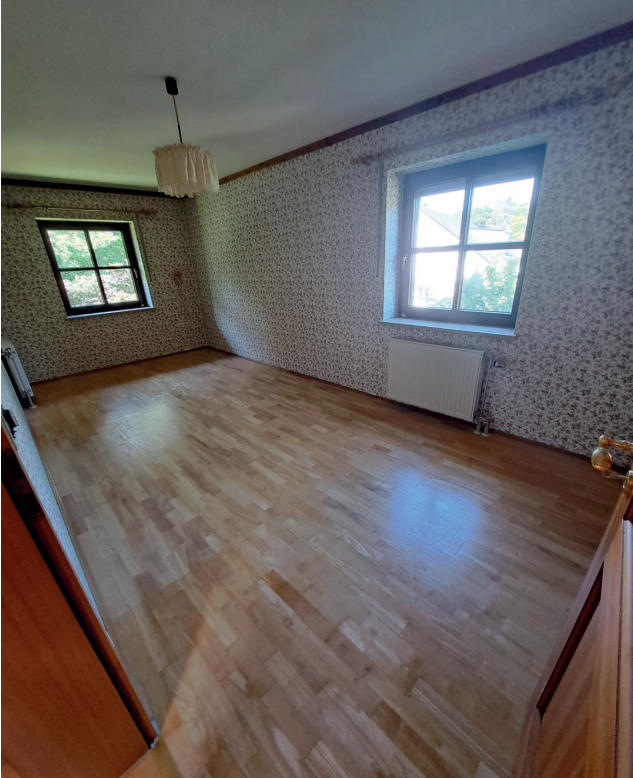
OG Zimmer (Arbeiten)