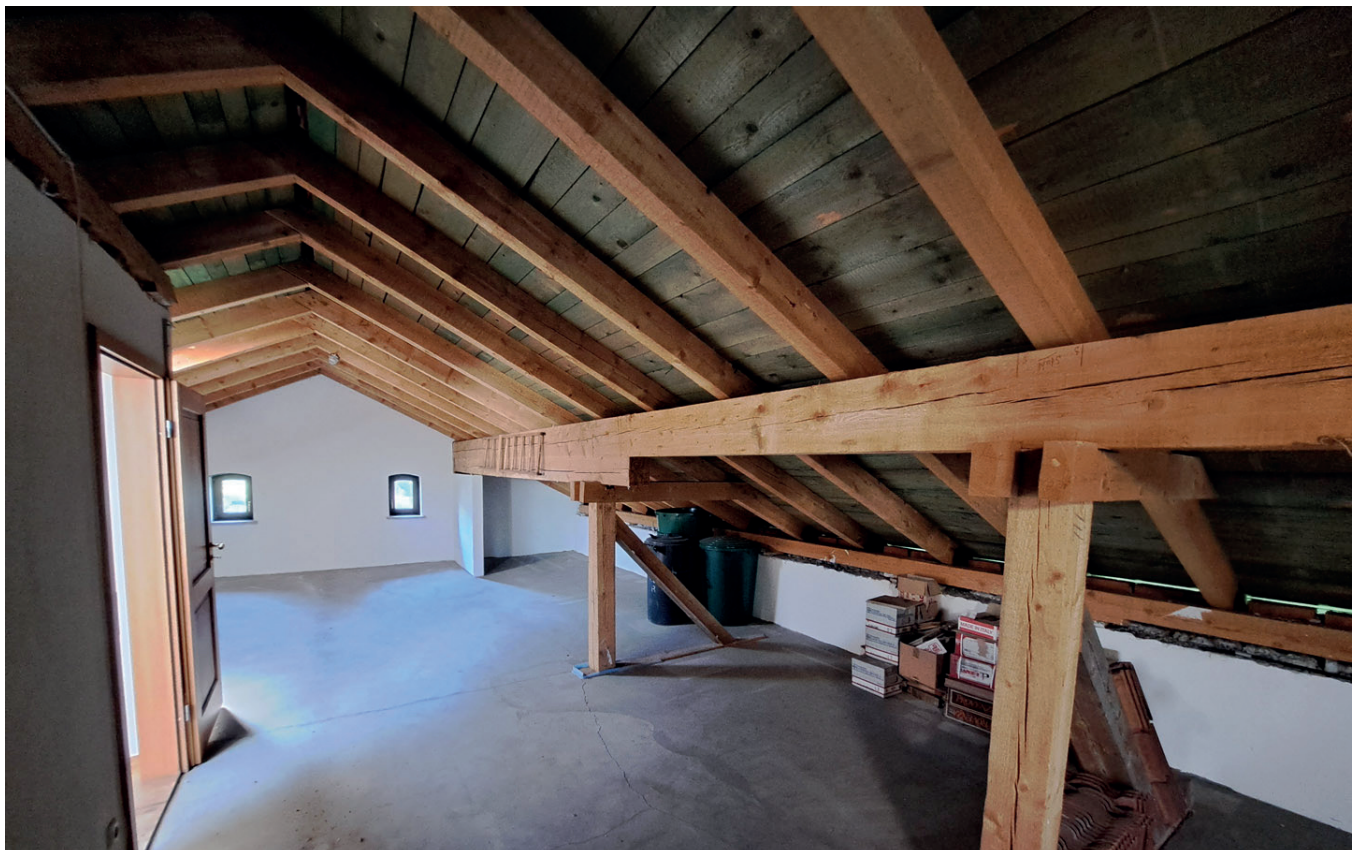
DG Blick durch den Dachboden