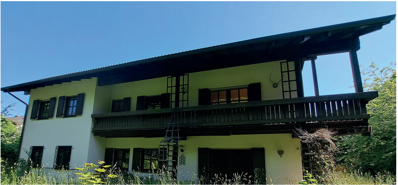
Hausansicht vom Garten