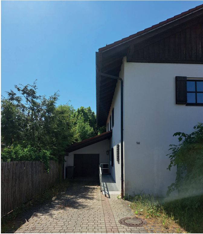
Außenansicht mit Eingang