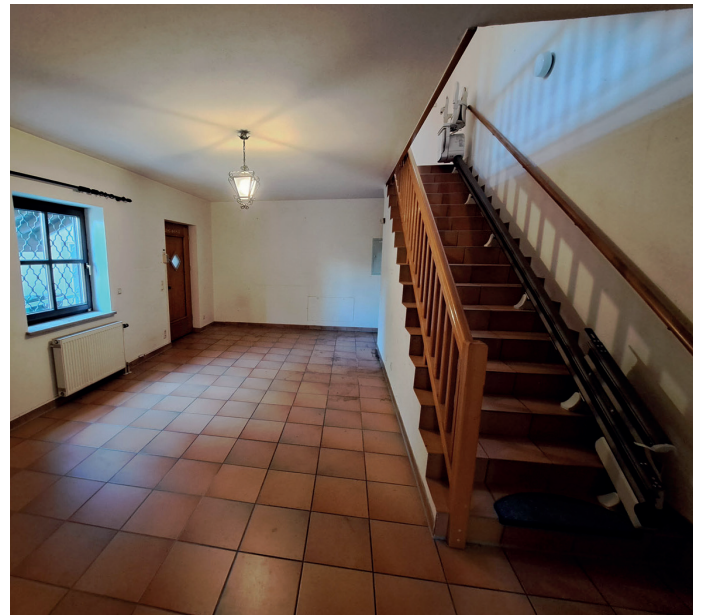
Treppe ins OG mit Treppenlift