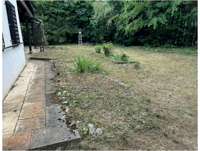
Garten nach Südwesten