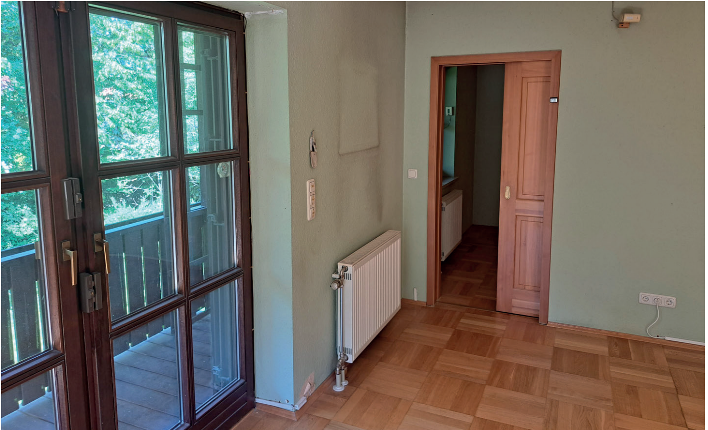
OG Blick vom Schlafzimmer zum Ankleidezimmer