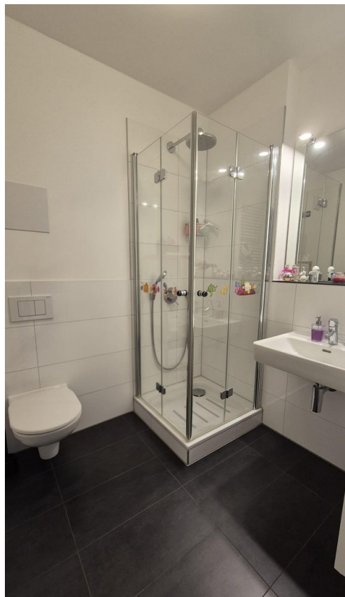
Bad mit Duschkabine