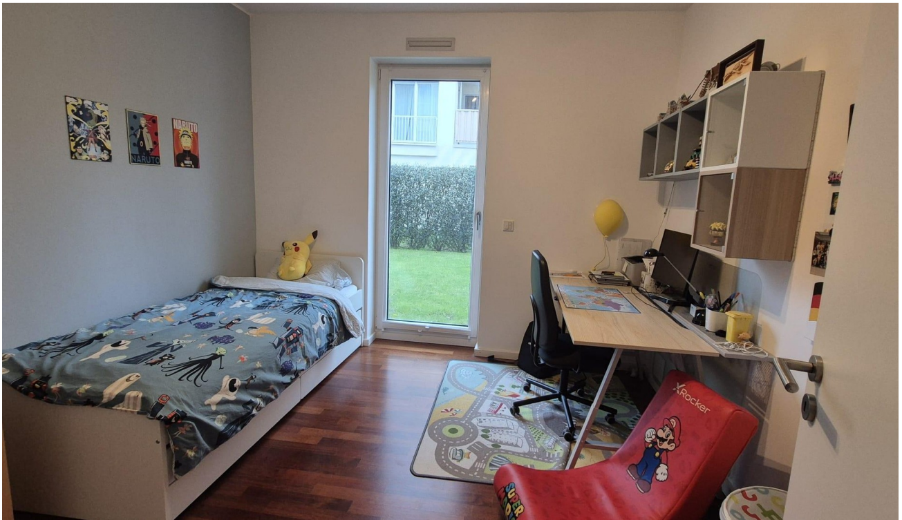
Kind, Arbeits- und Gästezimmer