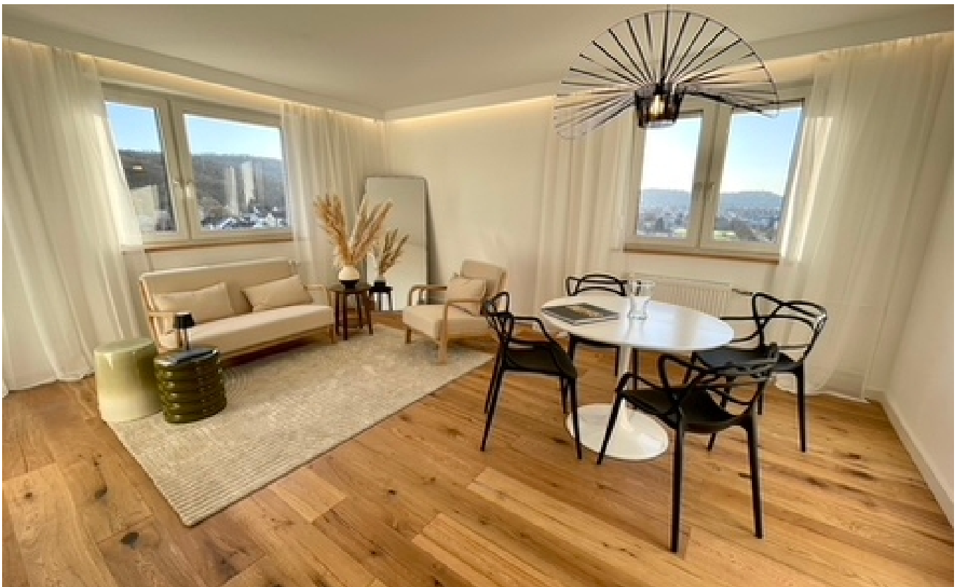
wohnen / essen