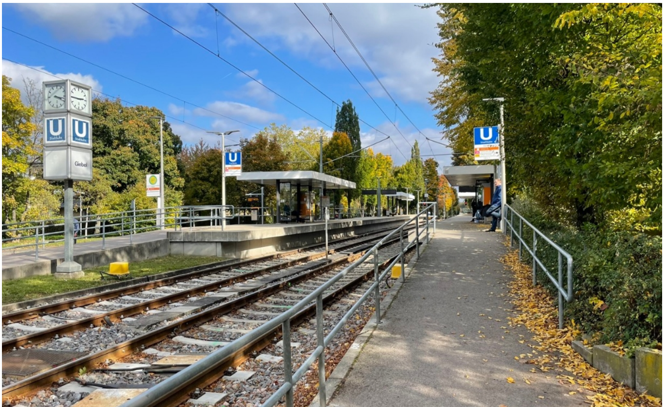
stadtbahn direkt vor dem haus