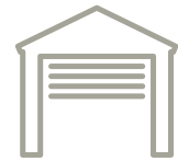
Garage, direkt am Haus