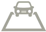
Stellplatz und Garage direkt am Haus