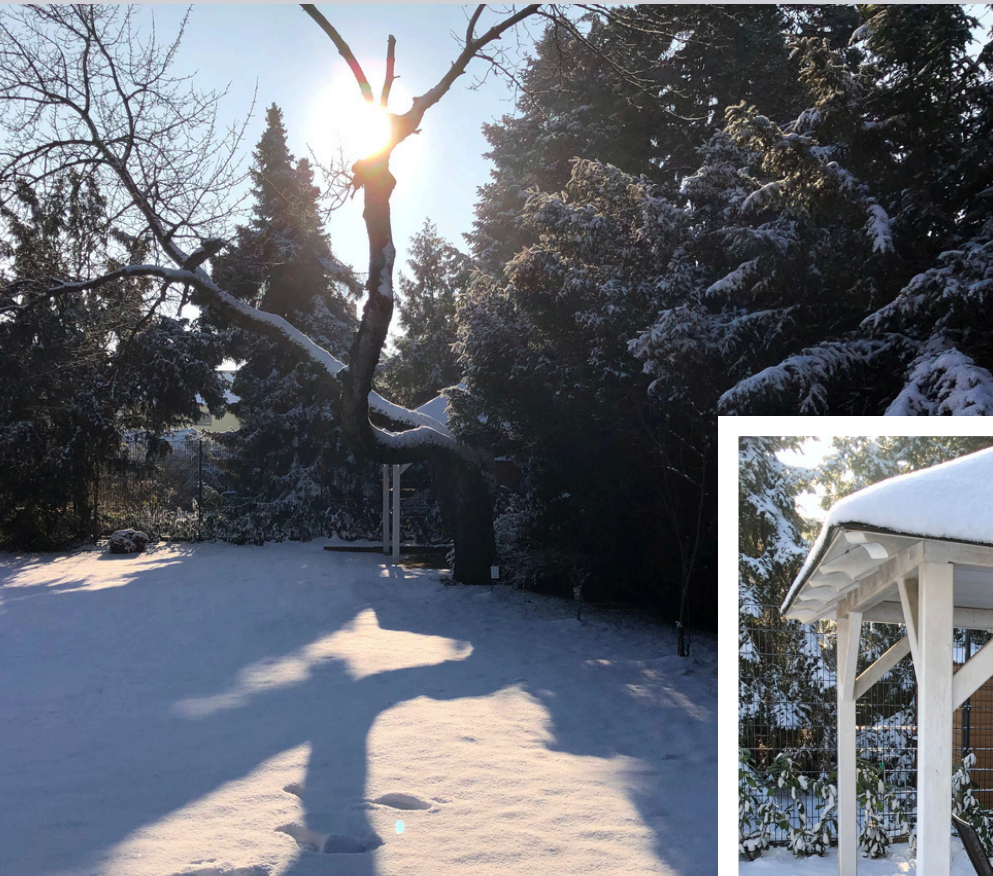
Momentaufnahmen im Winter