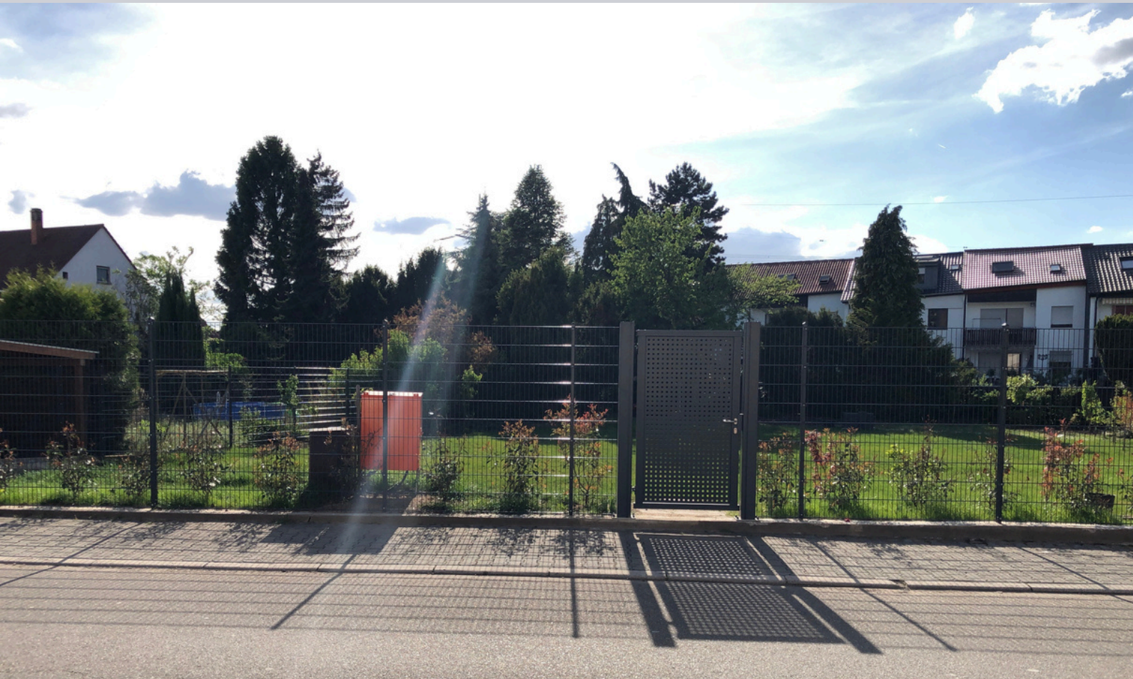
Neu verlegter Doppelstabmattenzaun 2 m hoch inkl. moderner Eingangspforte 1,2 m breit