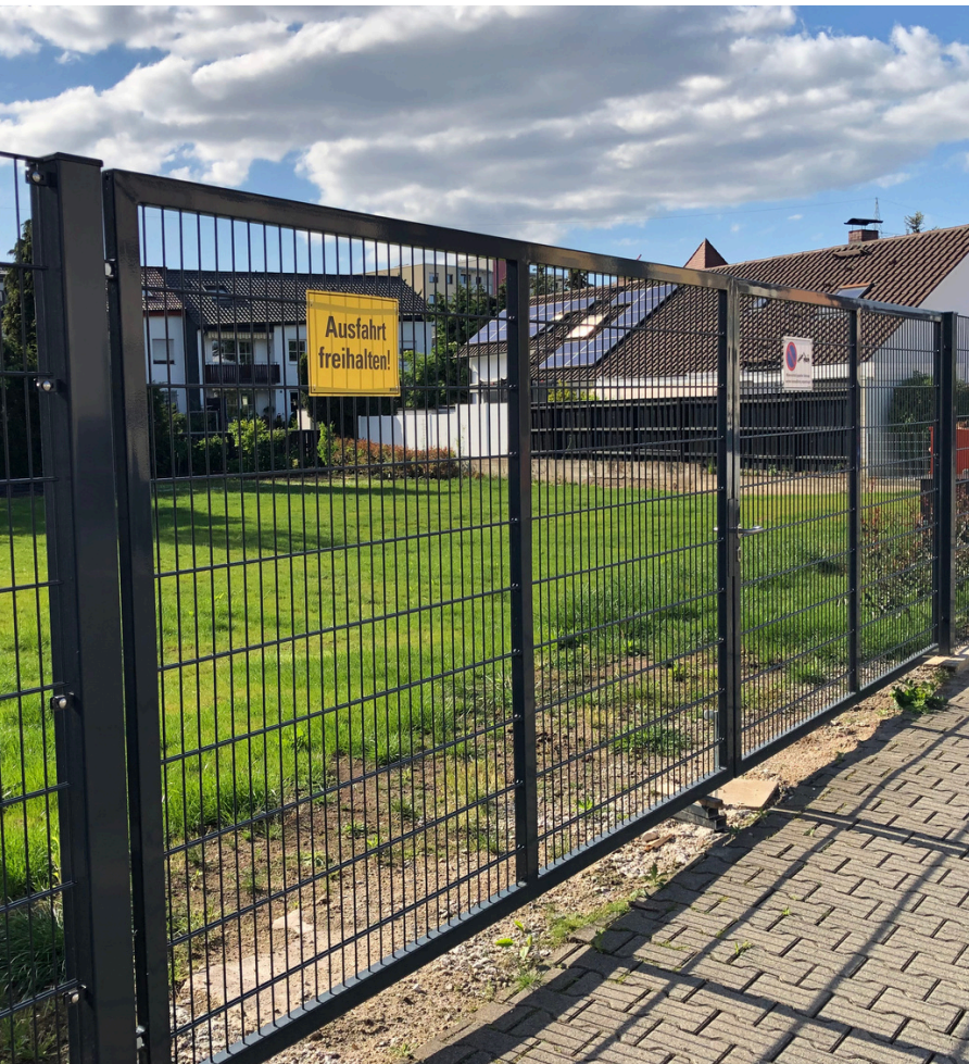
Großes Doppeltor 6 m breit