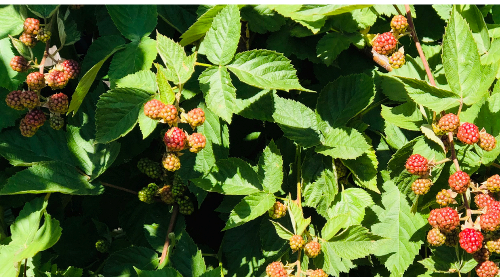
Vielfalt im Garten – Obstbäume & Himbeersträucher