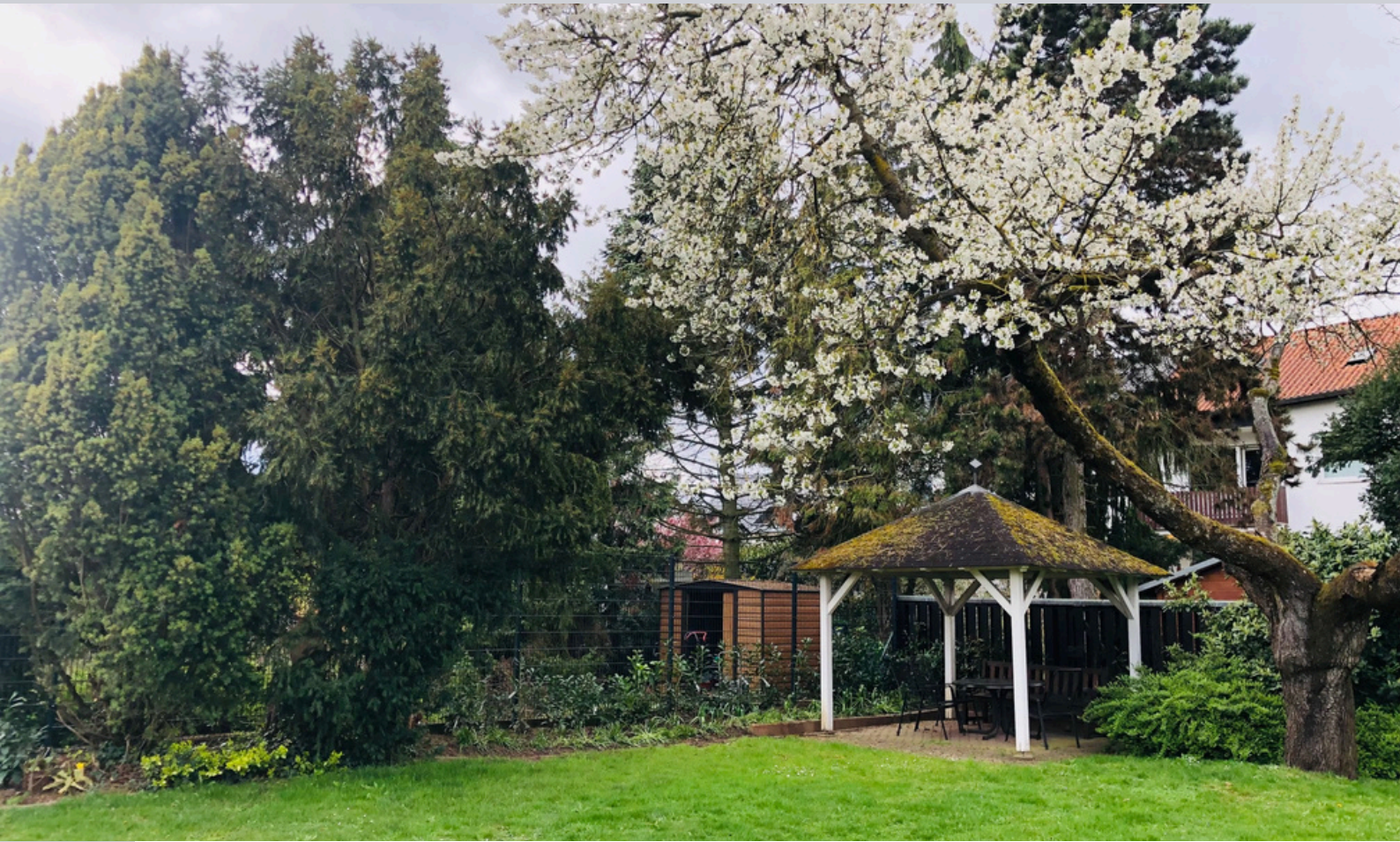
Pergola umgeben von alten Baumbestand