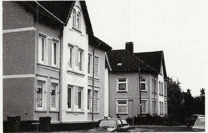
Obere Straße 9 und 10