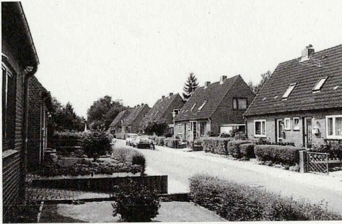
Oldestraße nach Südwesten