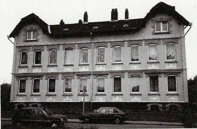
Obere Straße 2