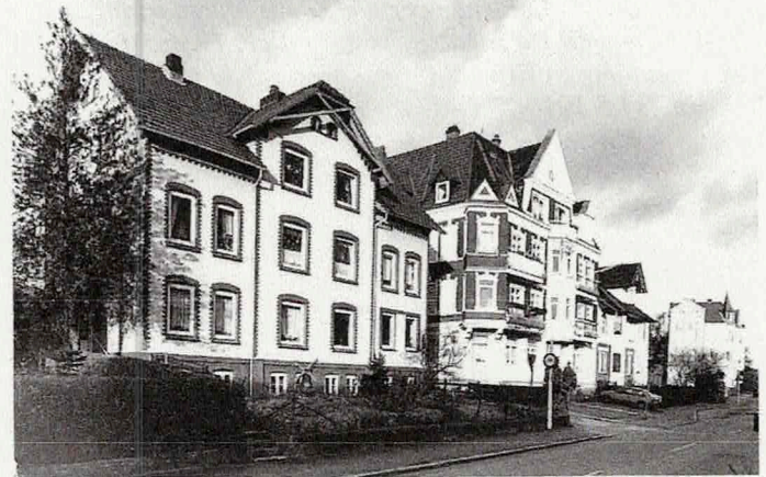
Prieser Strand 12-15