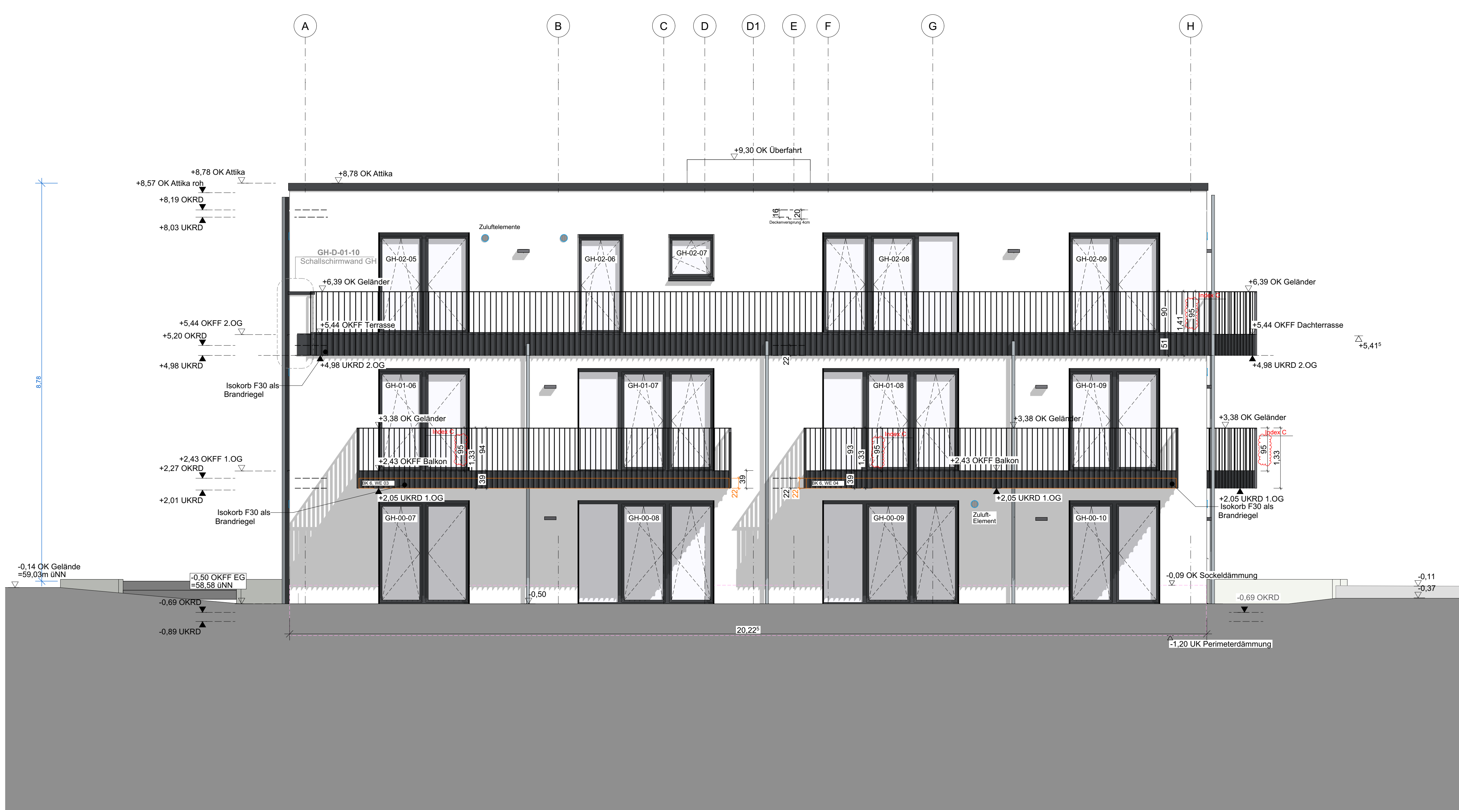
ANSICHT WESTEN - Hofansicht