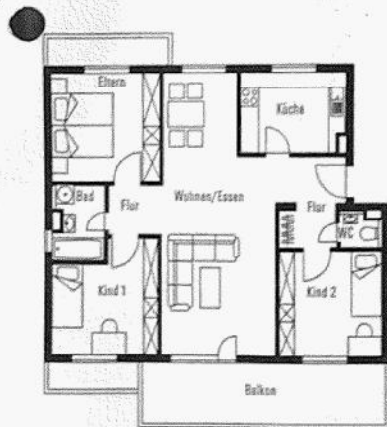
Nr. 26 (spiegelbildlich) Maßstab 1:200 1 cm = 2 m

Individuelles Wohnen auf über 90 m 2 . Ein zweites Schlafzimmer oder Gästezimmer lassen in dieser großen 4-Zimmer-Wohnung viel Raum für (Wohn)-Fantasie.