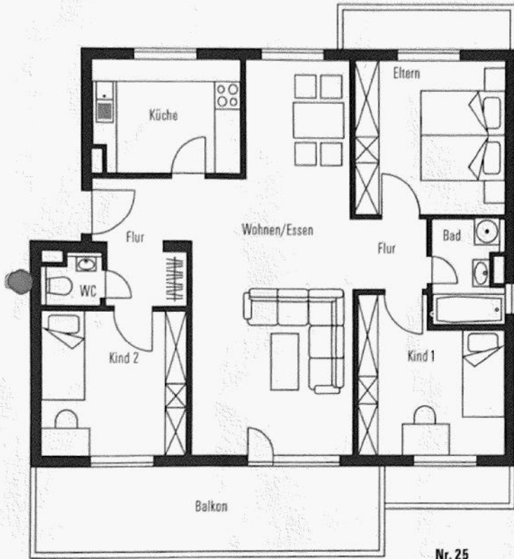
Nr. 25 Maßstab 1:100 1 cm = 1 m