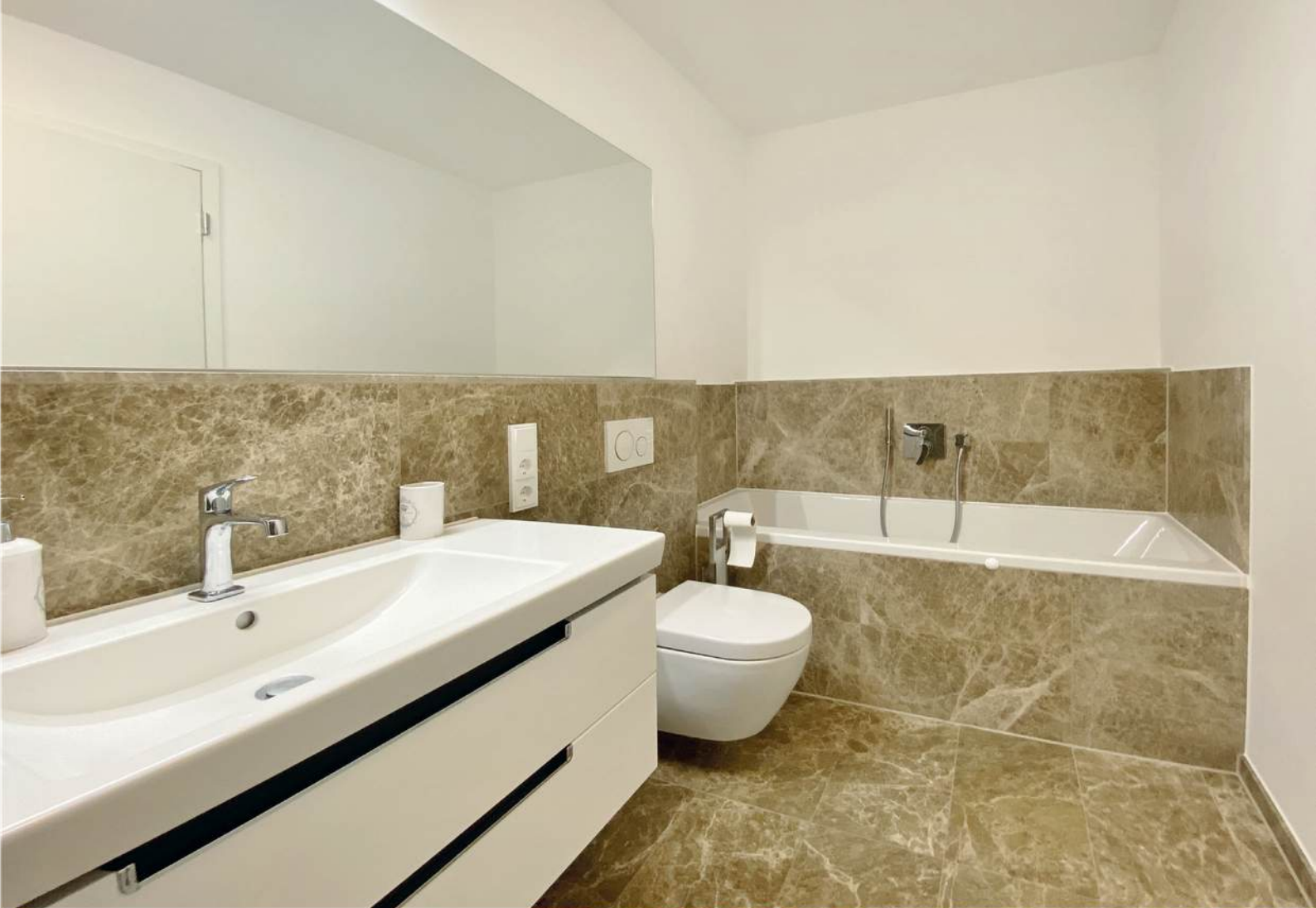
Vollbad und Gäste-WC