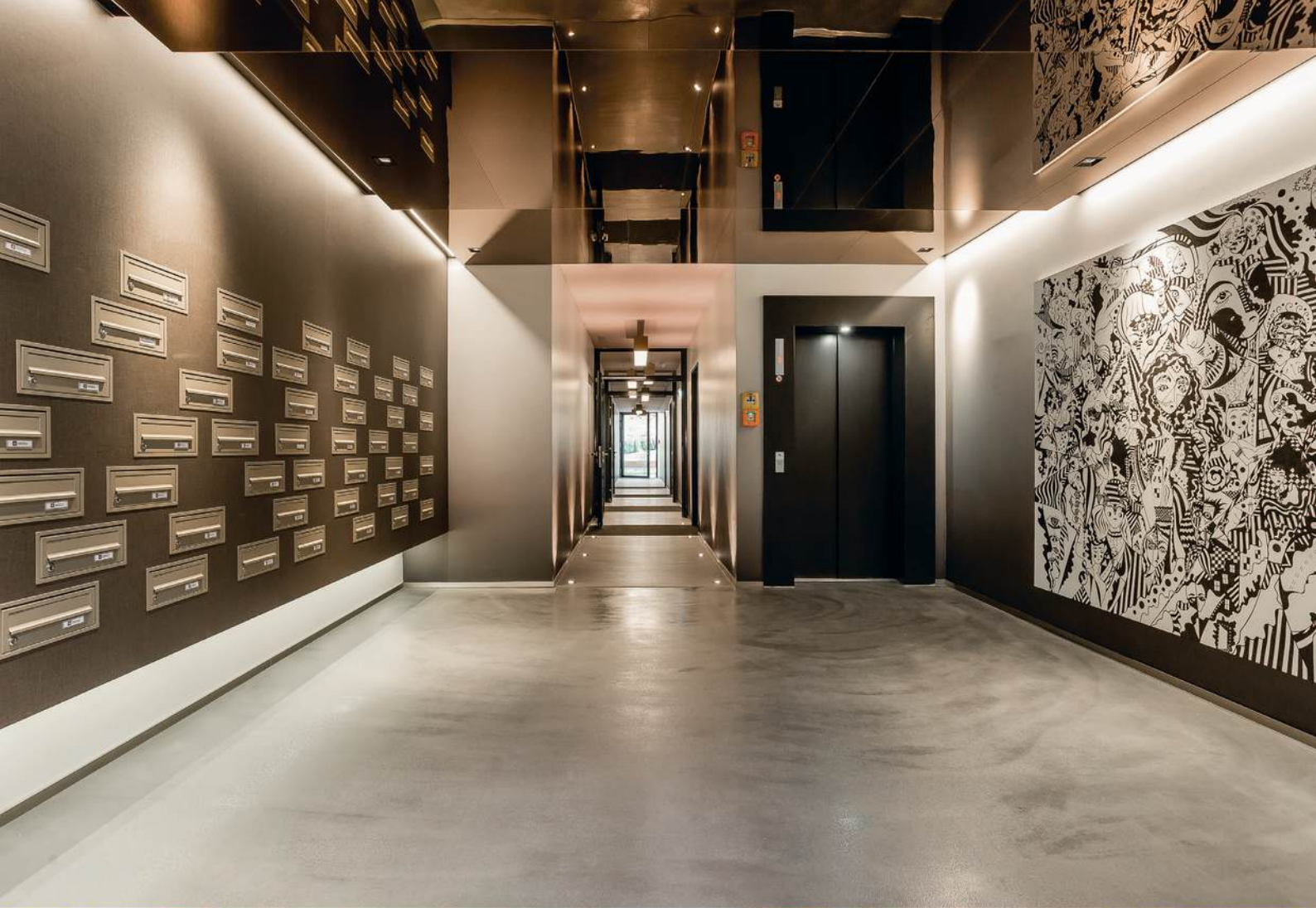
Hauseingang und Hausansicht