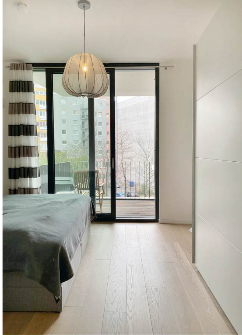
Schlafzimmer mit direktem Zugang zum Balkon