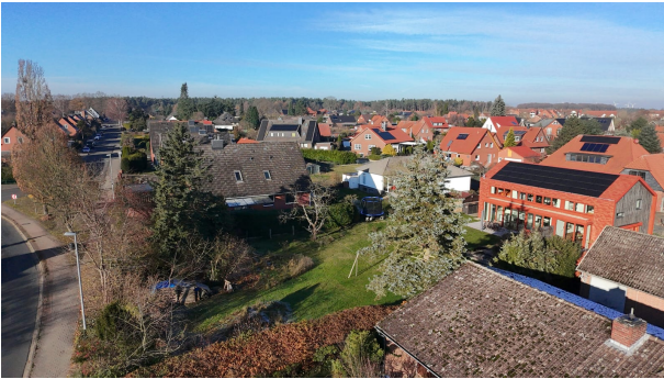
Ansicht mit Straßenzugang