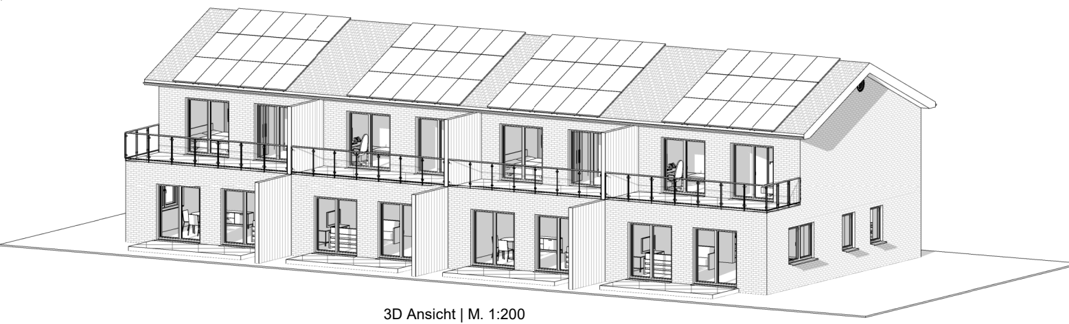
3D Ansicht | M. 1:200