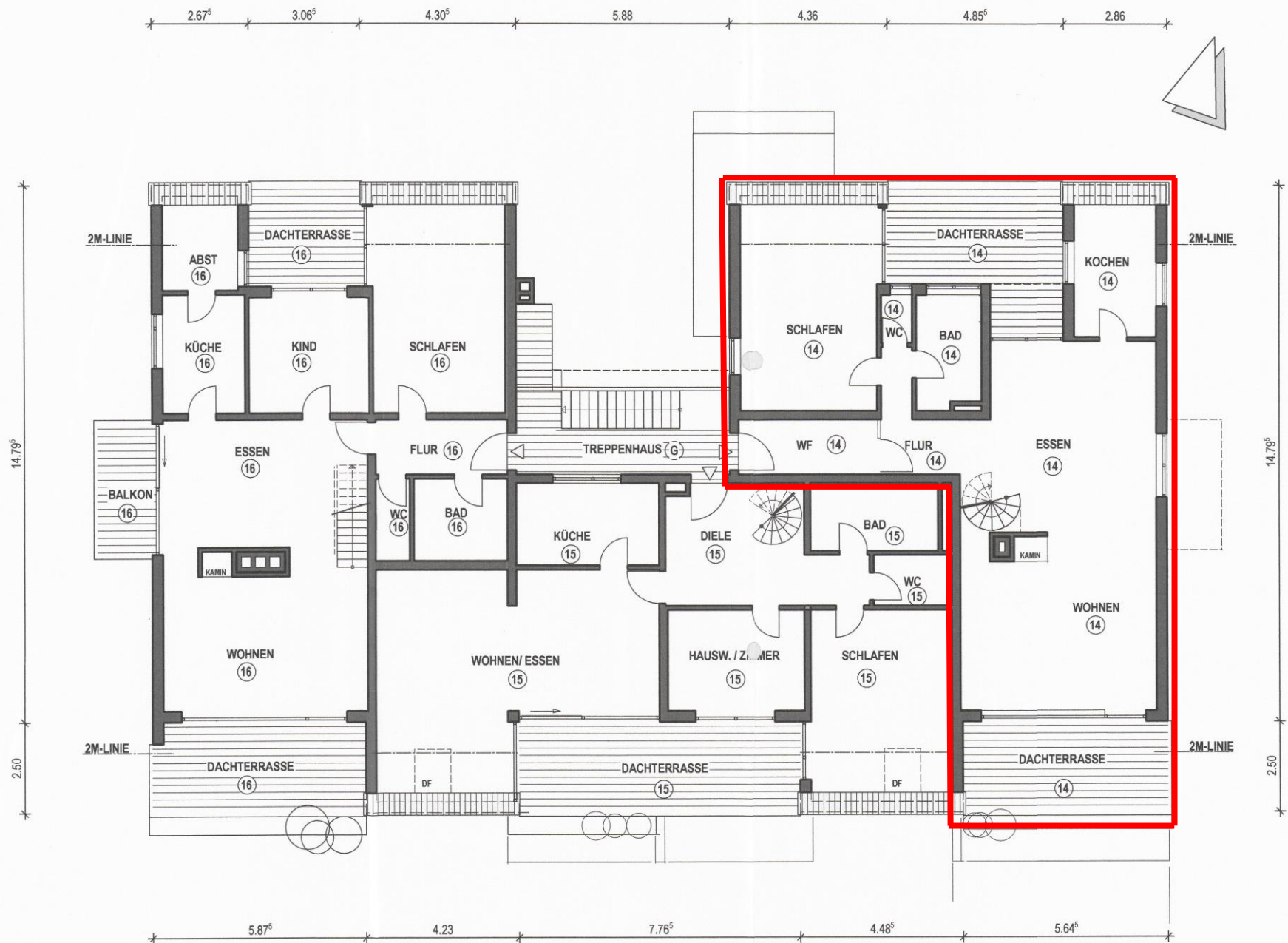
DACHGESCHOSS - EBENE 1