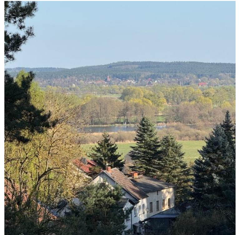
Blick in den Oderbruch vom oberen Teil des Grundstücks