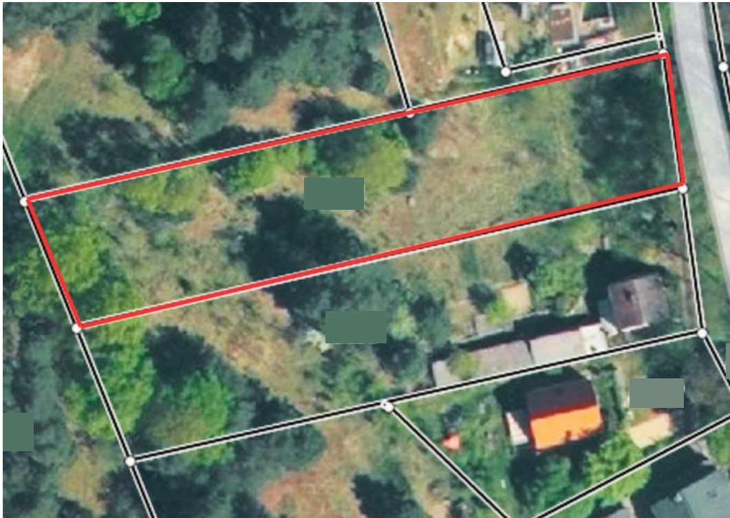
Auszug aus der Flurstückkarte

Ruhige Lage | provisionsfrei | Bieterverfahren | Mindestgebot