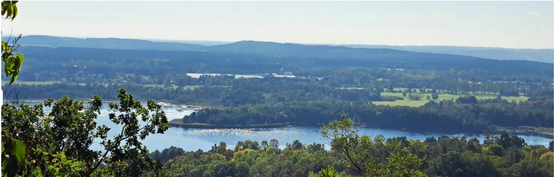
Blick in den Oderbruch vom Pimpinellenberg (10 Minuten vom Grundstück)

Liepe , ein altes Fischerdorf, liegt am Hang des Barnim mit Blick ins Oderbruch. Es gehört zum Amt Britz-Chorin-Oderberg und hat ca. 730 Einwohner. Im Ort befinden sich ein Kindergarten sowie ein Landgut mit Hotel und Restaurant.