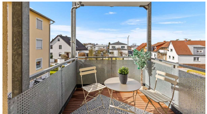
Balkon 6,5 m 2 – Blick ins Weinberg-Viertel