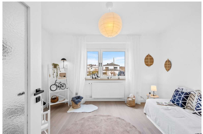
Kinderzimmer / Arbeitszimmer 13 m 2