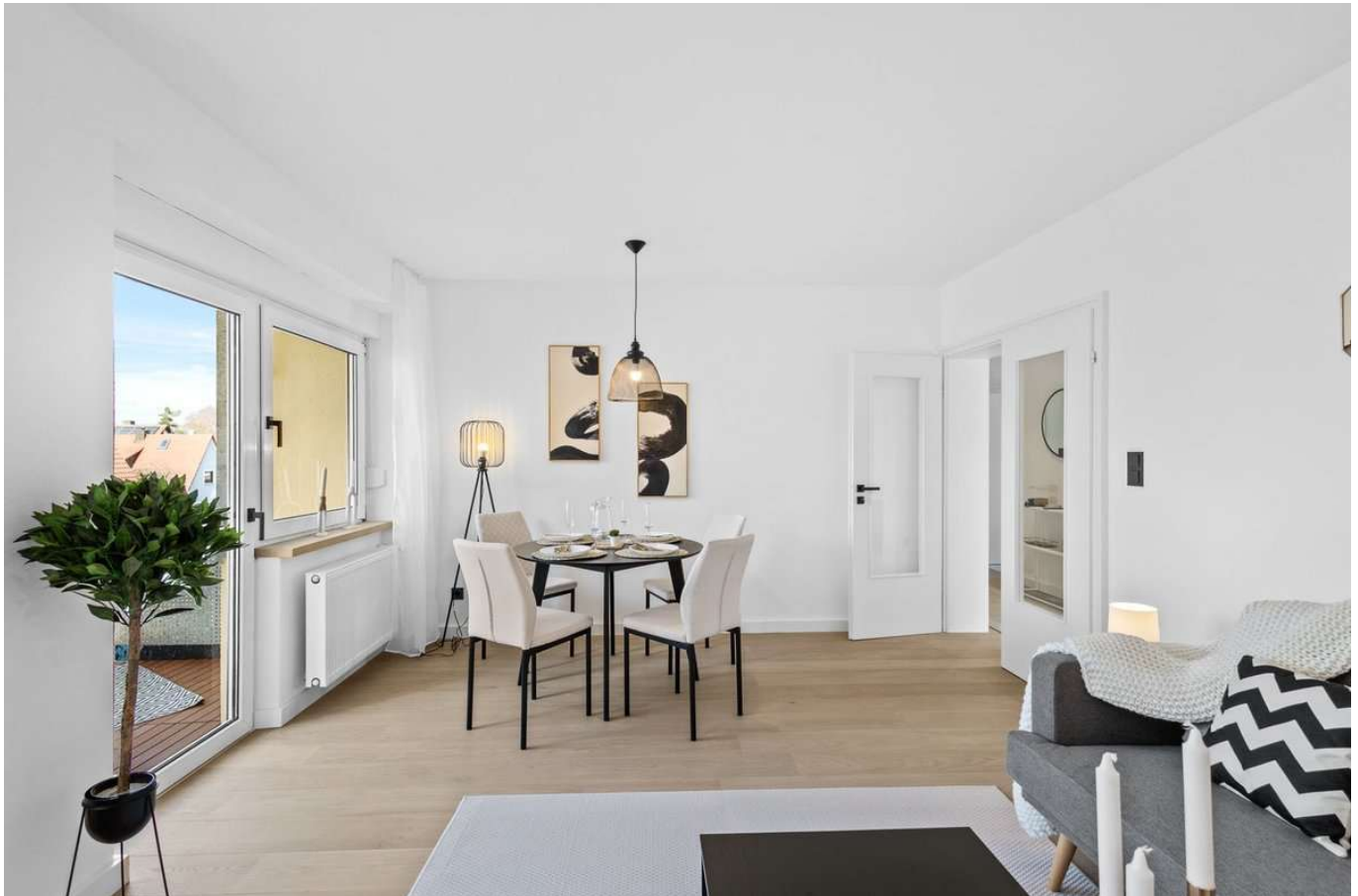
Wohnzimmer mit direktem Balkoneinstieg – lichtdurchflutet und großzügig