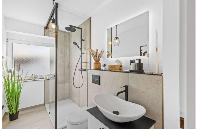
Designer-Bad mit Regendusche & schwarzem Design