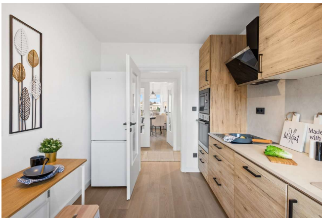
Einbauküche – vollständig ausgestattet