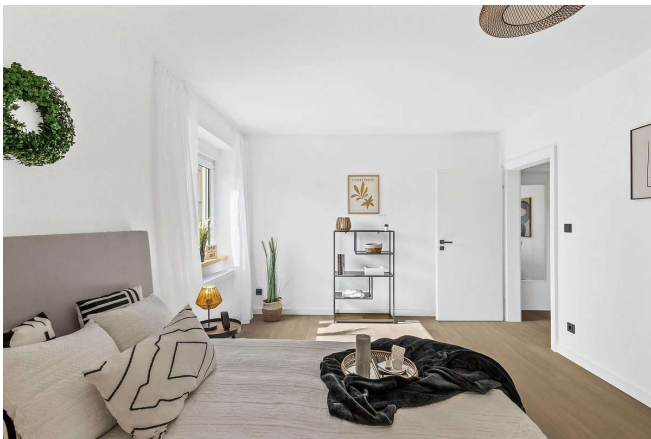
Schlafzimmer 16 m 2