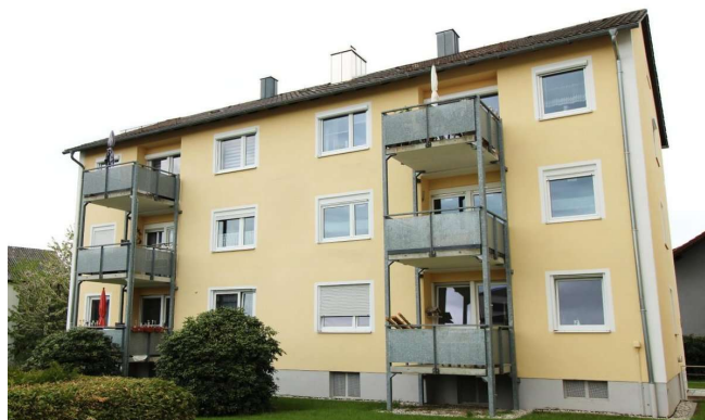
Außenansicht – Grillparzerplatz 9a, Schwandorf