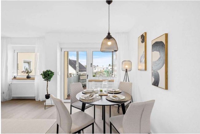
Wohn- und Essbereich mit Balkontür