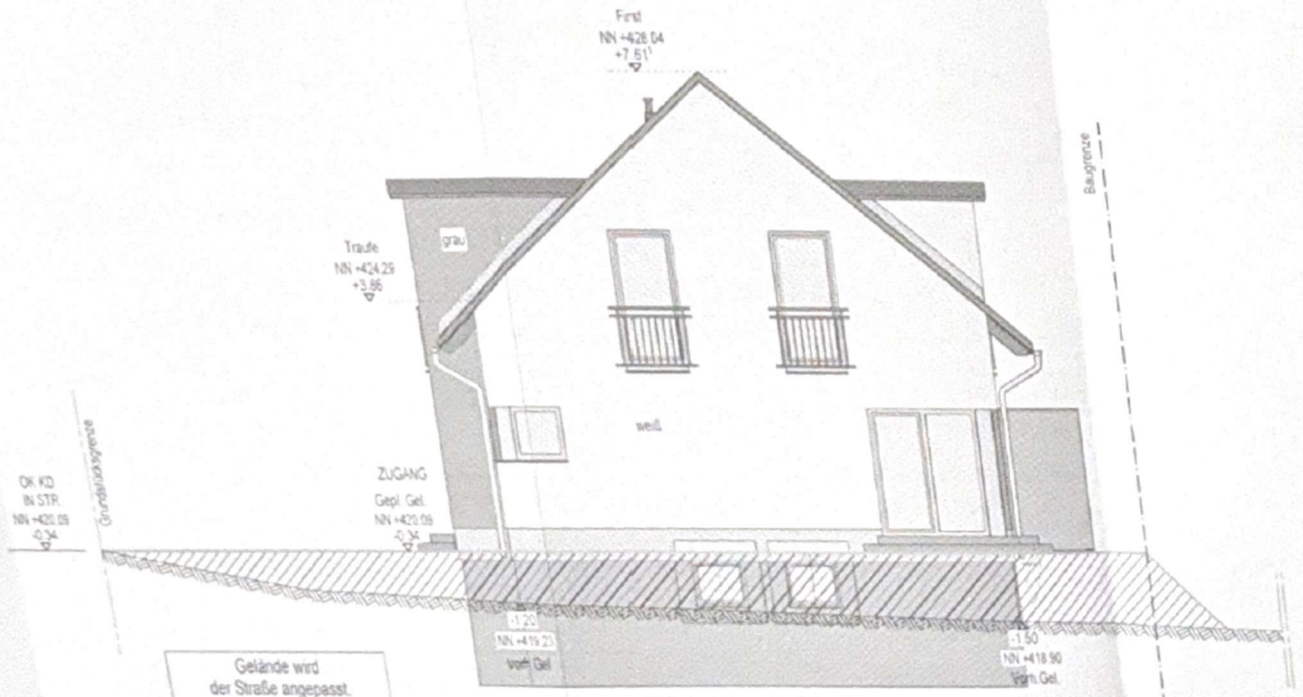
ANSICHT OST (Gelände an Grenze)

Gelände wird der Straße angepasst. ggf. Abfangungsmaßnahmen = Eigenleistung Bauherr