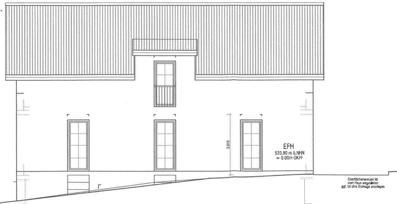
Ansicht 3 West

Oberflächenwasser ist vom Haus wegzuleiten ggf. ist eine Drainage anzulegen