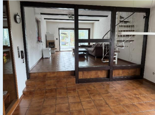
Esszimmer Richtung Wohnzimmer