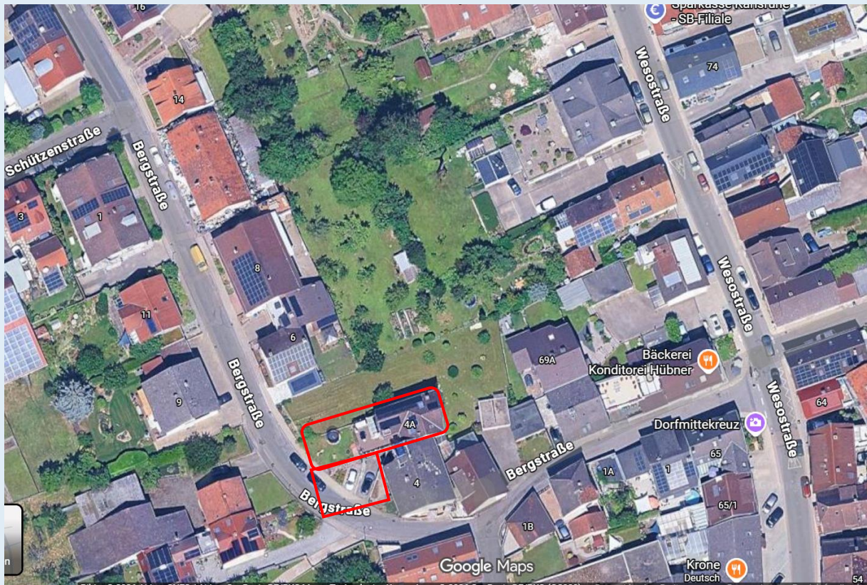
Luftbild / Lageplan Wöschbach

Das Haus liegt in einer ruhigen Wohnstraße im idyllischen Pfinztal-Wöschbach – einem kleinen, familienfreundlichen Ortsteil östlich von Karlsruhe, eingebettet ins Tal der Pfinz und am Rande des Schwarzwaldes. Rund zwei Drittel der Umgebung stehen unter Landschaftsschutz, Rad- und Wanderwege starten quasi vor der Haustür.