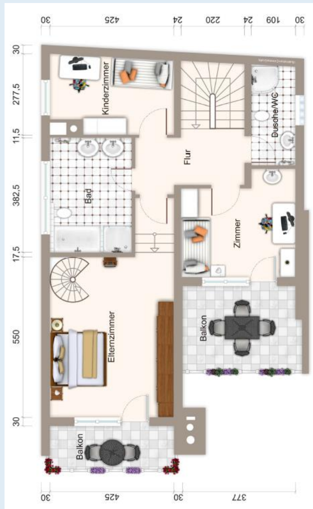
Grundriss 1. OG