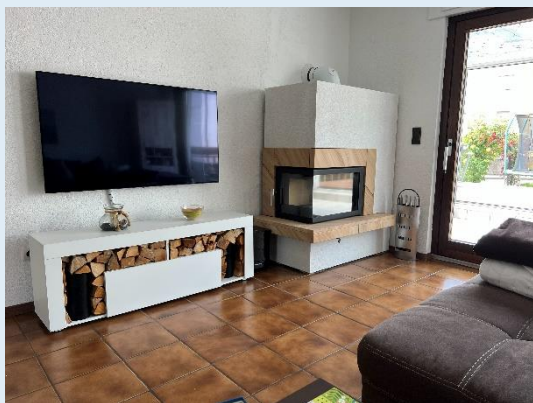
Wohnzimmer / Kamin