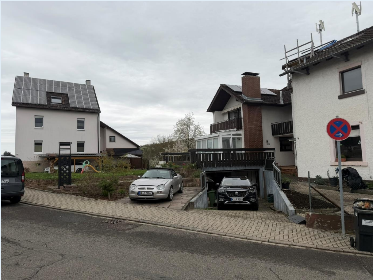
Seitenansicht / Außenbereich ]