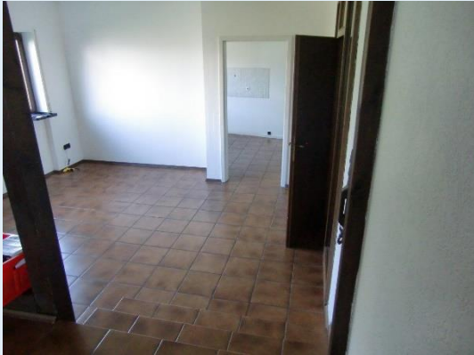
Esszimmer/ Eingang Küche