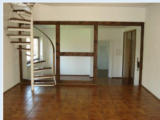
Wohnzimmer Richtung Esszimmer