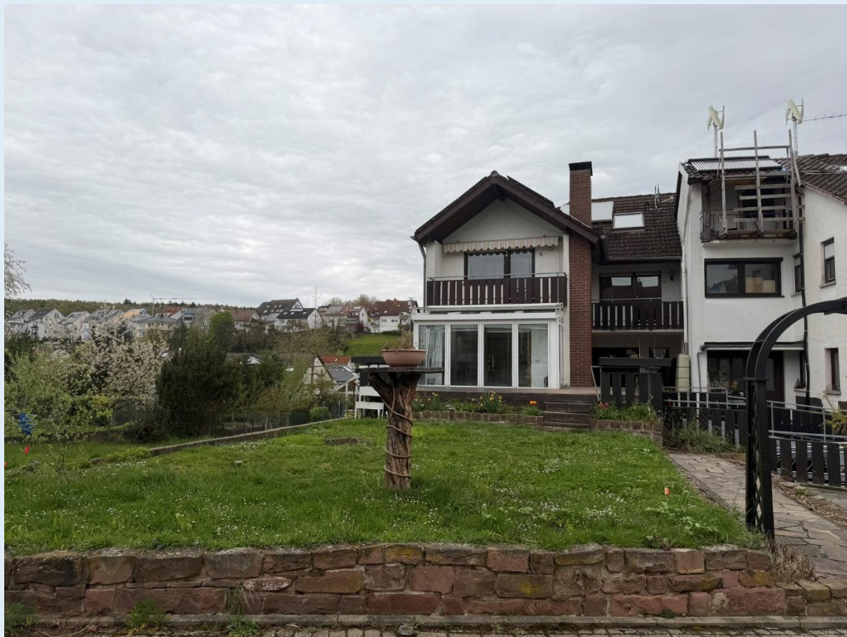
Front / Außenansicht