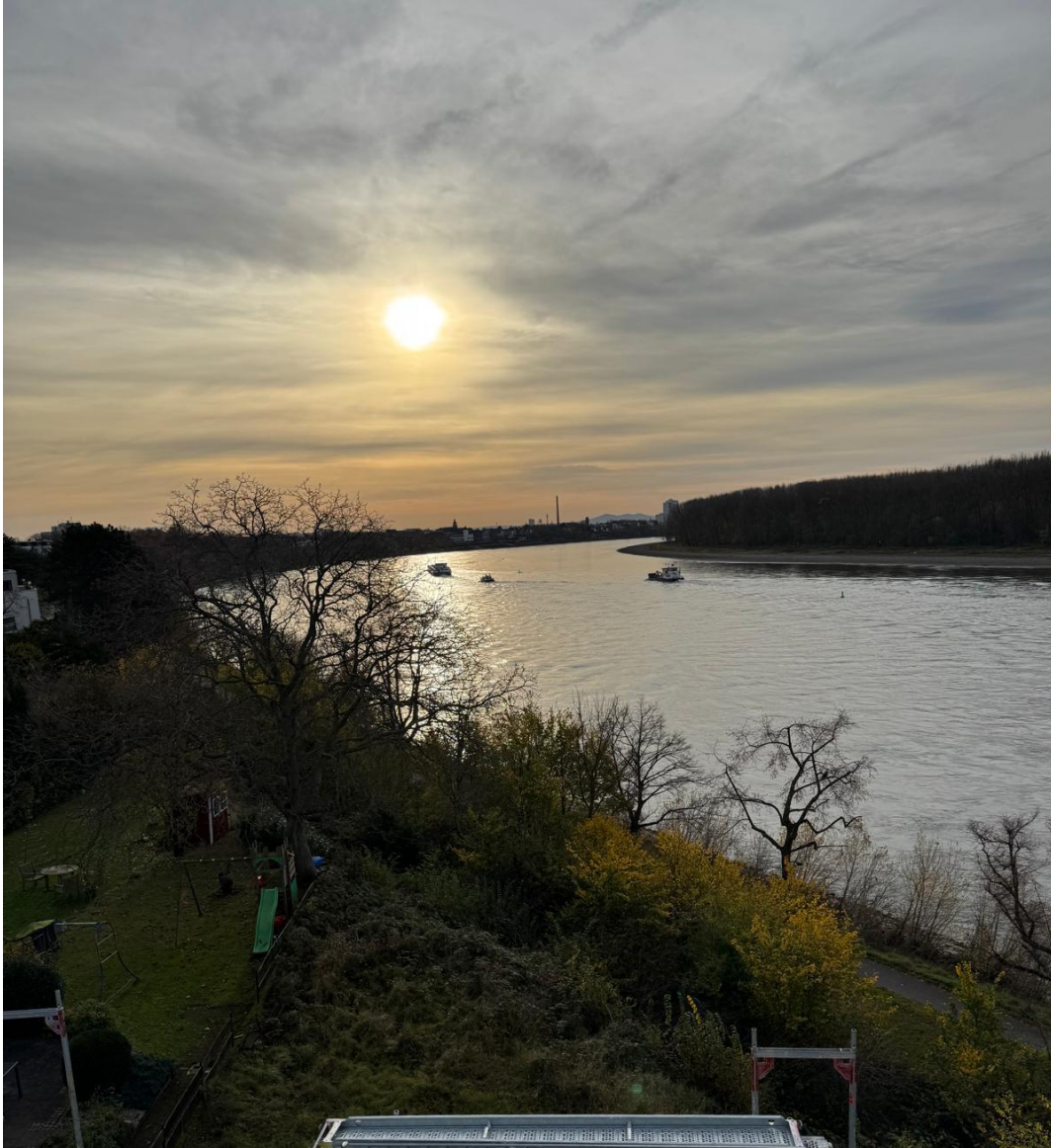
Blick rheinaufwärts von der Dachterrasse