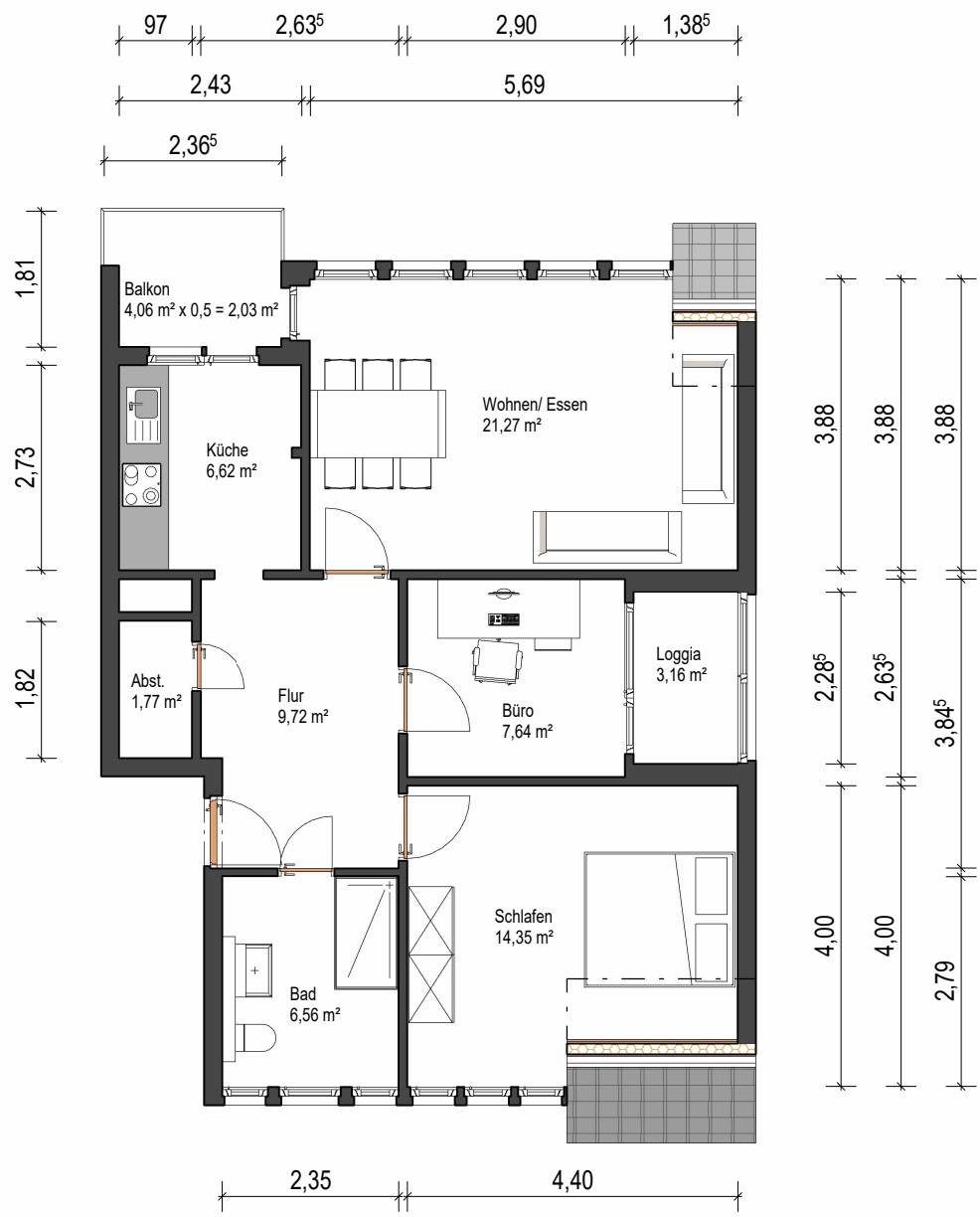
Grundriss Wohnung Dachgeschoss