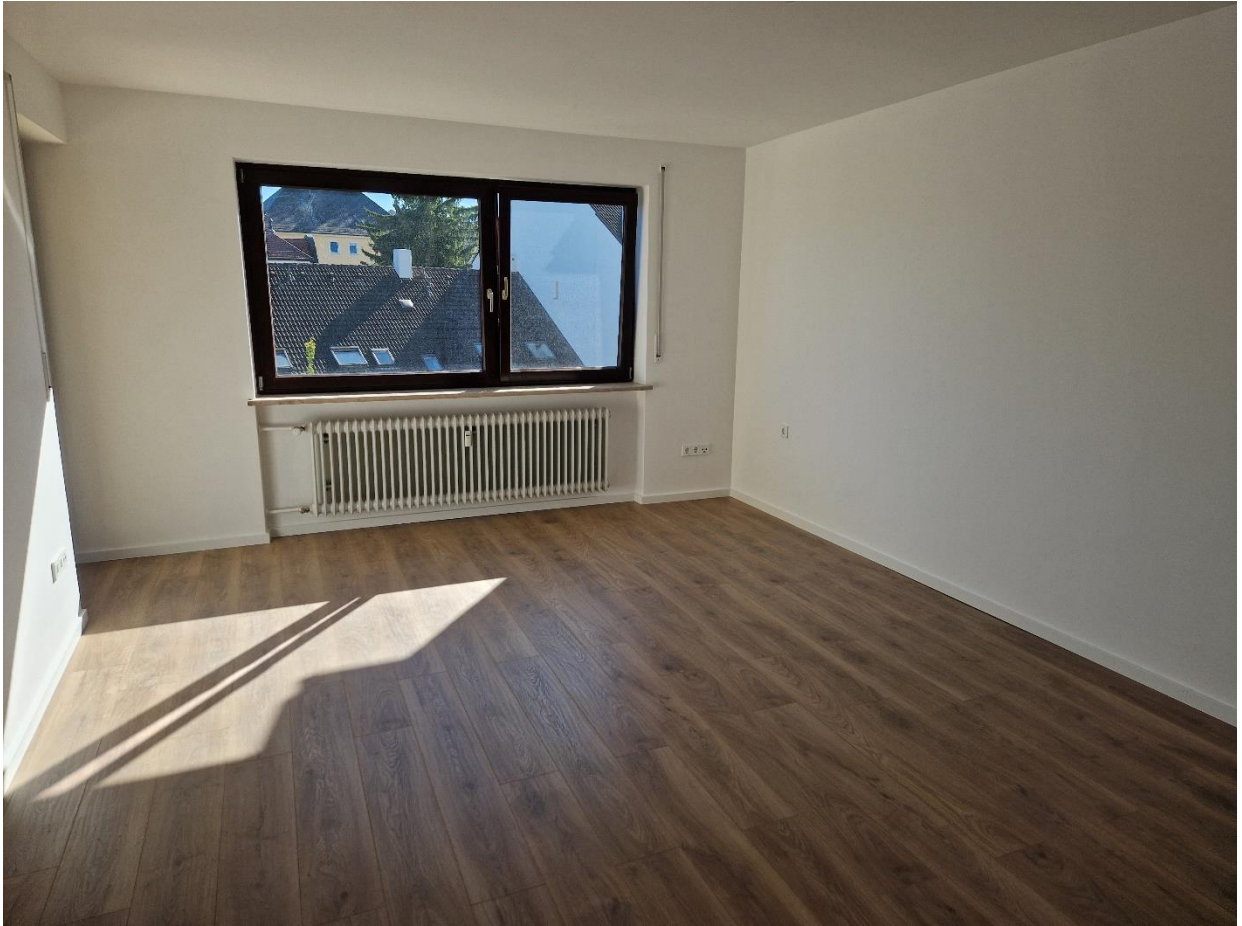
Abbildung 3: Wohnzimmer