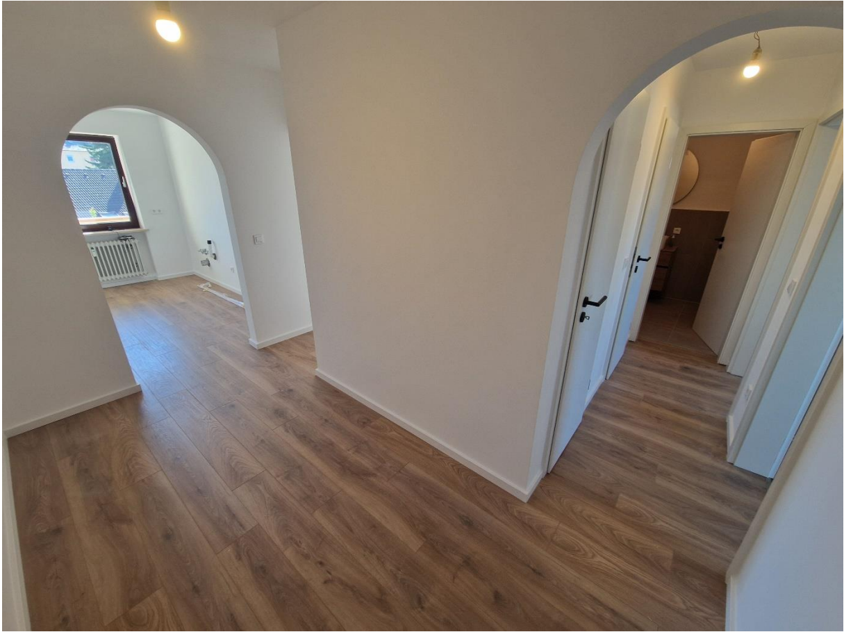
Abbildung 11: Diele und Gang