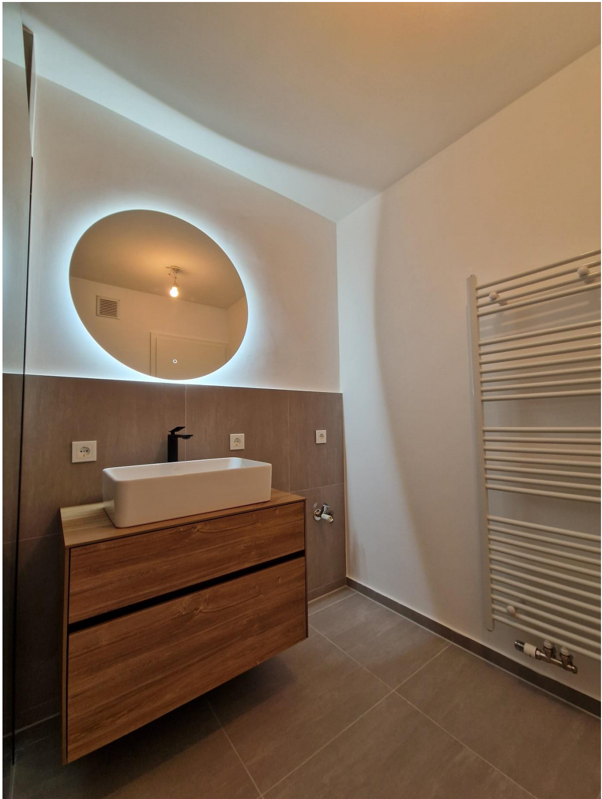
Abbildung 5: Bad Ansicht 2