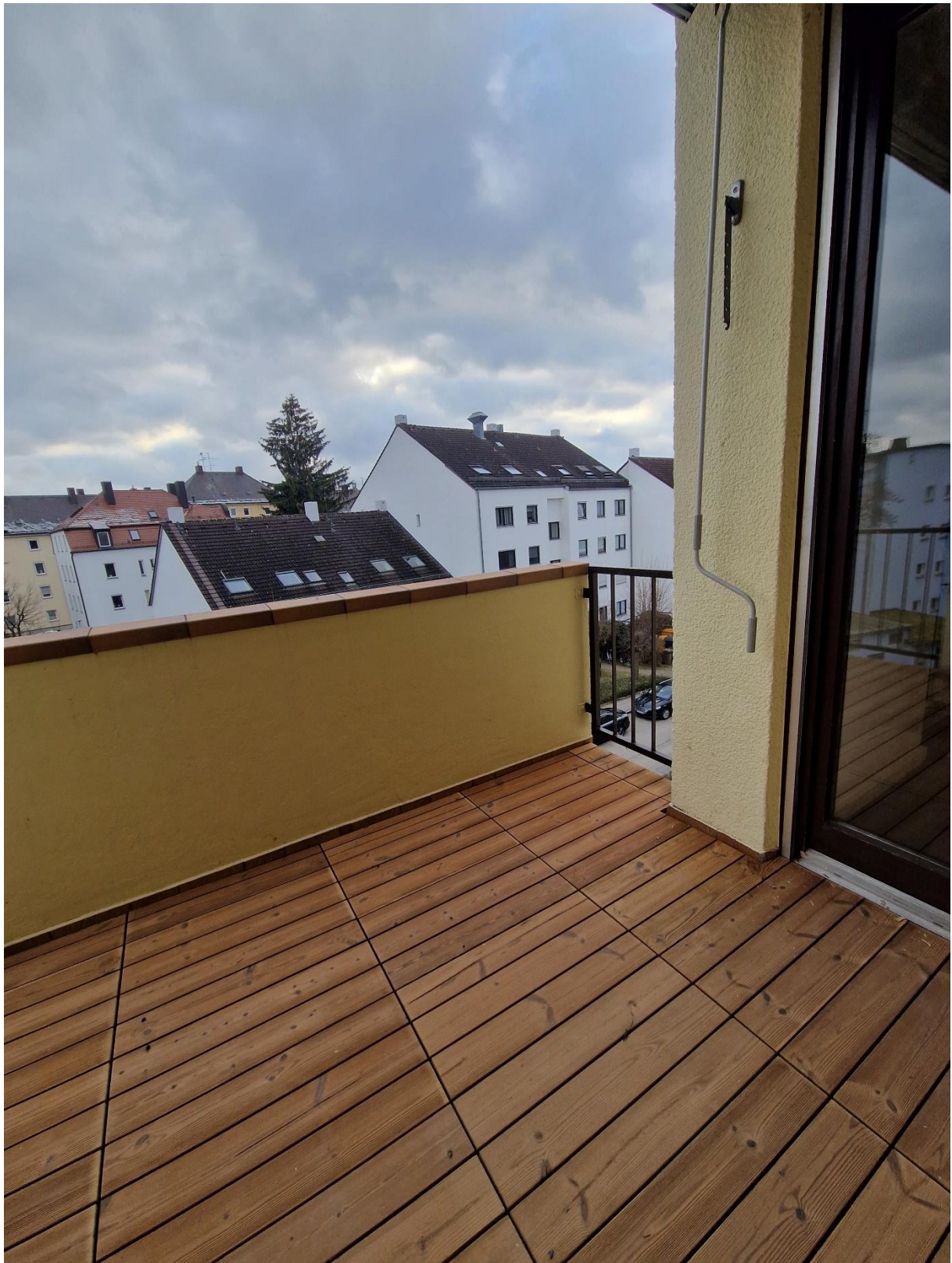
Abbildung 14: Südbalkon