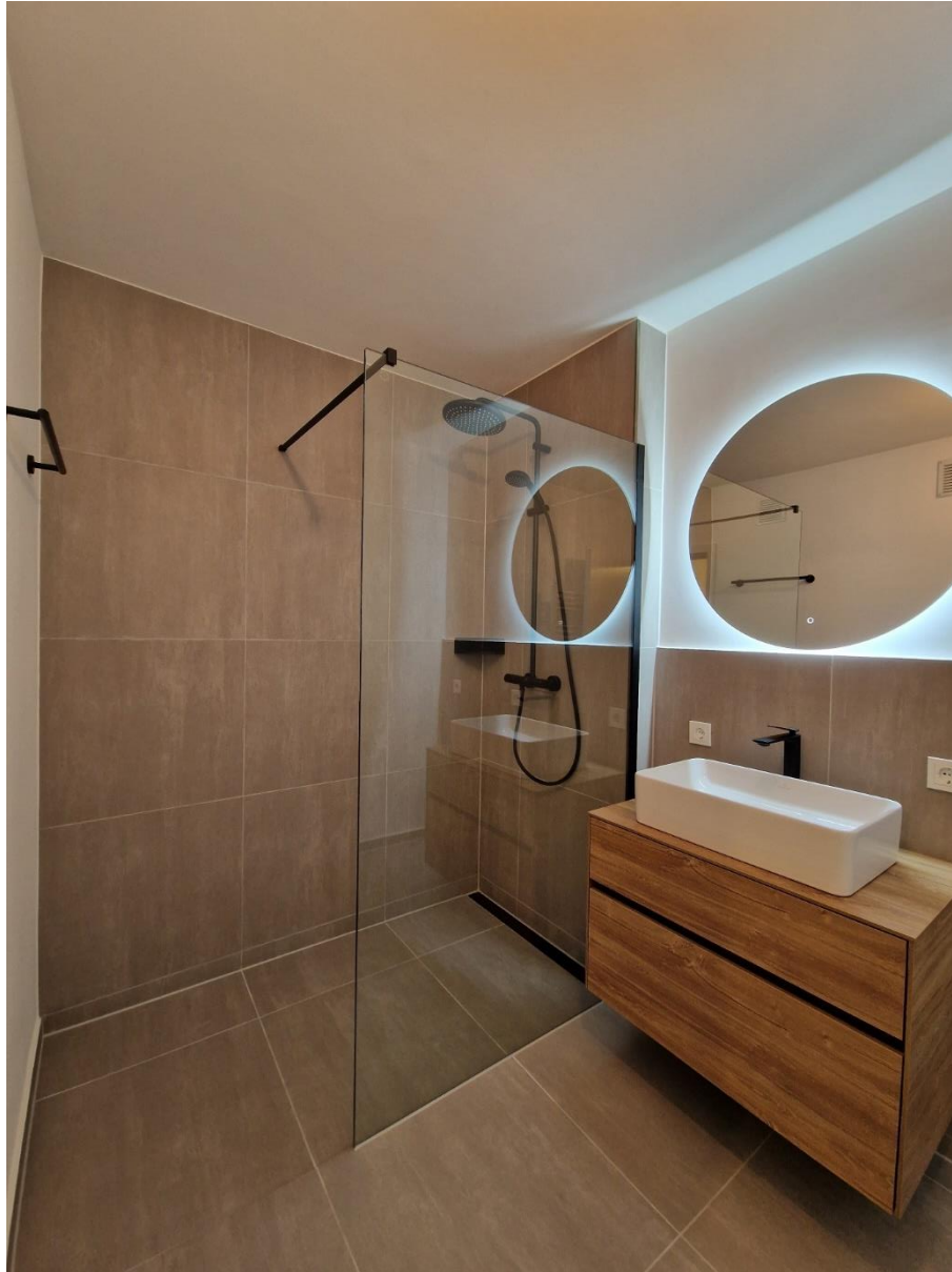
Abbildung 1: Modernisiertes Bad

Pfersee-Nord, Pater-Roth-Str.26, 86157 Augsburg