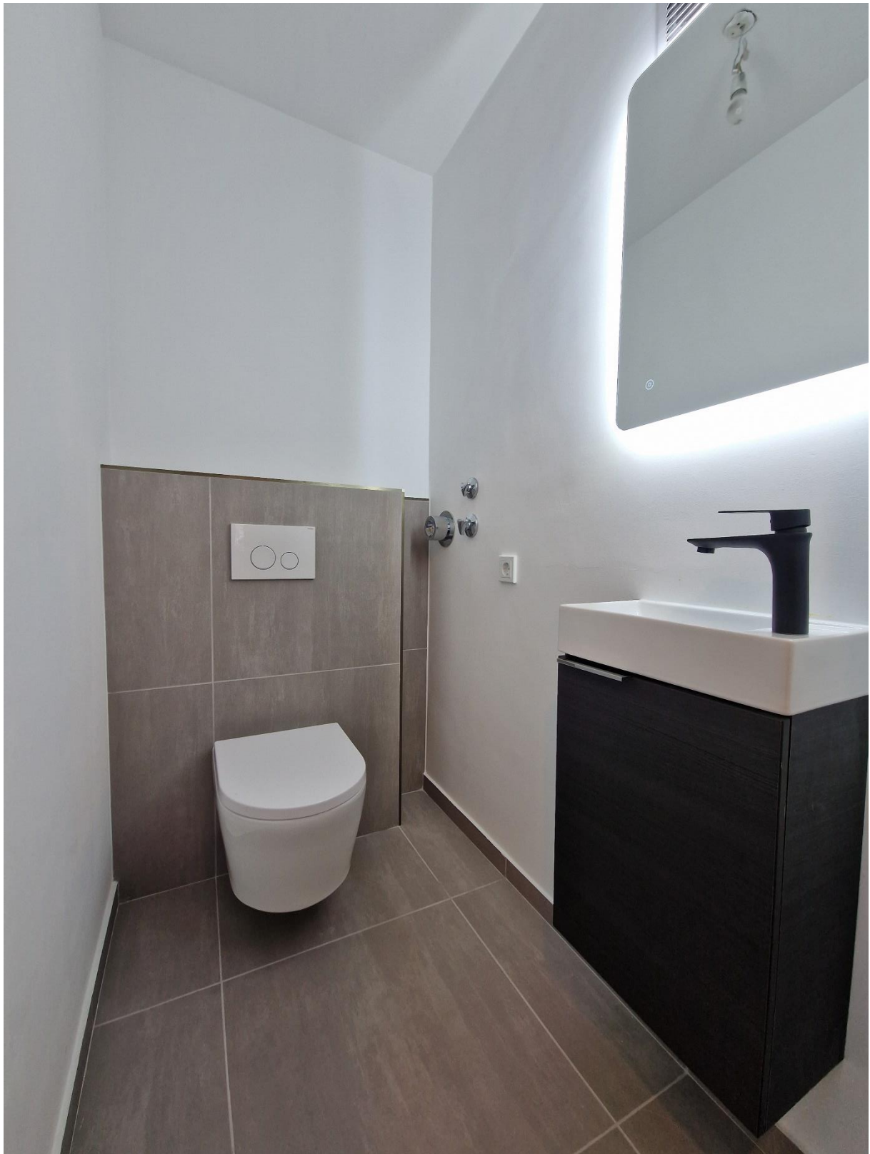
Abbildung 6: WC