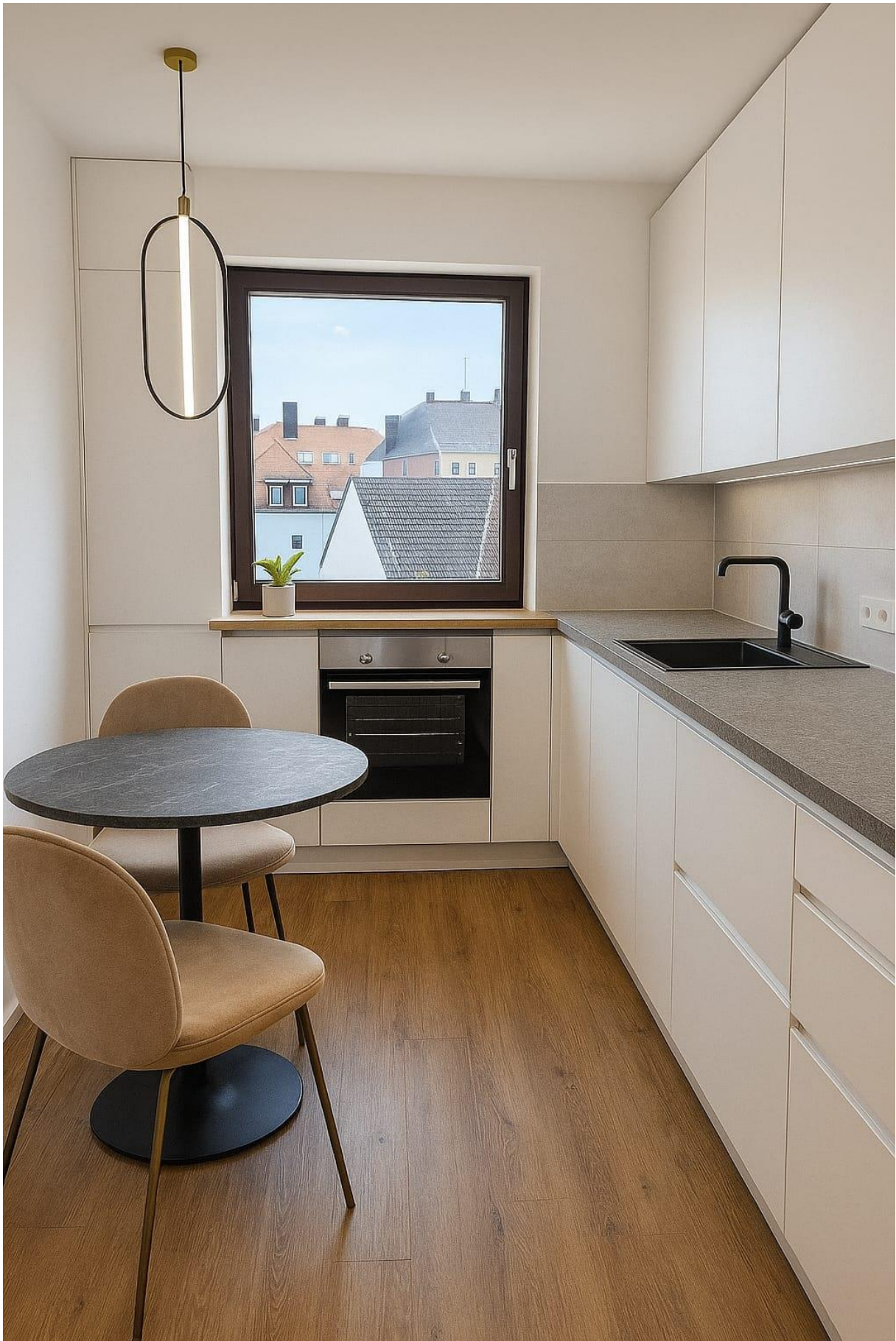
Abbildung 13: Küche KI-Staged