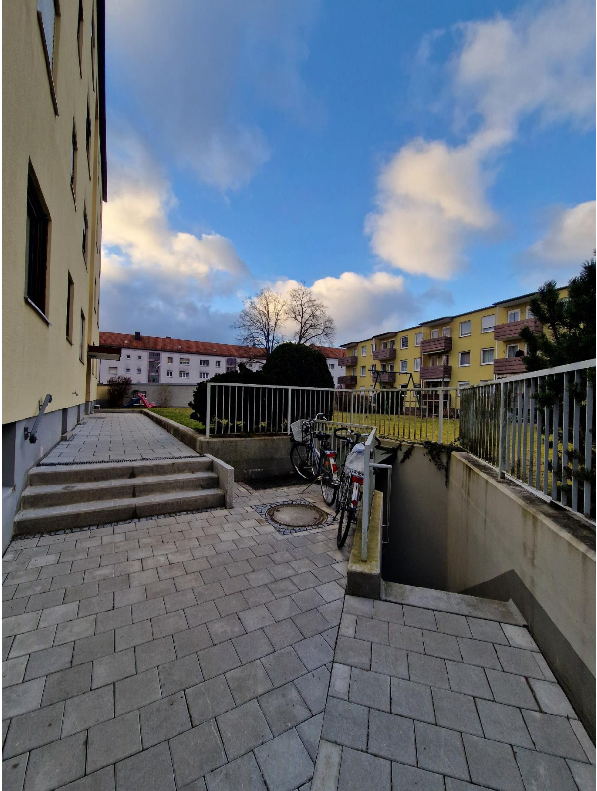
Abbildung 16: Innenhofbereich