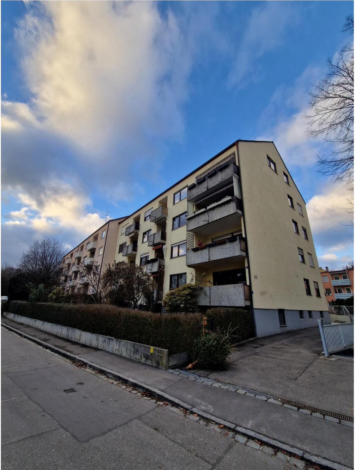
Abbildung 17: Straßenansicht