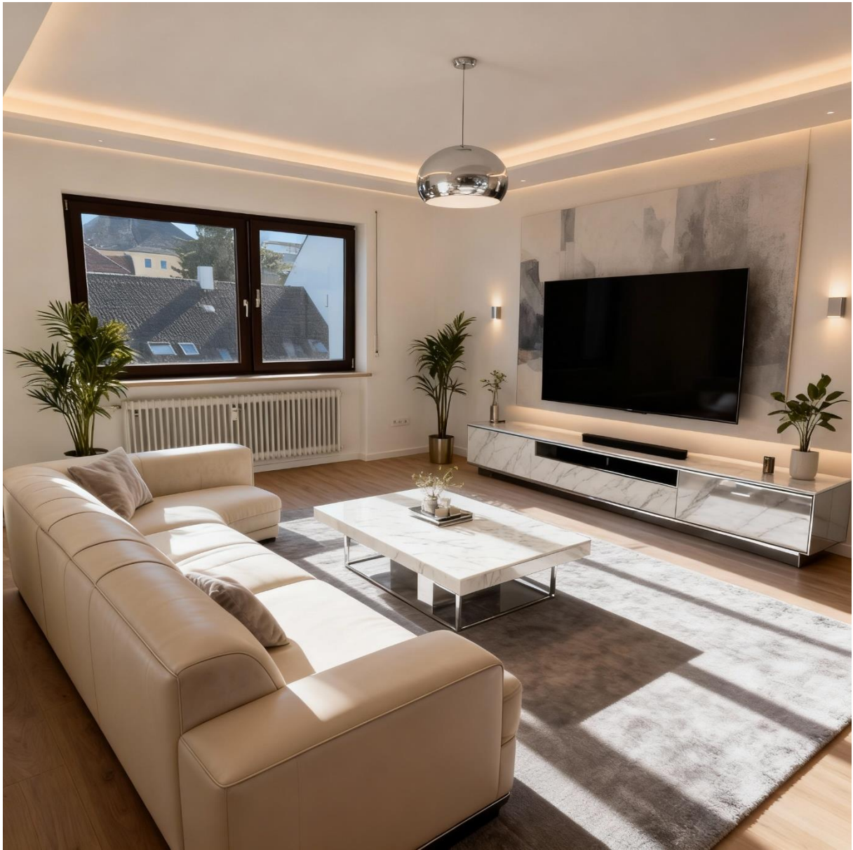
Abbildung 2: Wohnzimmer KI Staged