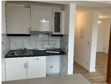
Wohnraum – Eingang – Küche/Essbereich