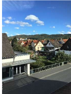
Bad – Grundriss – Ausblick