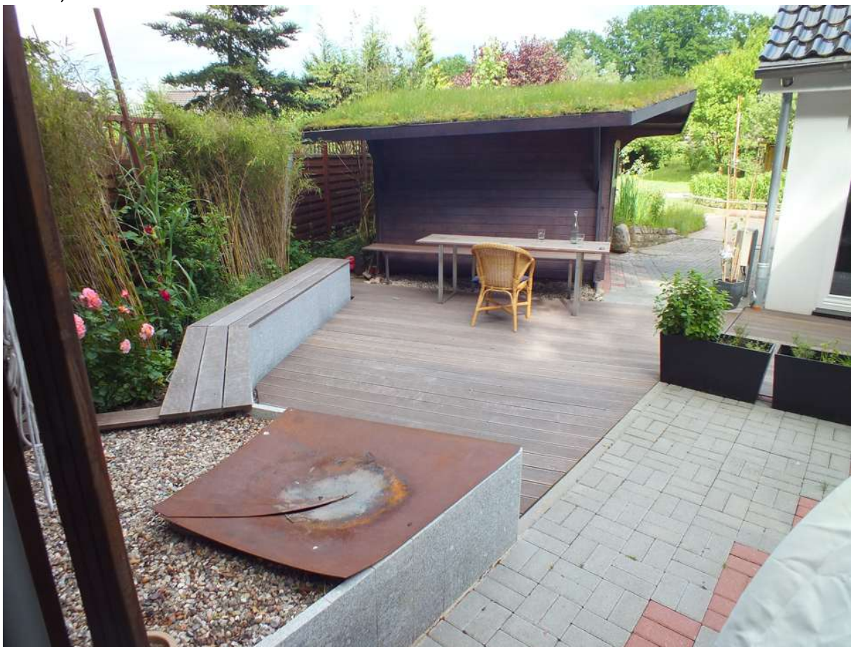
Innenhof, Blick nach Osten