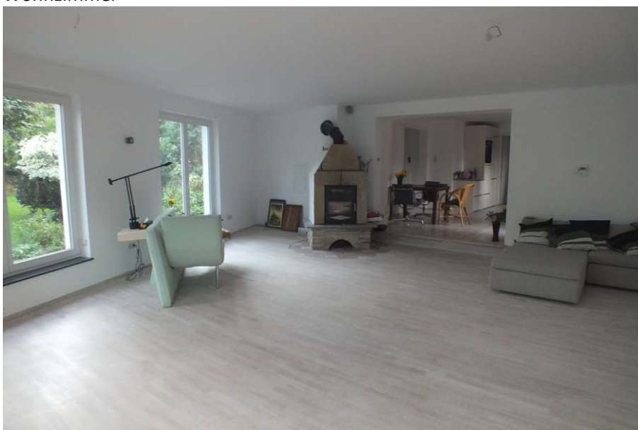
Kamin im Wohnzimmer