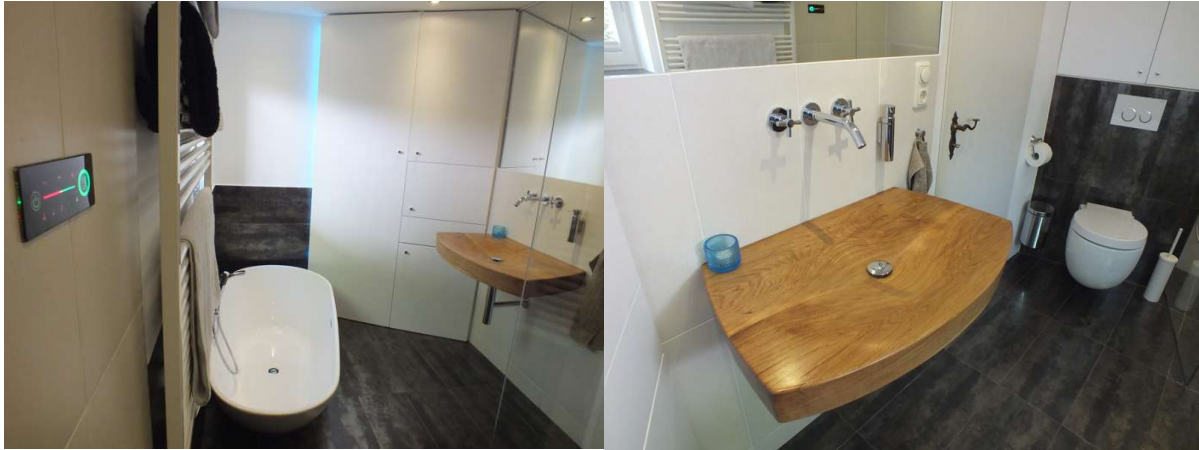
Vollbad mit Badewanne und Holzwaschbecken