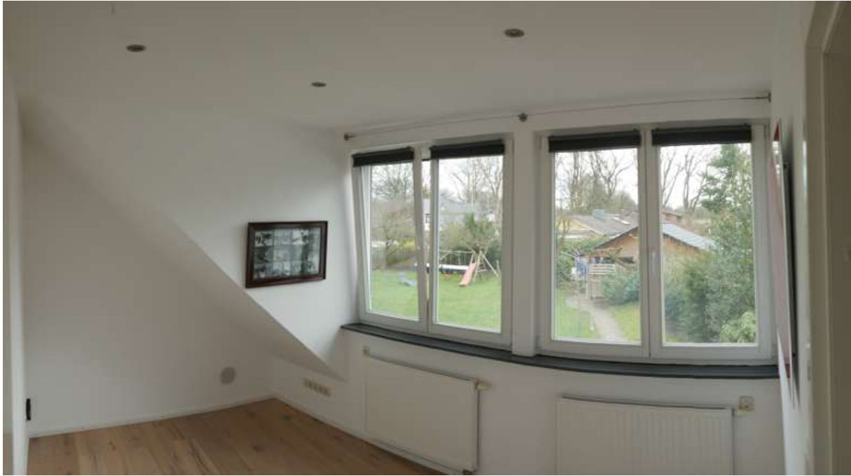
Kind 3, Blick nach Osten