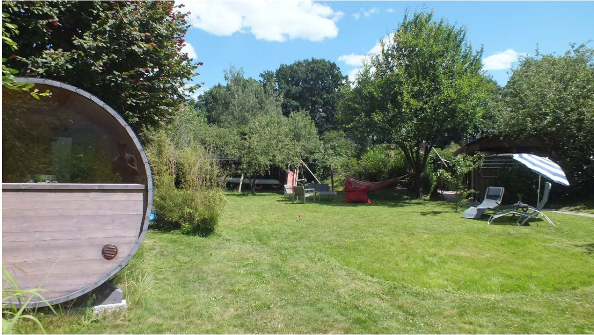
Garten, Blick nach Osten