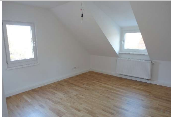
Zimmer 1 mit 2 Fenstern