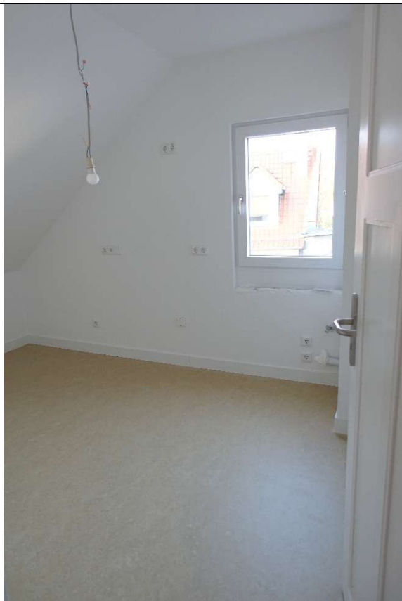
Küche, vormontierte Anschlüsse für Küchenzeile