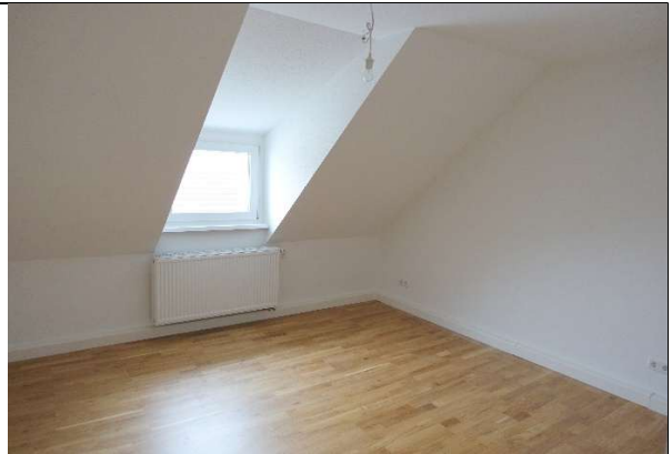
Zimmer 2 mit einem Fenster