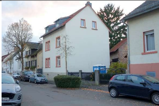
Haus mit der Wohnung im 2. Stock