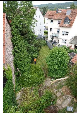
Teil von Hof und Garten, im Hintergrund Kirdorfer Feld und Taunus