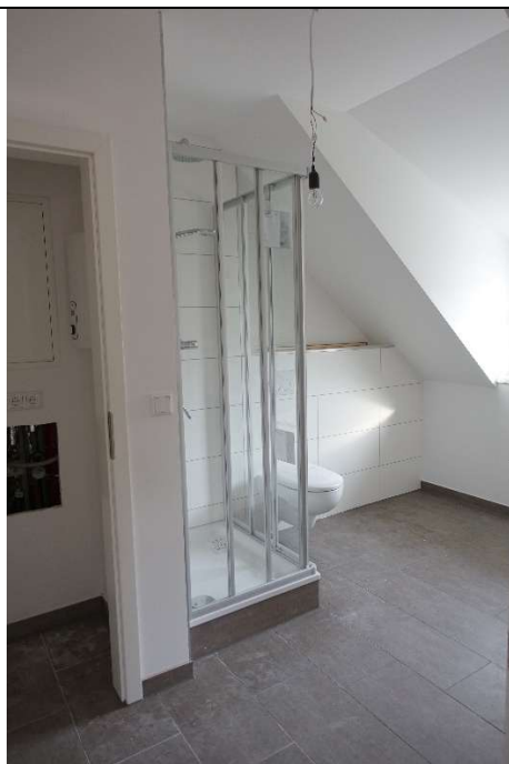
Bad mit Blick auf die Abstellkammer links