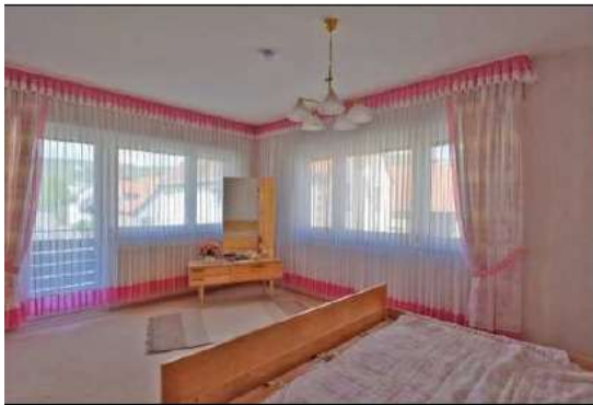
Schlafzimmer mit Zugang auf den Balkon