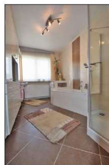
Modernes Bad in der Hauptwohnung