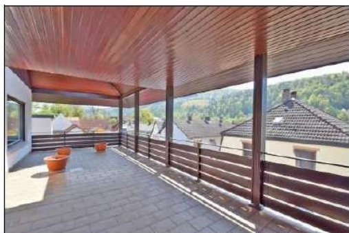
Großer überdachter Balkon der Haupt-Wohnung