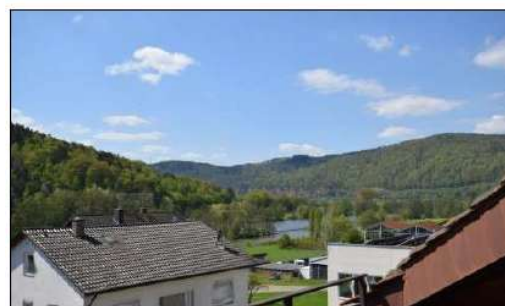
Herrlicher Mainblick vom Balkon im Dachgeschoss