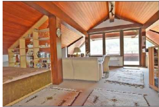
Nachträglich ausgebautes Dachgeschoss mit Balkon, gehört zur Hauptwohnung