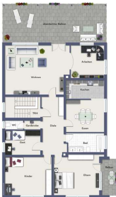
Obergeschoss, Wohnung 1