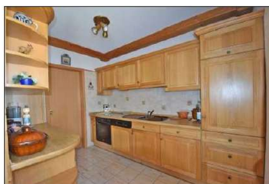
Küche mit Speisekammer der Hauptwohnung