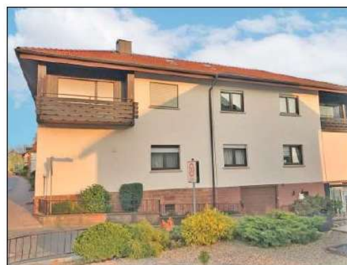
Seitenansicht mit Garage