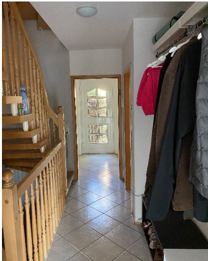
Abbildung 1 Diele

Im Erdgeschoss geht vom Windfang ein taghelles Gäste-WC ab. Danach erfreut die Diele mit einem Garderobenbereich.