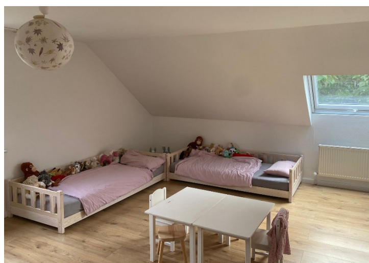
Abbildung 7 Kinderzimmer