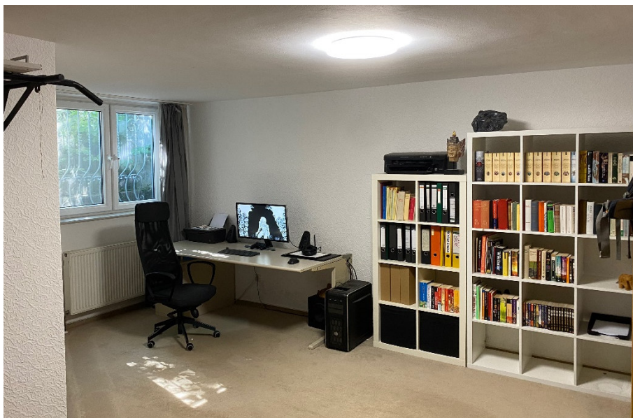
Abbildung 9 Hobbyraum/Büro

Das Untergeschoss überzeugt durch einen beheizbaren Hobbyraum mit großem Fenster, der auch als Büro genutzt werden kann. Darüber hinaus stehen Vorratsräume, ein Heizungsraum und ein weiterer Raum zur Verfügung.