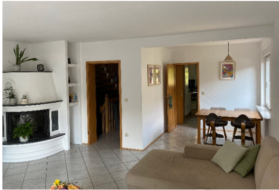
Abbildung 3 Essbereich