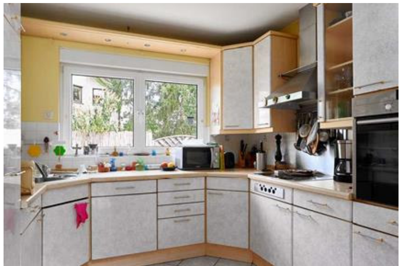
Abbildung 2 Küche

Daneben öffnet sich die zeitgemäße Einbauküche, die eine zweite Tür zum Essbereich hat. Dieser bildet mit dem Wohnbereich ein herrliches Refugium, das durch die Fenster-/Türfront zur Südterrasse stark tagesbelichtet wird. Das Erdgeschoss ist gefliest und mit Fußbodeneizungen ausgestattet. Der Kamin im Wohn- und Essbereich vermag die Gemütlichkeit zu steigern.