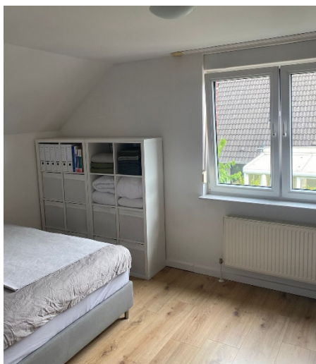
Abbildung 6 Schlafzimmer

Im Obergeschoss befinden sich ein zweckmäßiges Schlafzimmer und ein sehr großes Kinderzimmer, wobei beide Zimmer auch unterschiedlich genutzt werden können.