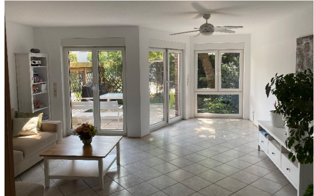
Abbildung 4 Wohnbereich