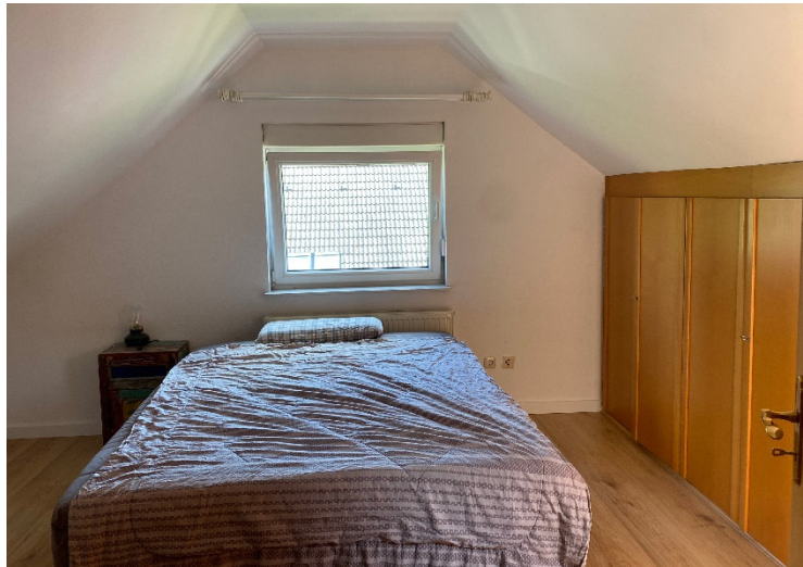
Abbildung 8 Schlafzimmer im Spitzboden

Der Spitzboden ist über eine feste Treppe erreichbar und wurde zu Wohnzwecken z. B. Schlafzimmer ausgebaut. In die Dachschrägen wurden praktische Schränke integriert, die zusätzlichen Stauraum bieten.