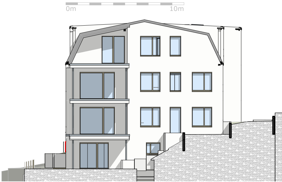
ANSICHT OST (GARTEN)

BAUVORHABEN: NEUBAU MEHRFAMILIENHAUS NÄHE KIRSCHENHAIN 63773 GOLDBACH GRUBER & SEIDL GbR. KIRSCHENHAIN