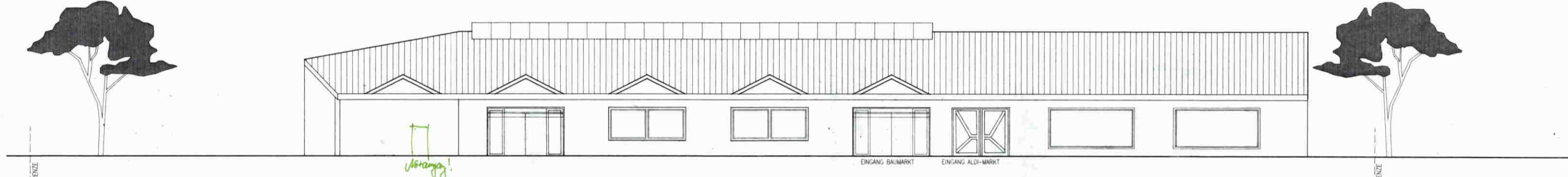
NORDANSICHT M.: 1:100