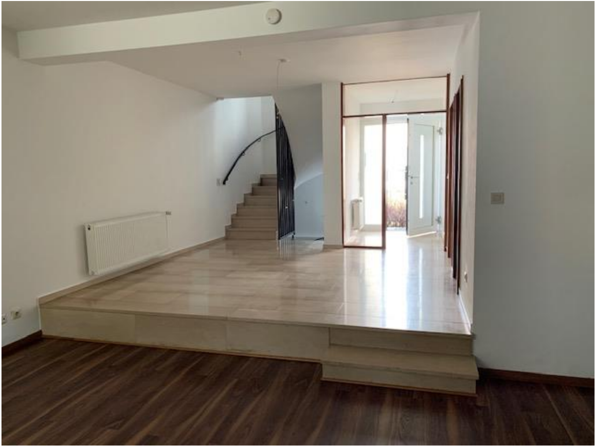
EG, Blick zurück vom Wohnzimmer zum Esszimmerbereich