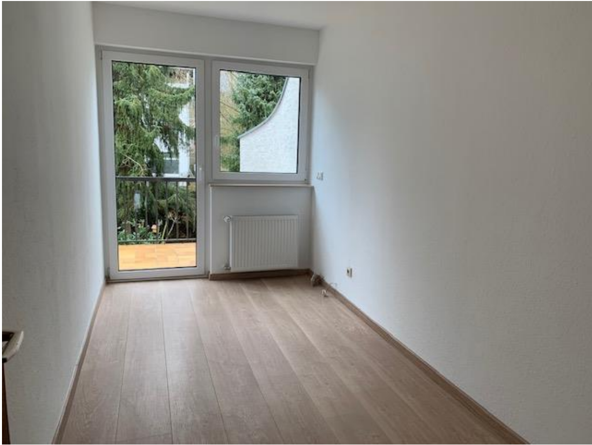
1. OG, Zimmer 3 (9,85 qm)