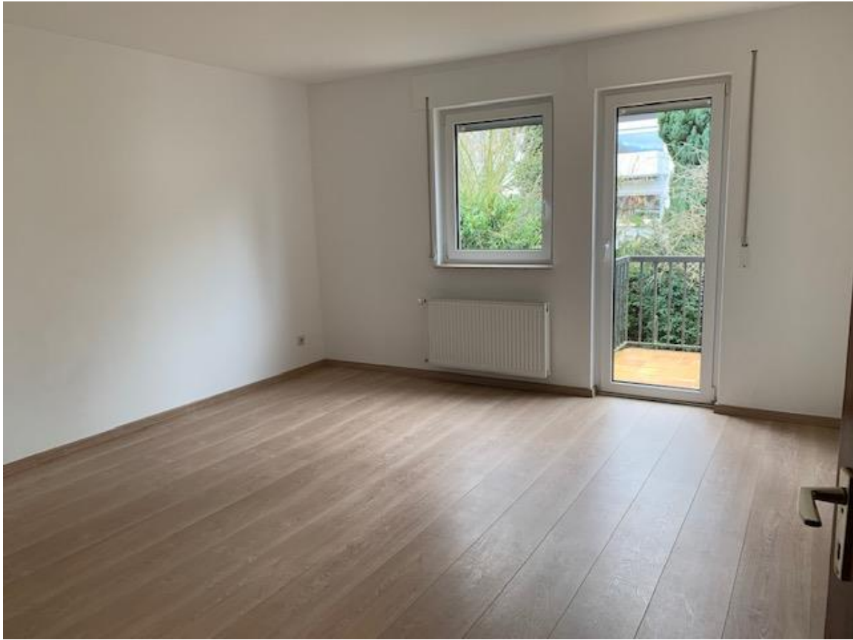
1. OG, Zimmer 2 (17,70 qm)