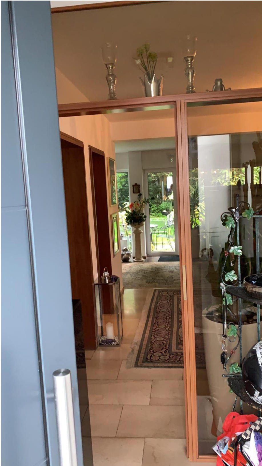
Blick von Haustür ins Wohnzimmer