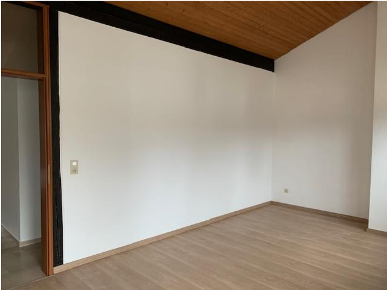
2. OG, großes Zimmer/„Studio“ mit hoher Decke