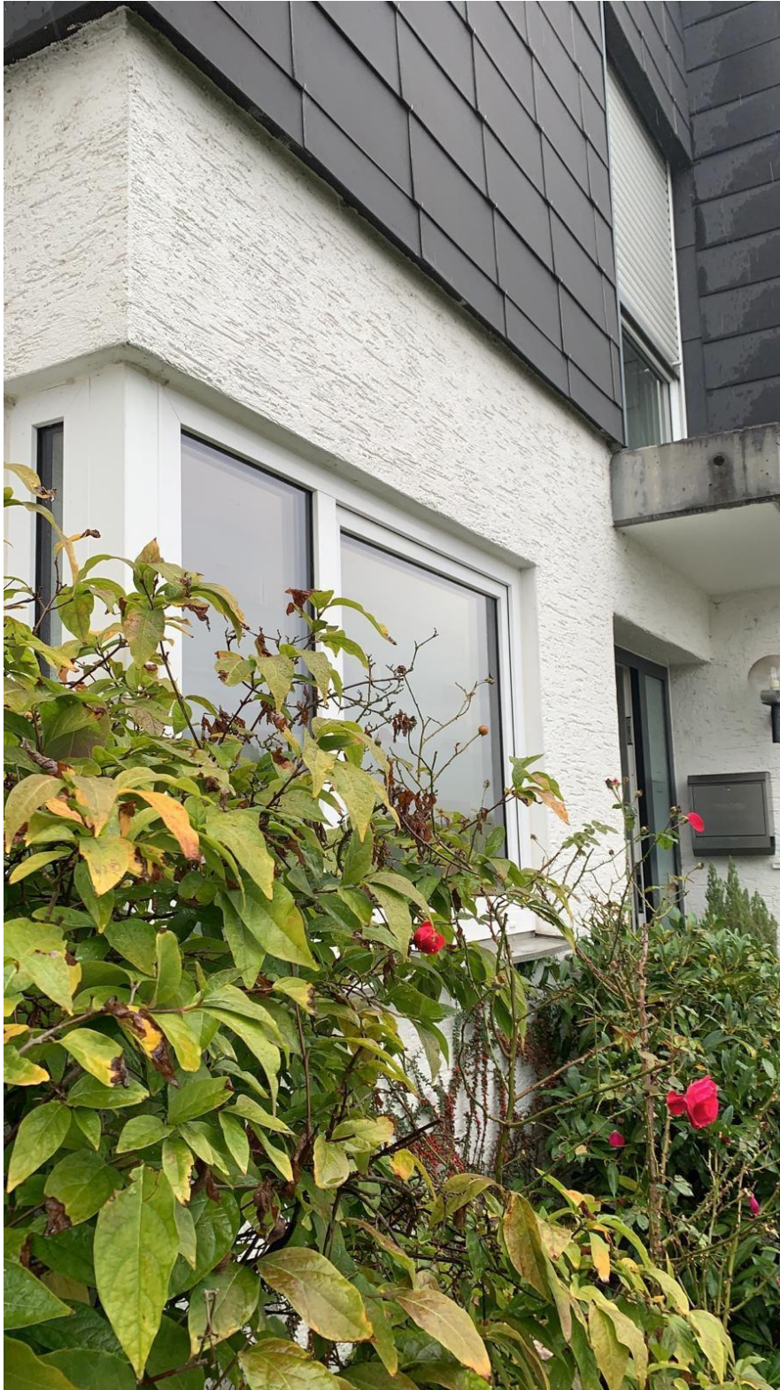
Küchenfenster und Haustür