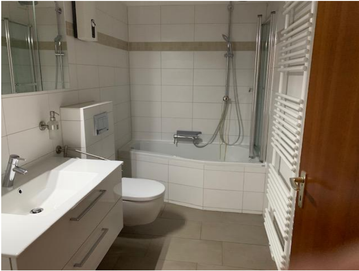
1. OG, Badezimmer mit Badewanne