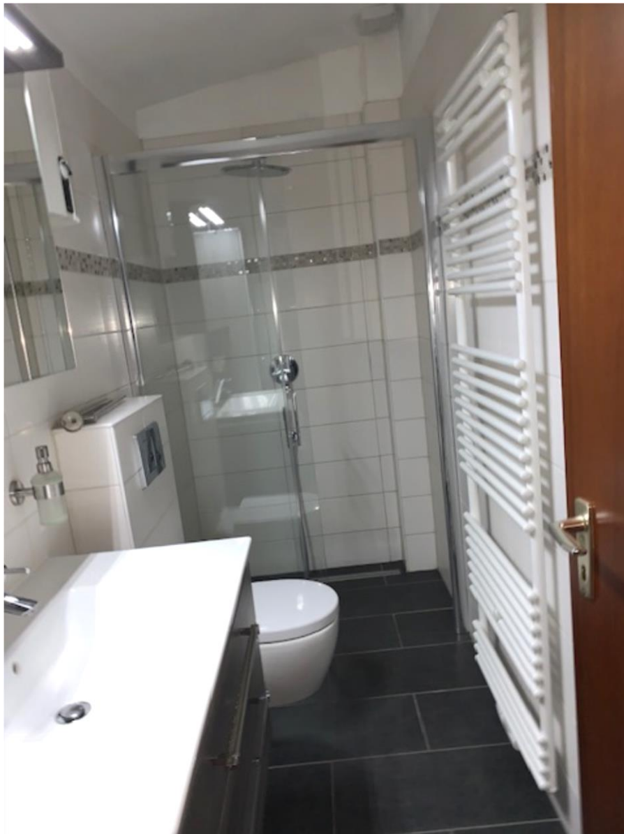
2. OG, Badezimmer mit Dusche