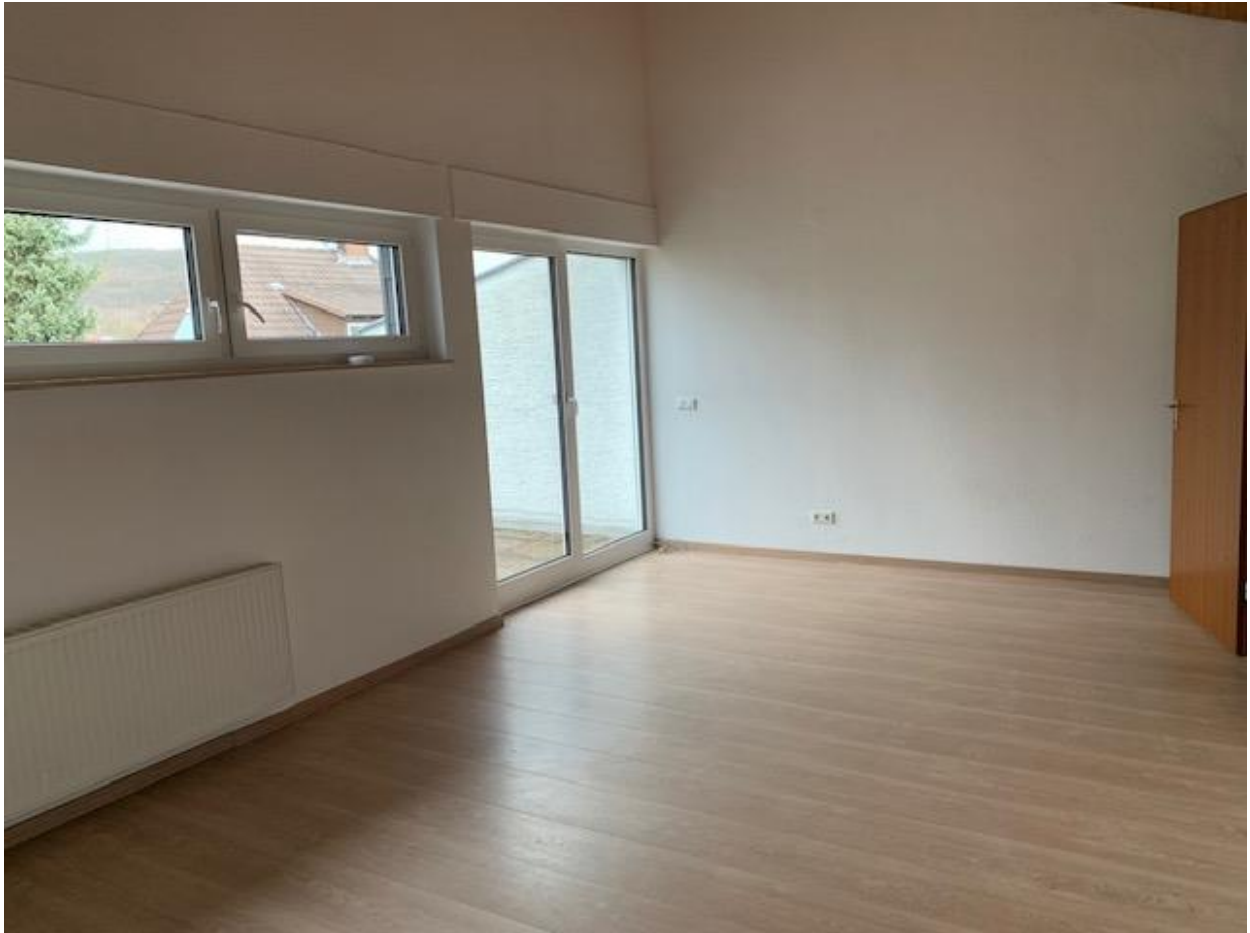
2. OG, großes Zimmer/„Studio“ mit hoher Decke