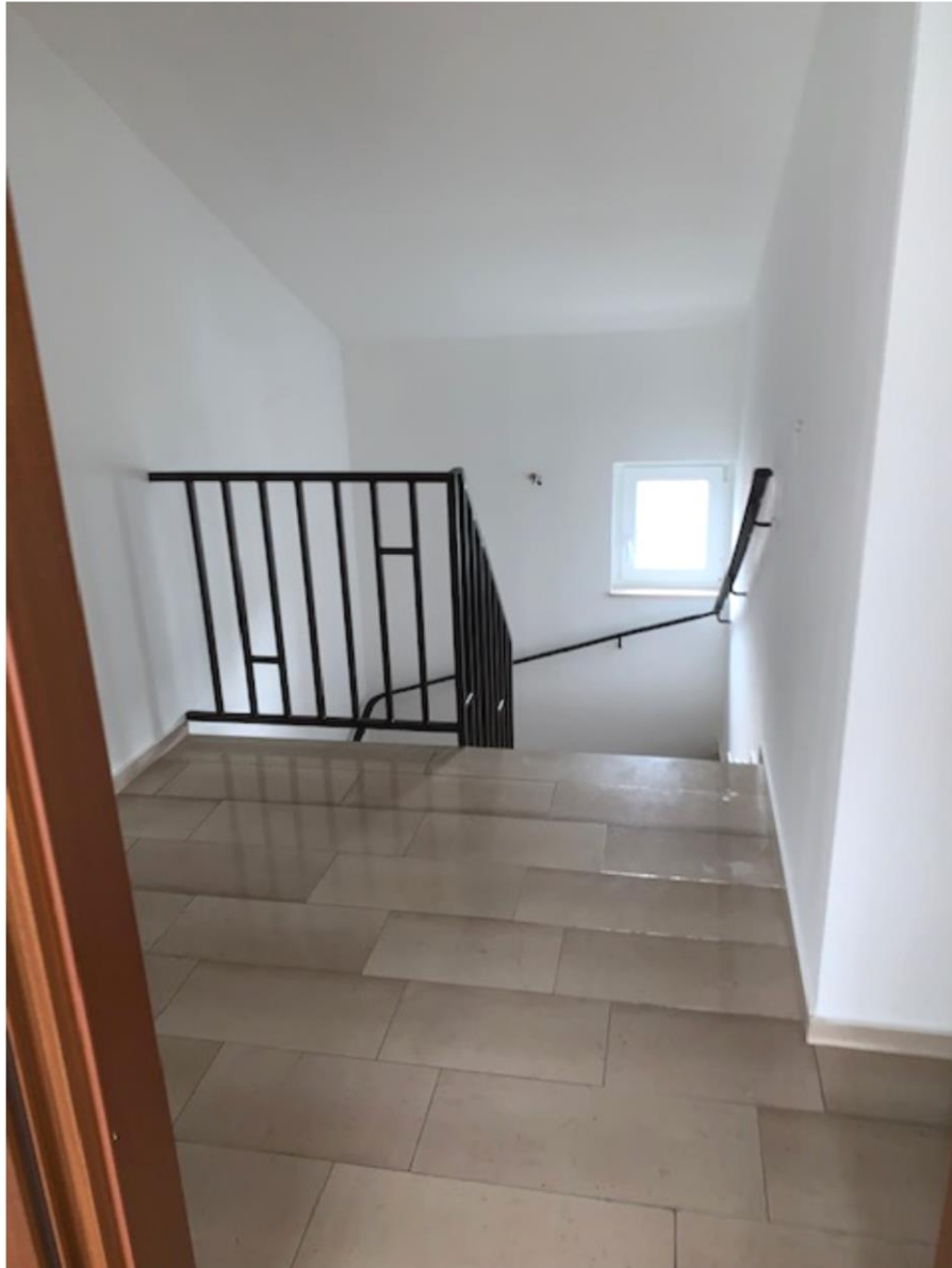
2. OG, Eingangsbereich zum großen Zimmer/„Studio“ mit hoher Decke