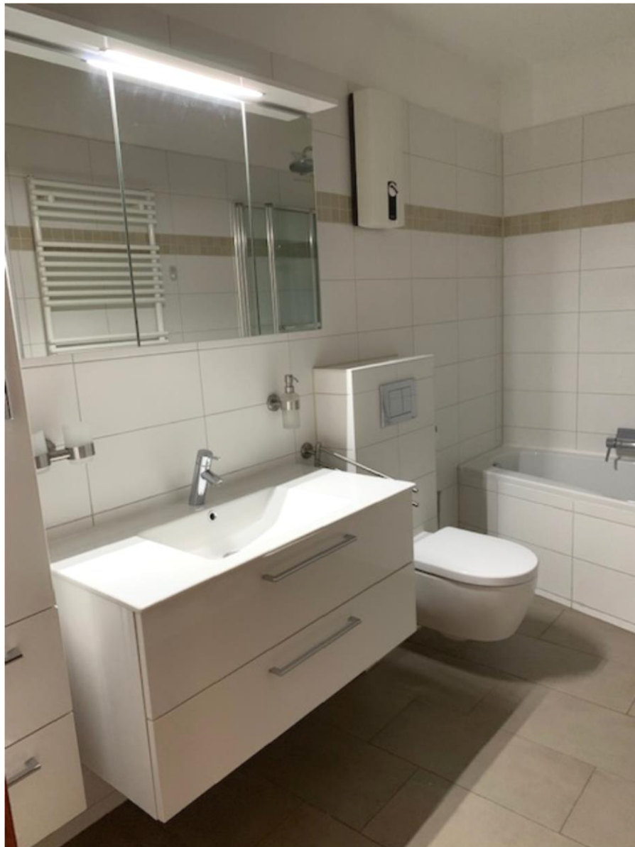
1. OG, Badezimmer mit Badewanne