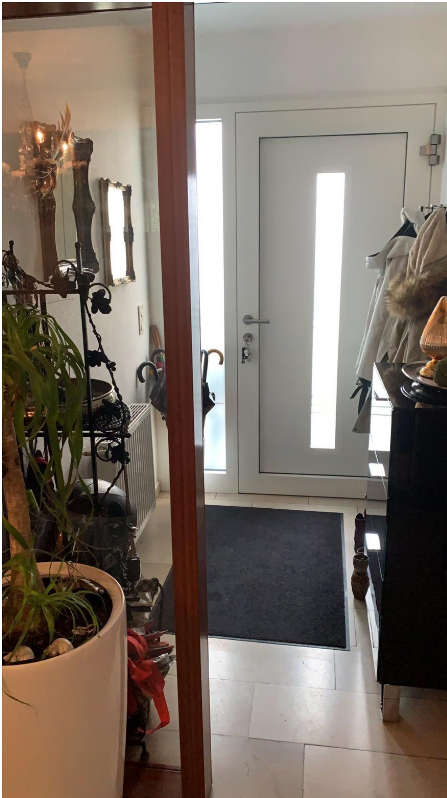
Eingangsbereich mit Haustür