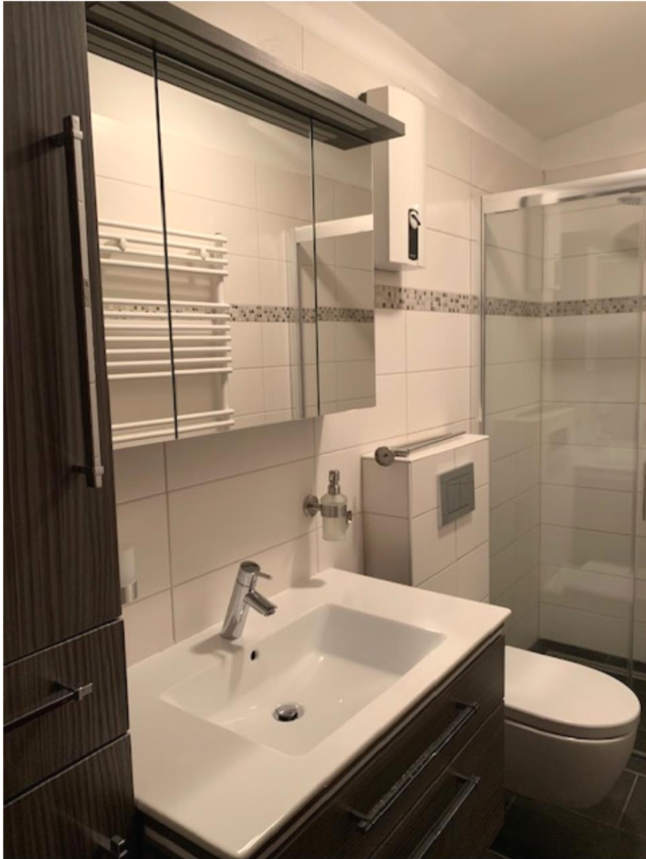
2. OG, Badezimmer mit Dusche