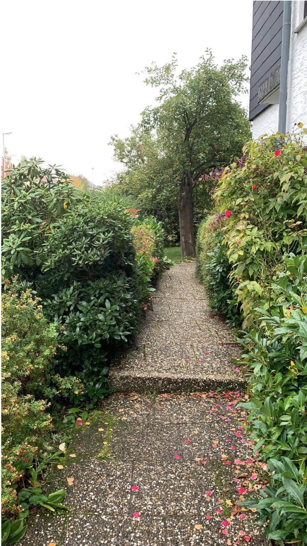
Zugang von der Straßenseite zu den Hauseingängen