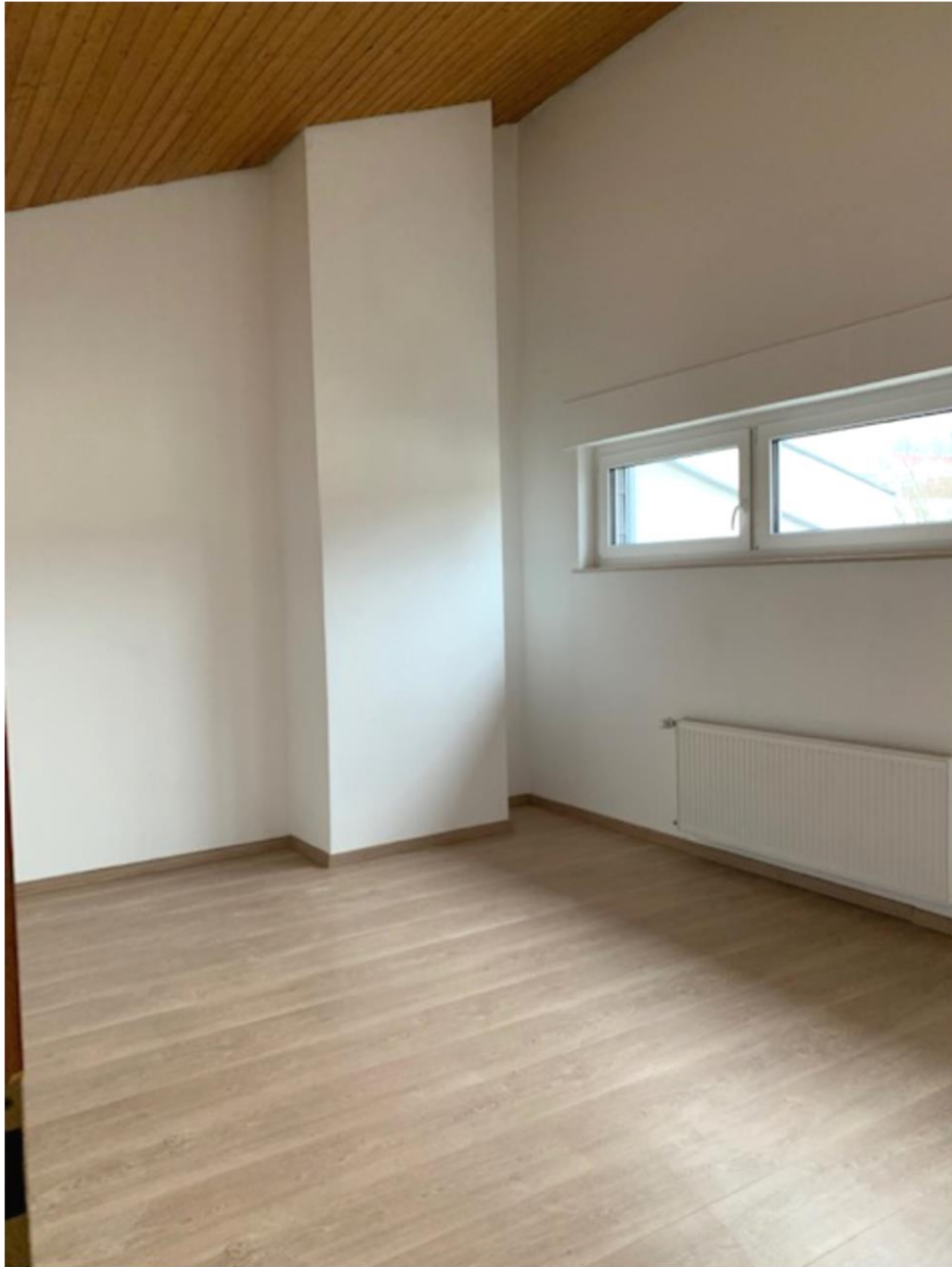
2. OG, großes Zimmer/„Studio“ mit hoher Decke