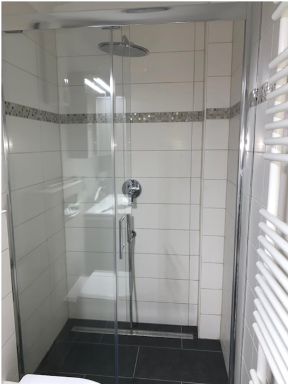
2. OG, Badezimmer mit Dusche