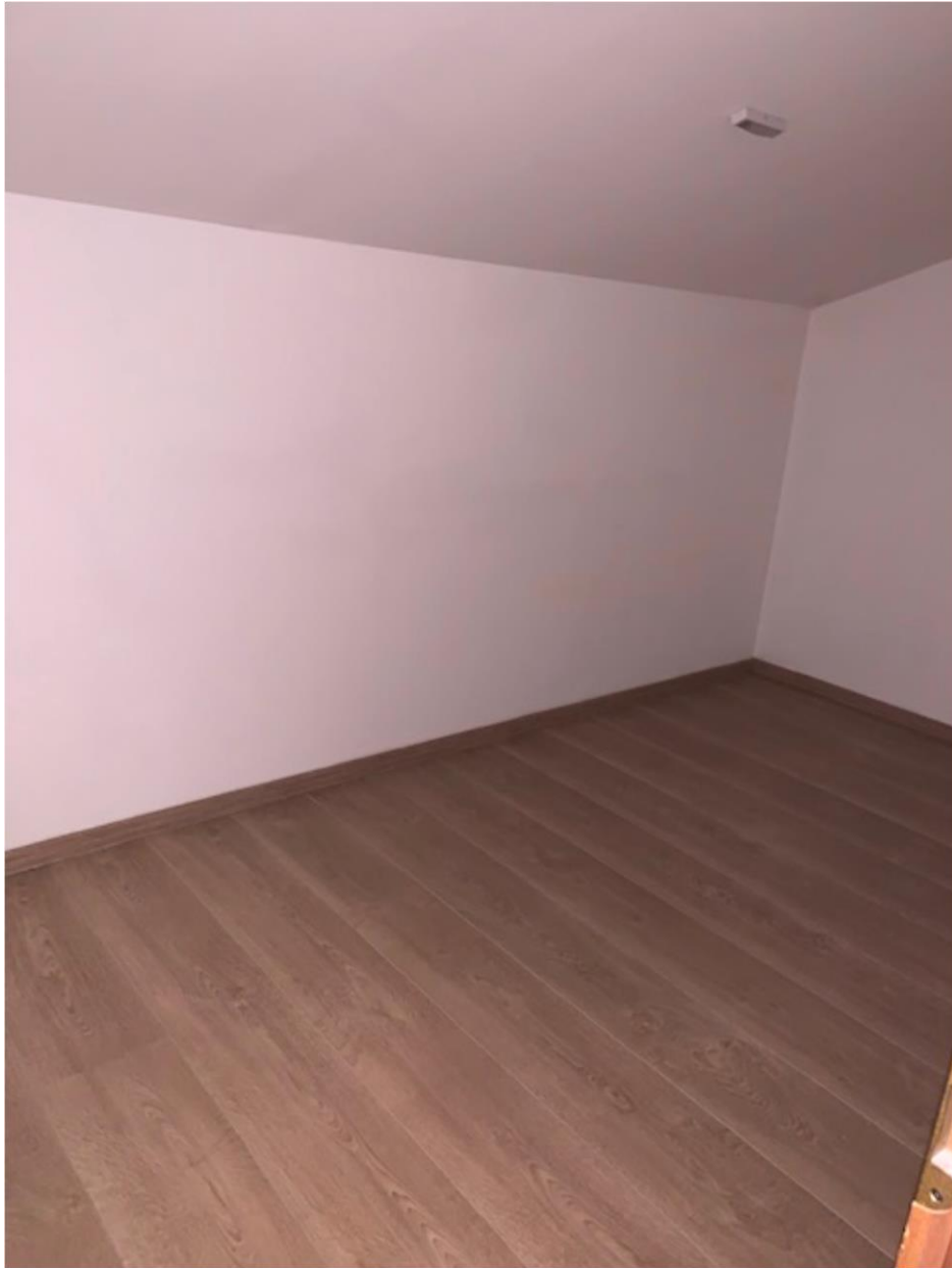
2. OG, Dachboden (ohne Fenster)