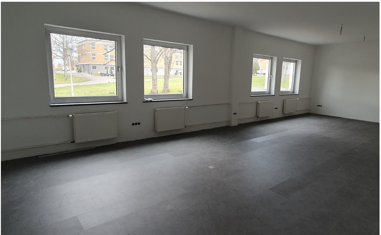
Büro EG groß