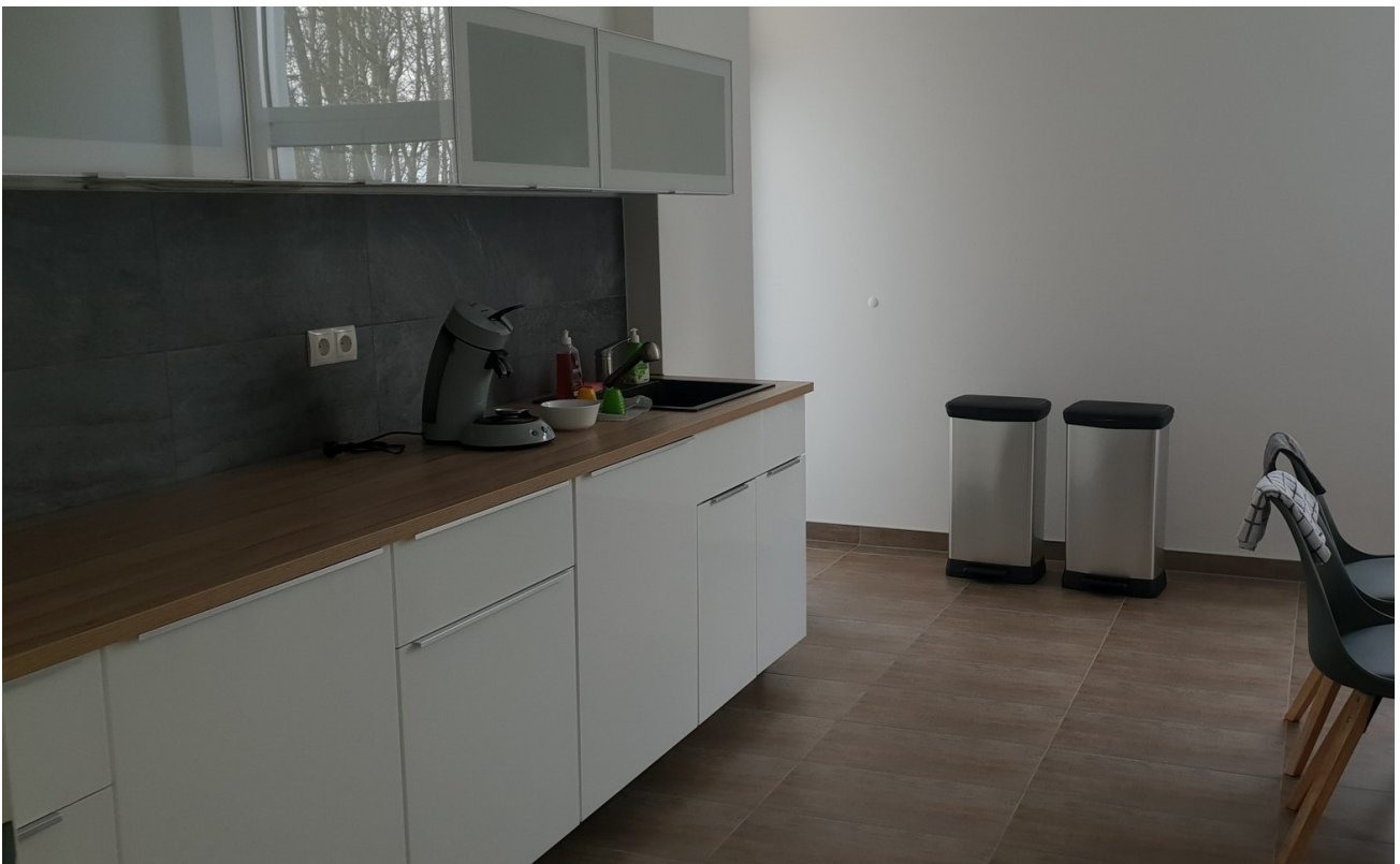
Küche 1. OG