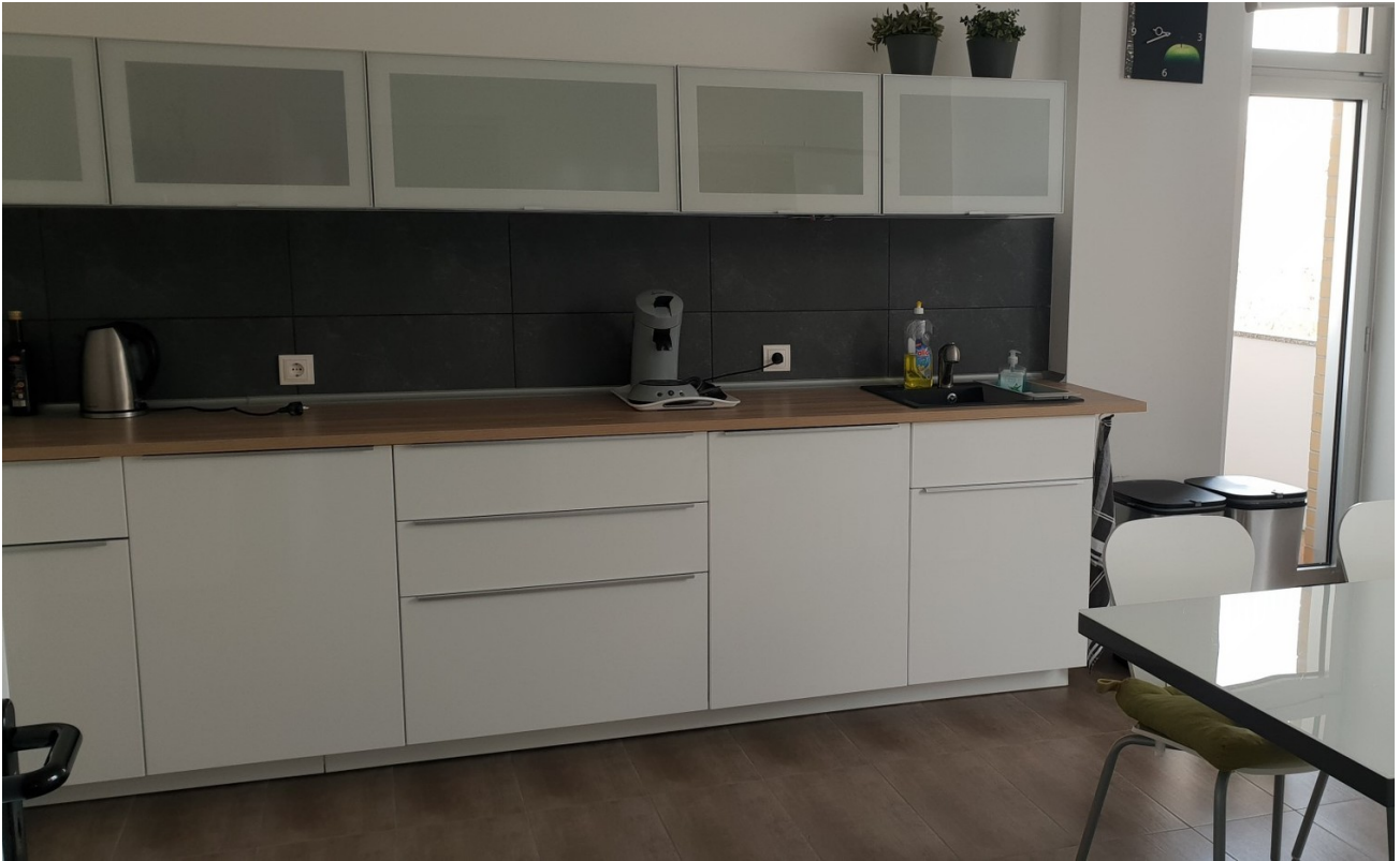
Küche 2. OG