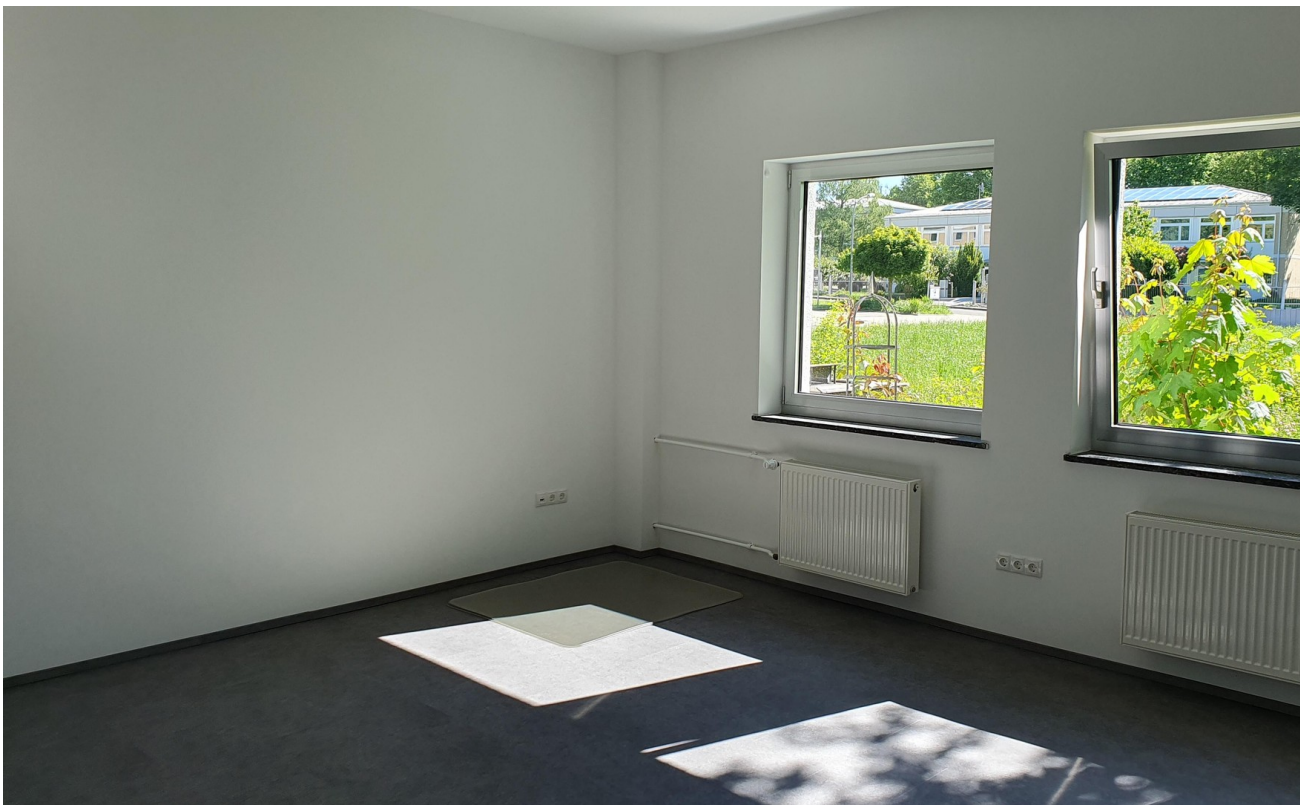
Büro EG 1