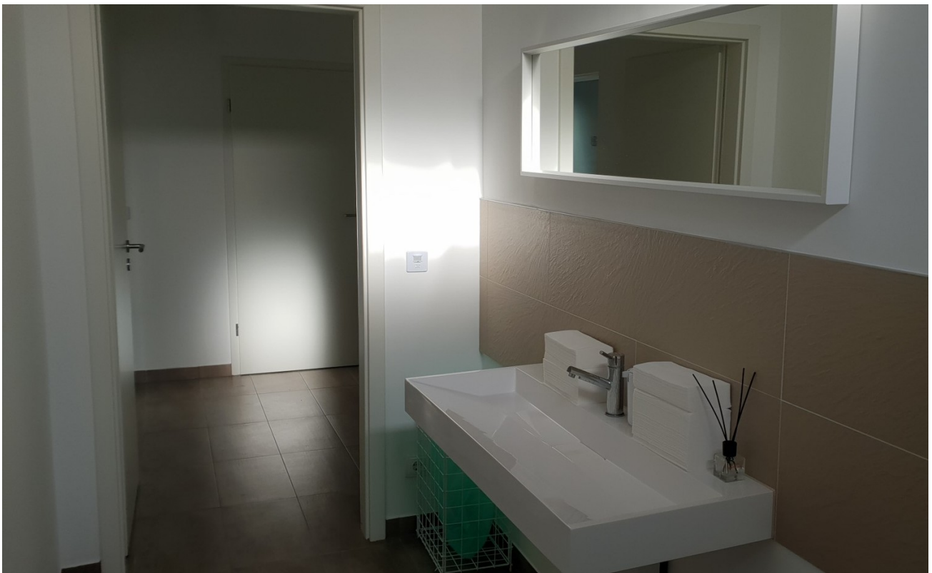
WC Herren 2