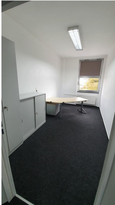
Kleines Büro möbliert