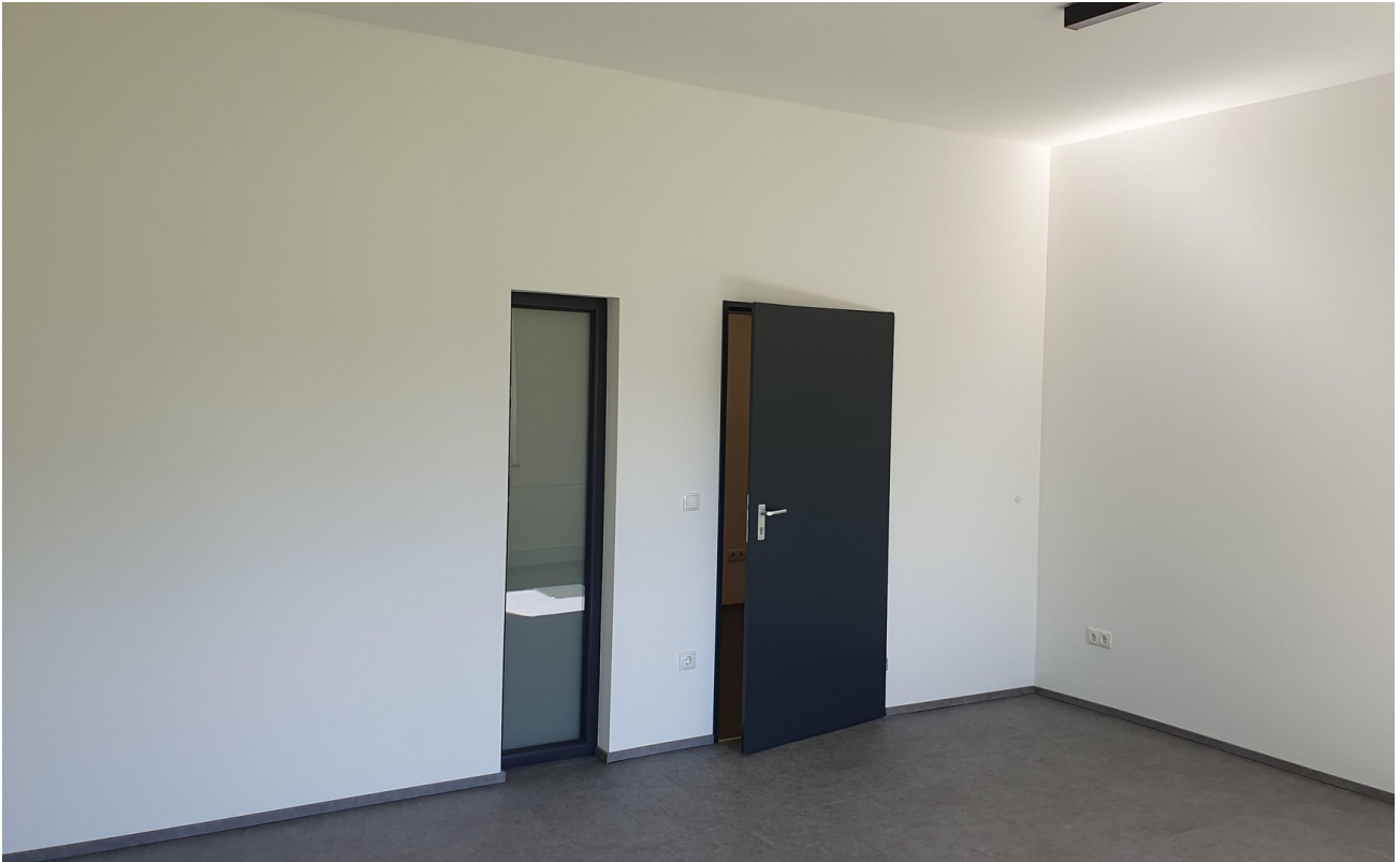
Büro EG 2