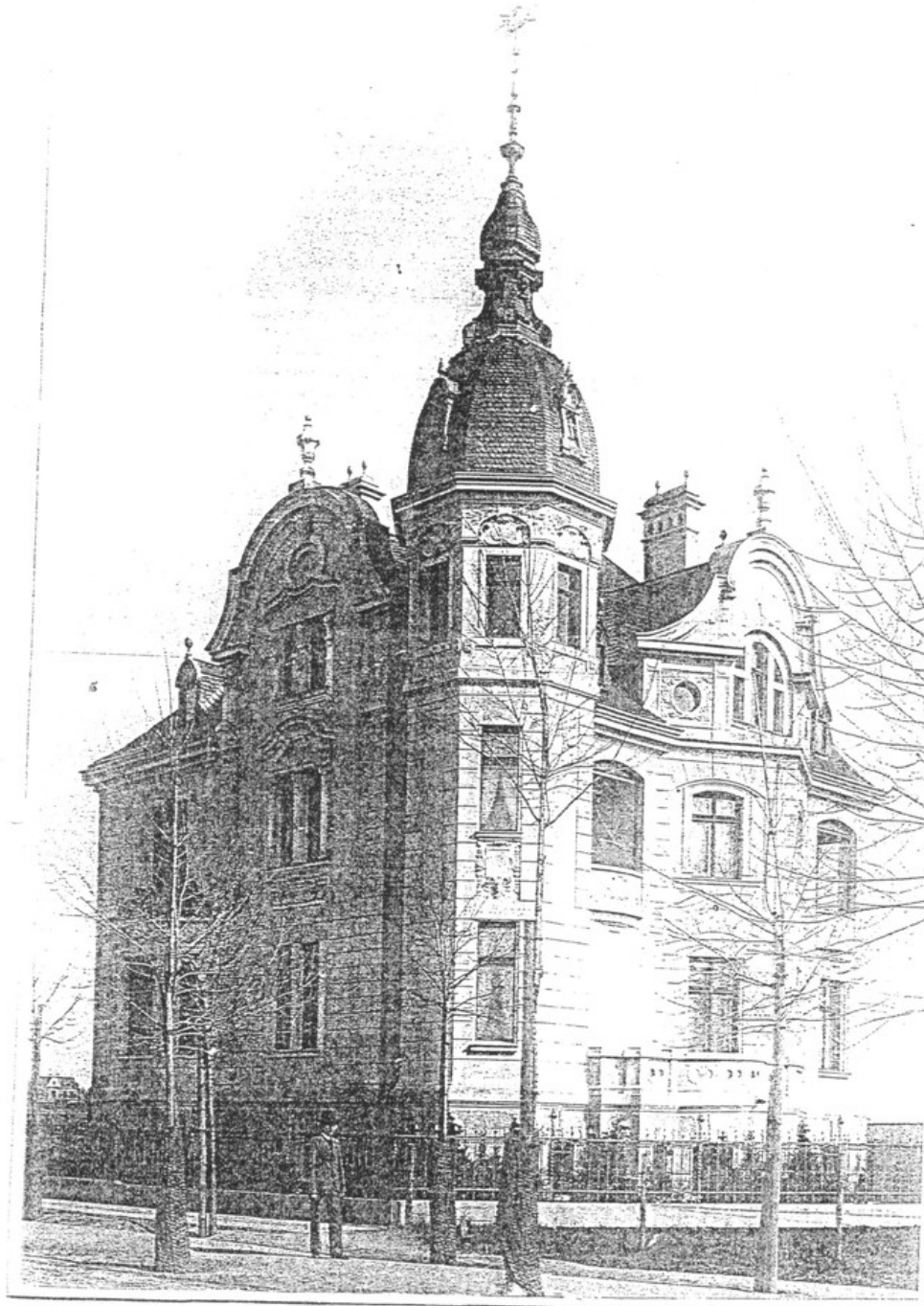
Foto von Villa 1904