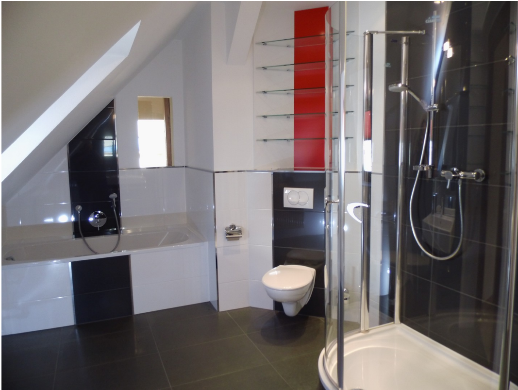
1. Bad mit Wanne und Dusche