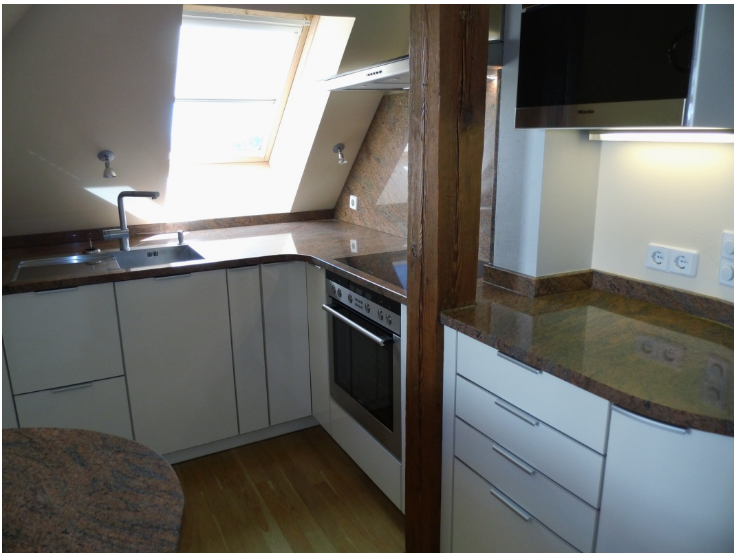
Blick in hochwertige Küche