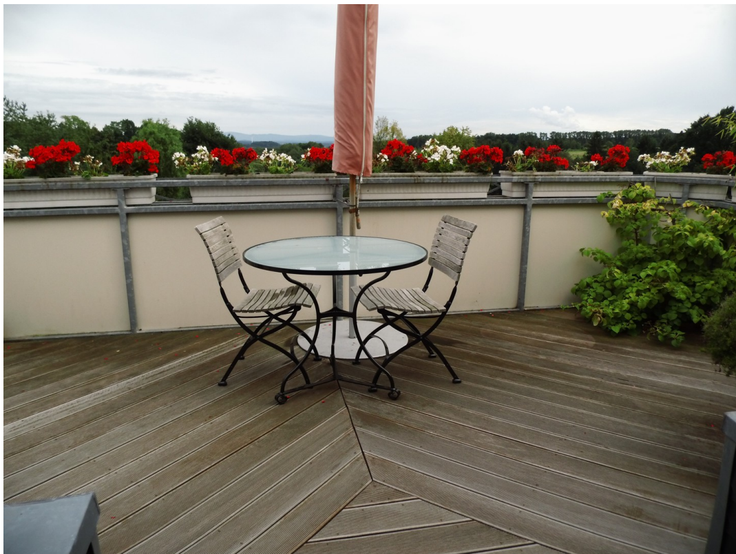
Blick auf Terrasse