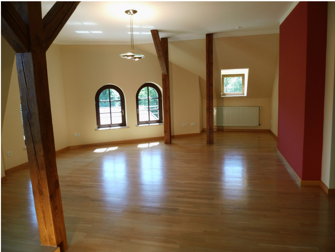
Blick in Wohn - Esszimmer