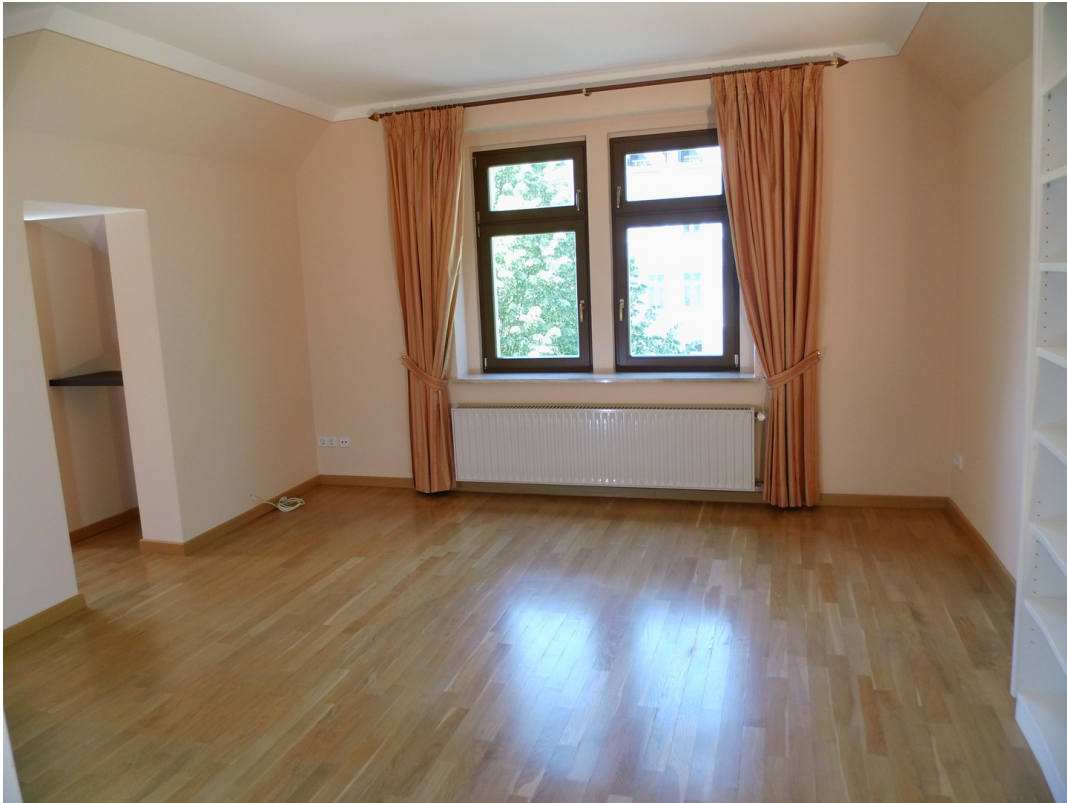
2. Wohn - oder Arbeitszimmer