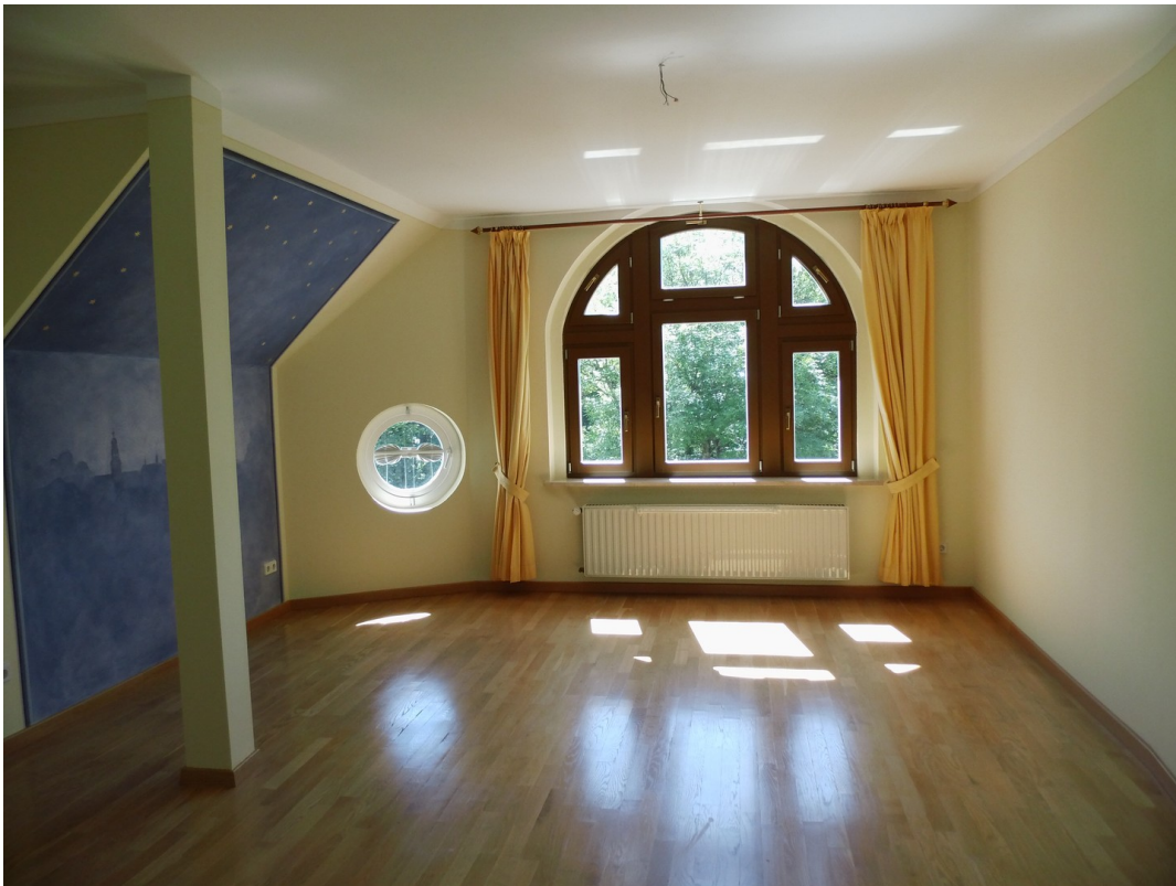
Blick in Schlafzimmer