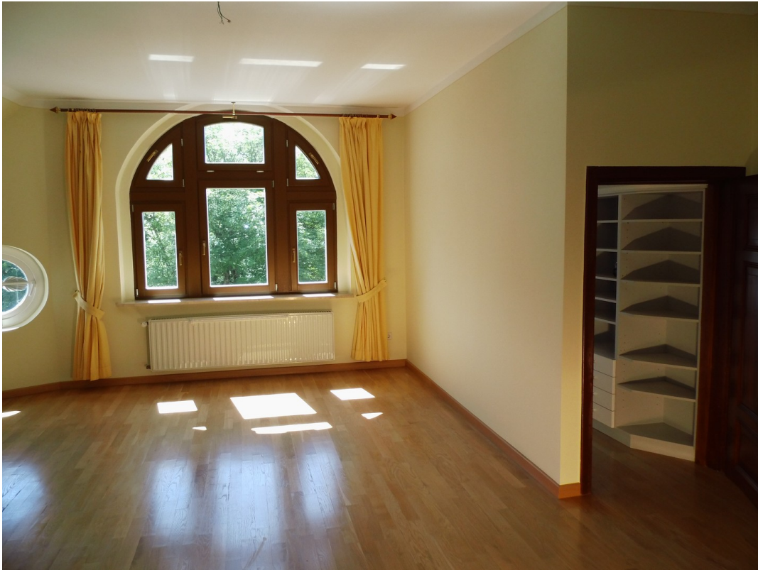
Schlafzimmer mit Umkleideraum