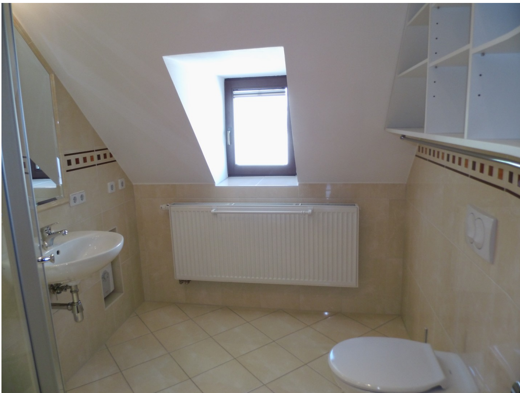
Blick in Gästebad mit Dusche