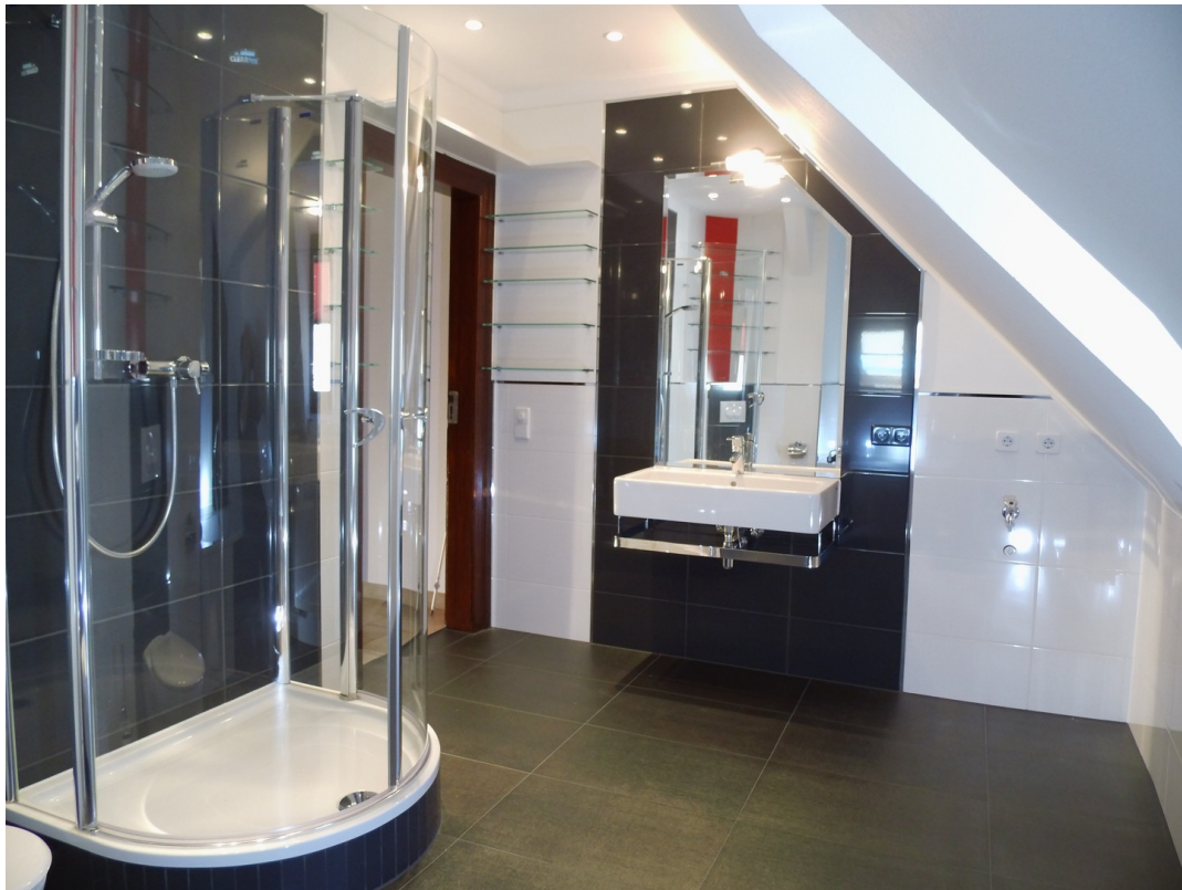
1. Bad Dusche