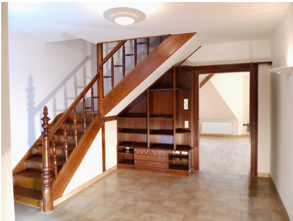
Blick in Wohndiele