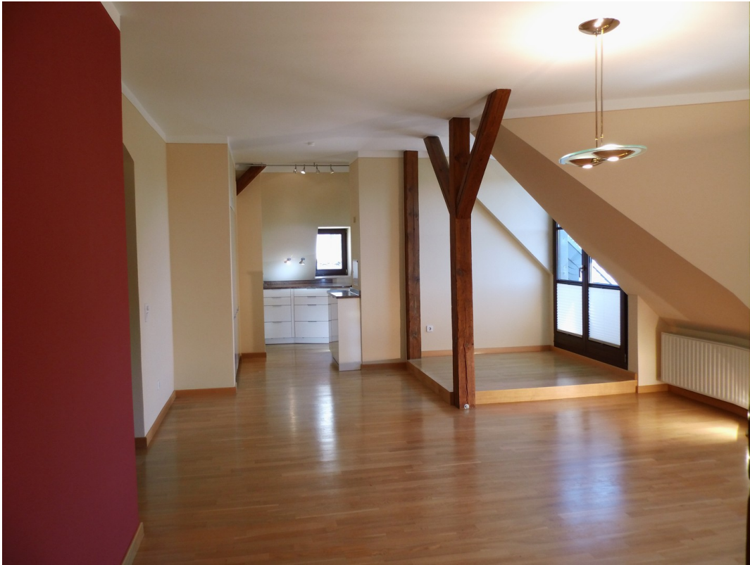
Wohnzimmer / Terrassenzugang