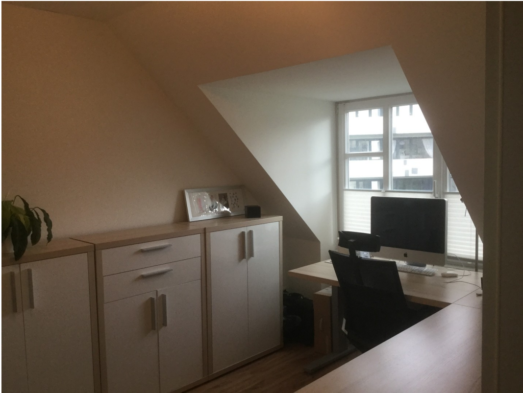
Kinder- / Arbeitszimmer