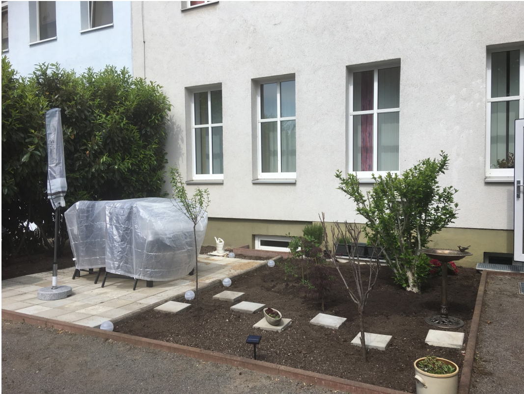
Sitzgelegenheit im Innenhof