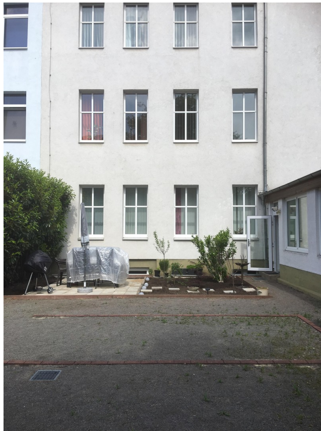
Innenhof mit Parkplätzen