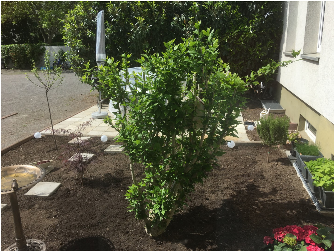
Sitzgelegenheit im Innenhof