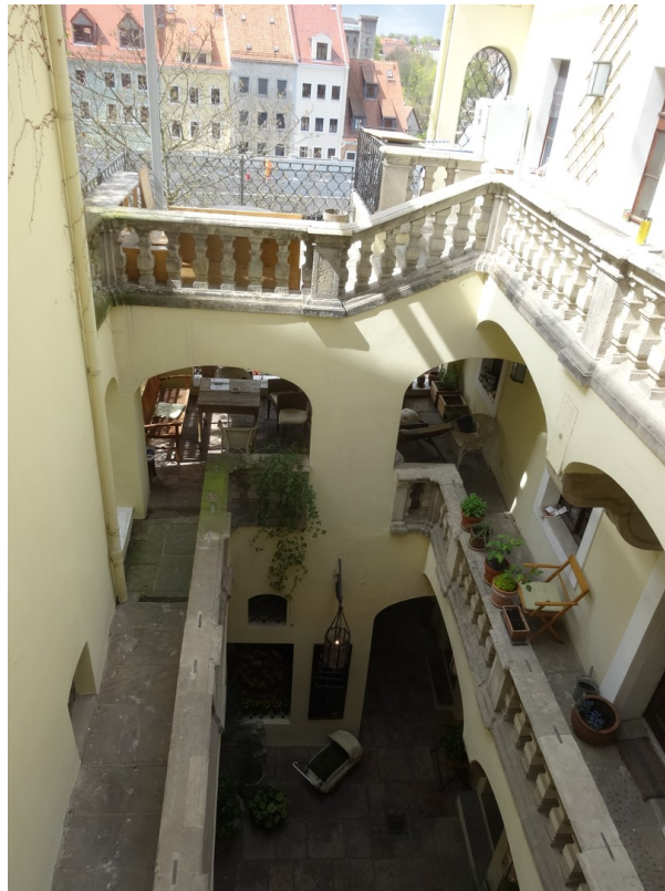
Terrasse mit Innenhof