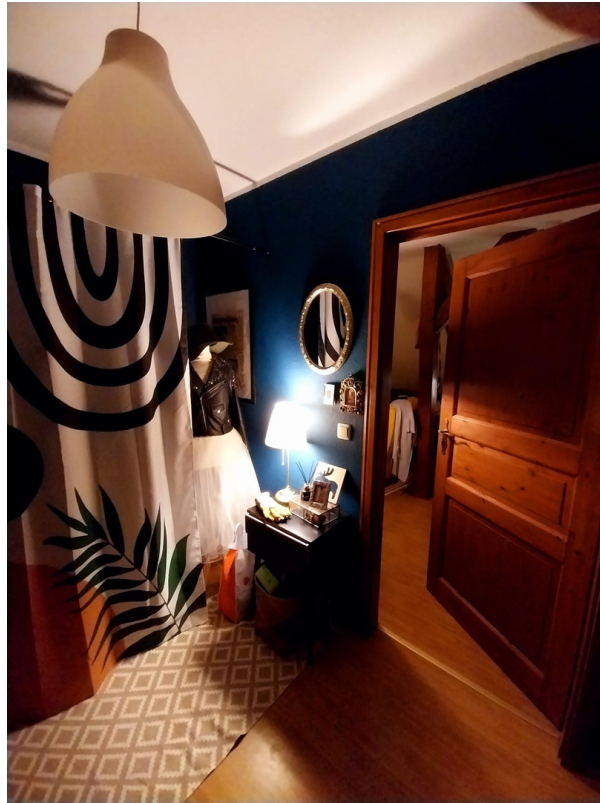
Flur / Eingangsbereich