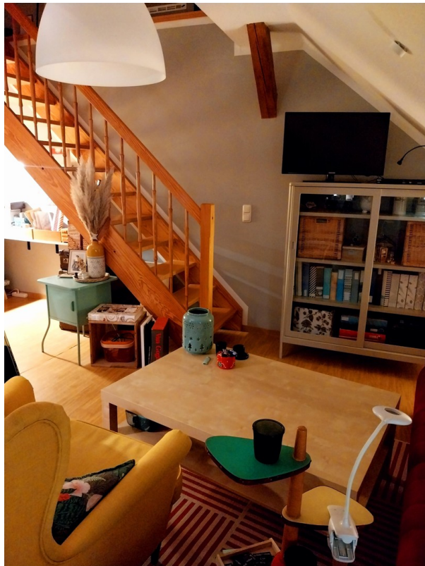
Blick auf Treppe zum Spitzbode