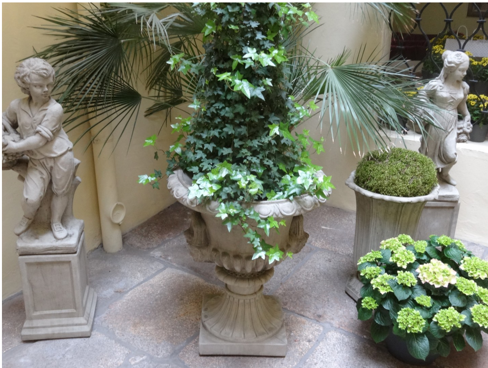
Blick in historischen Innenhof