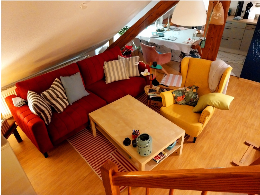
Blick in Wohnbereich