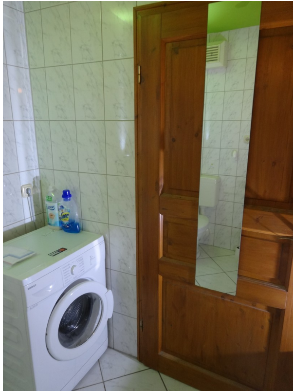
Bad mit Waschmaschine