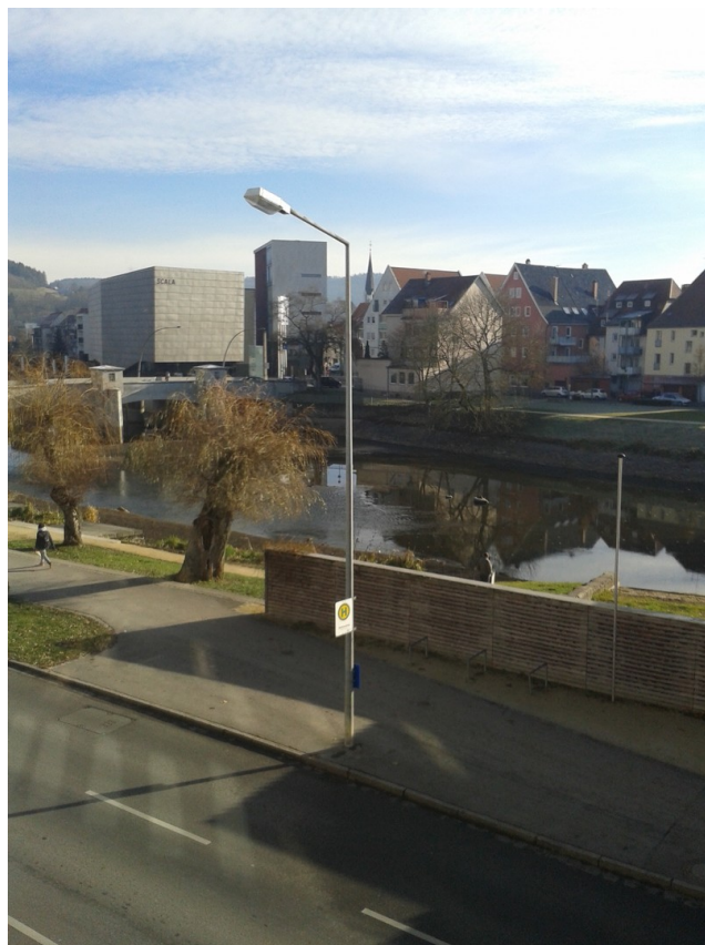
Blick aus dem Wohnzimmer