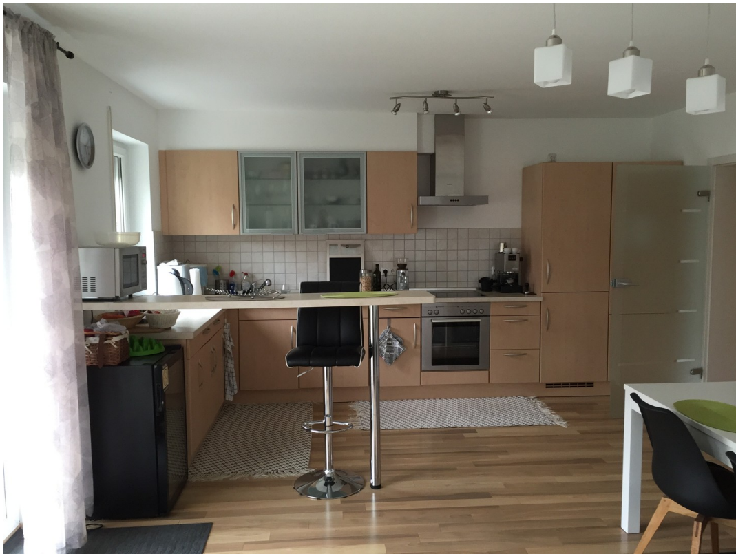
offene Küche 1