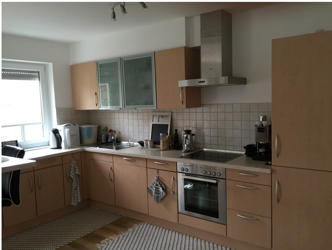
offene Küche 2