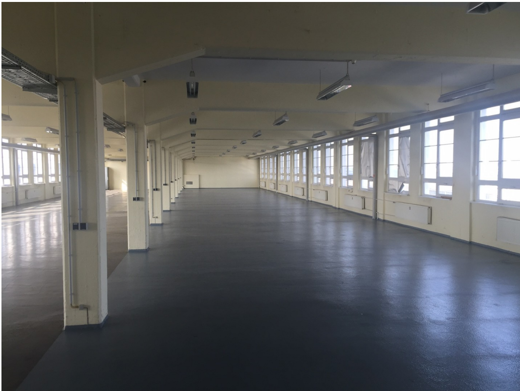
Lager u. Produktion 4.OG