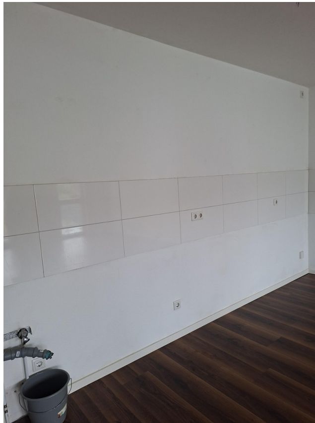
Küche im Wohnbereich