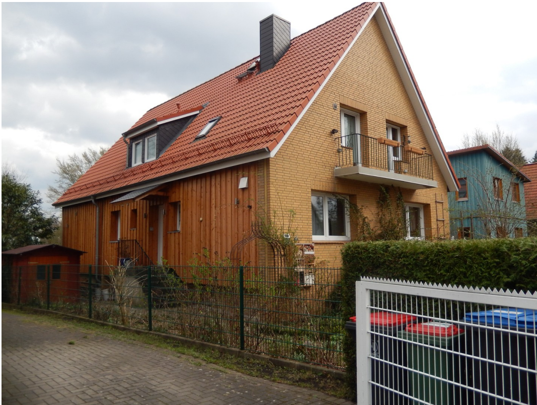
Haus von Aussen