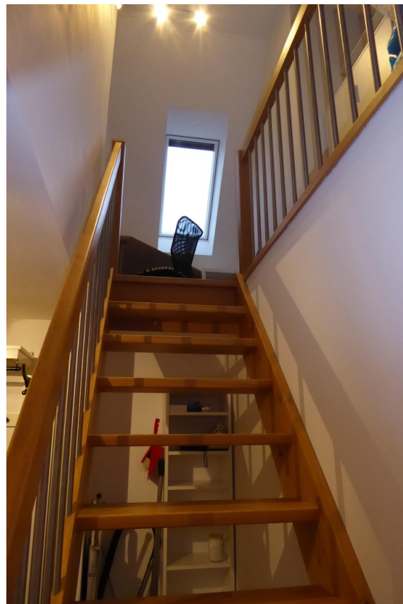
Treppe nach oben