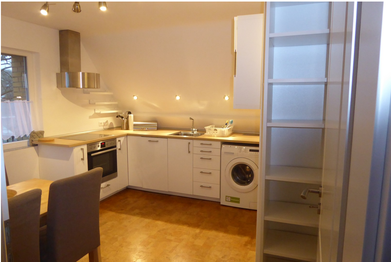
Küche - viel Platz