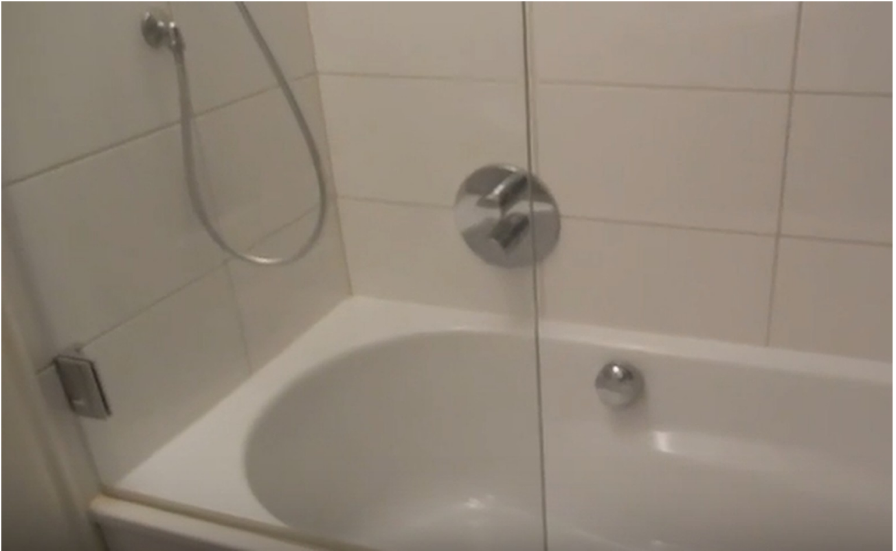
Dusche und Badewanne