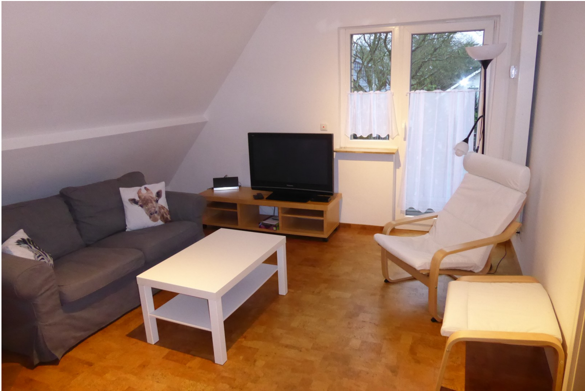
Wohnzimmer zum wohlfühlen