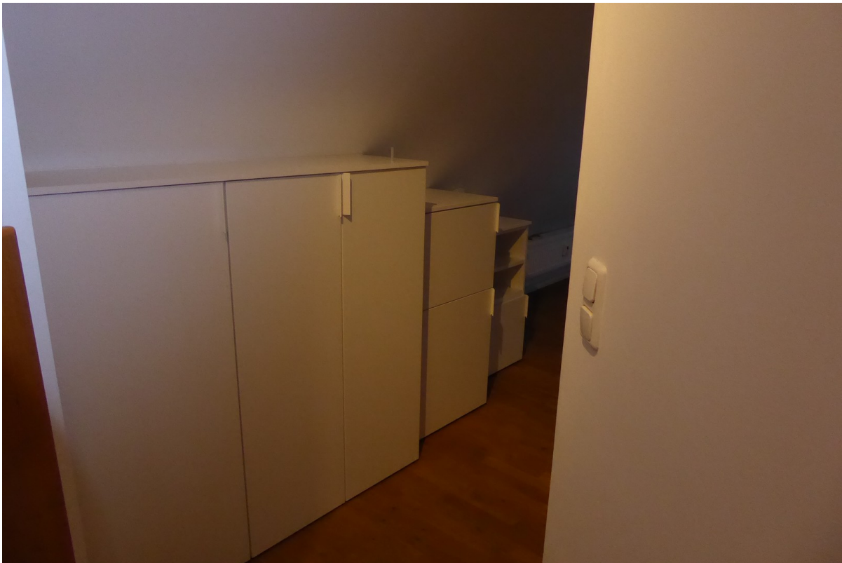
Schränke im Schlafzimmer