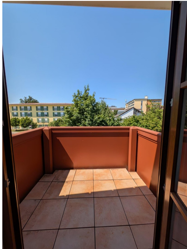
Balkon mit Aussicht