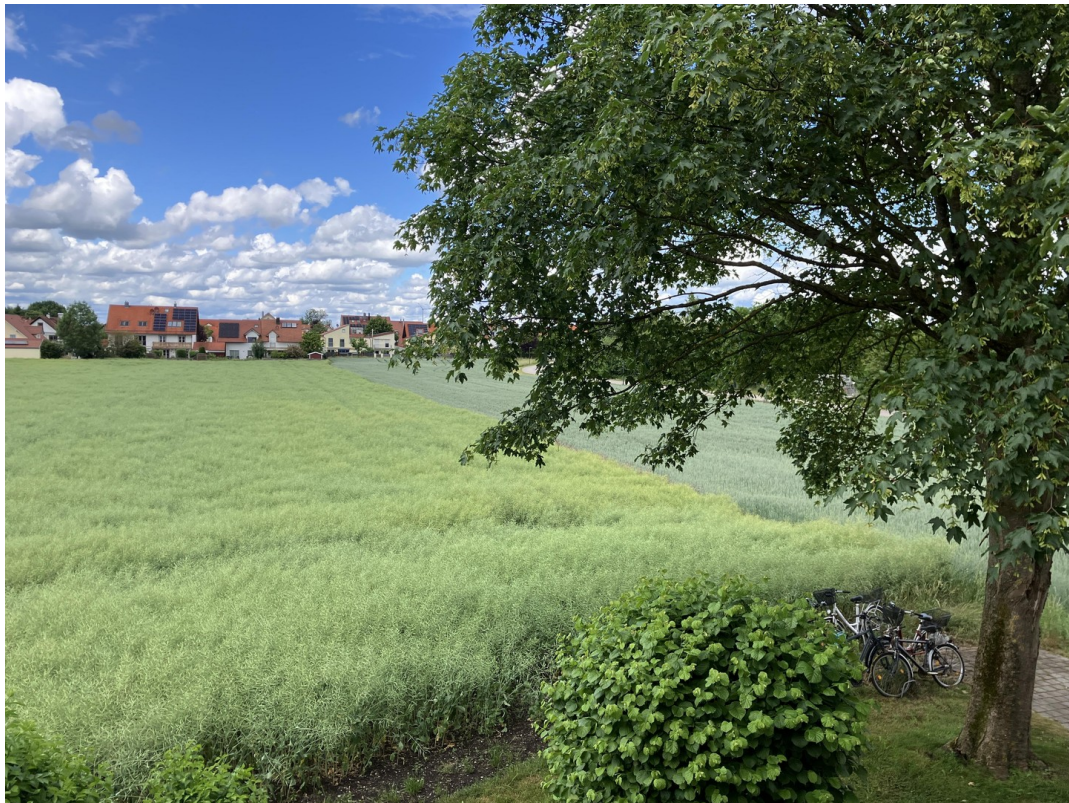
Blick auf Garten und Feld