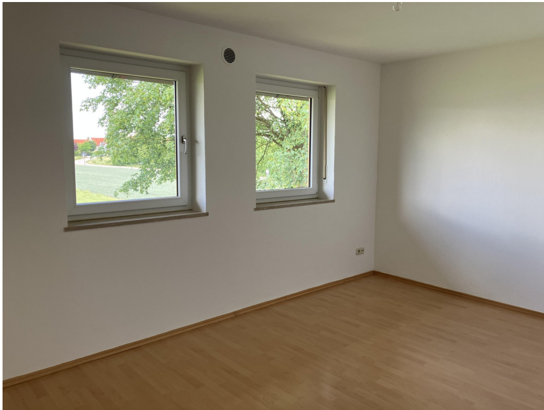
Schlaf- und Arbeitszimmer