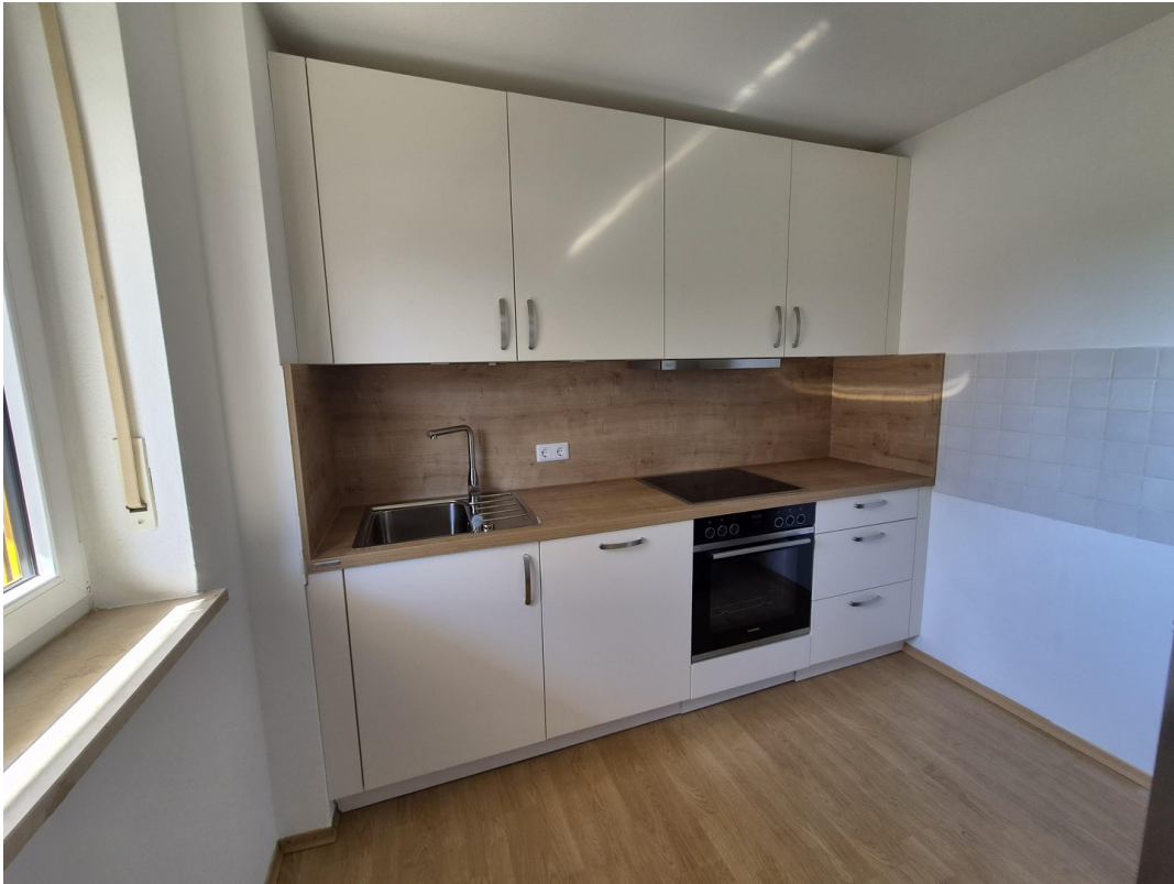
Küche mit Nolte EBK