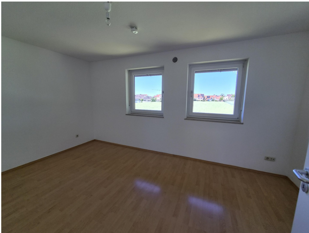
Schlaf- und Arbeitszimmer