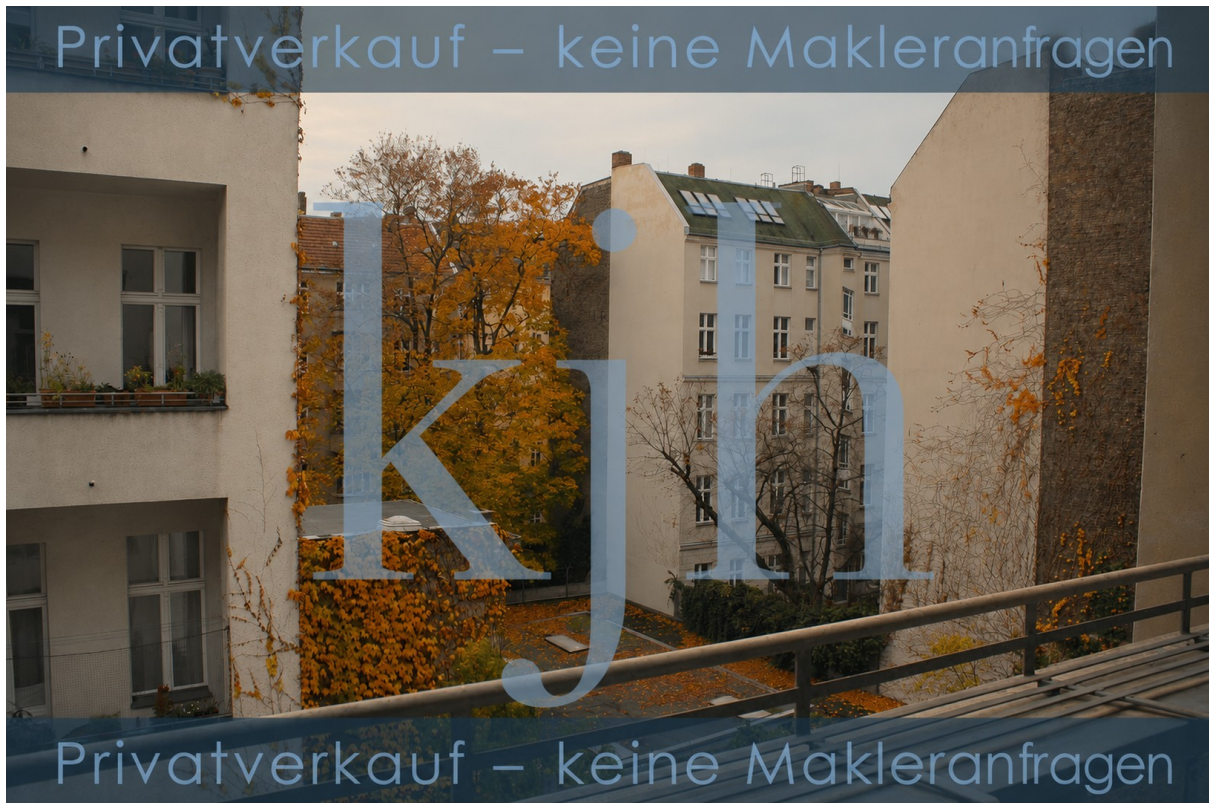
Sicht von der Loggia