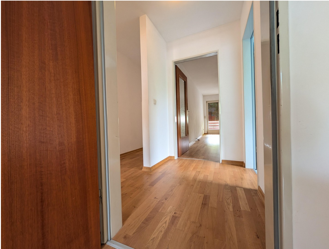
Diele, links Abstellraum