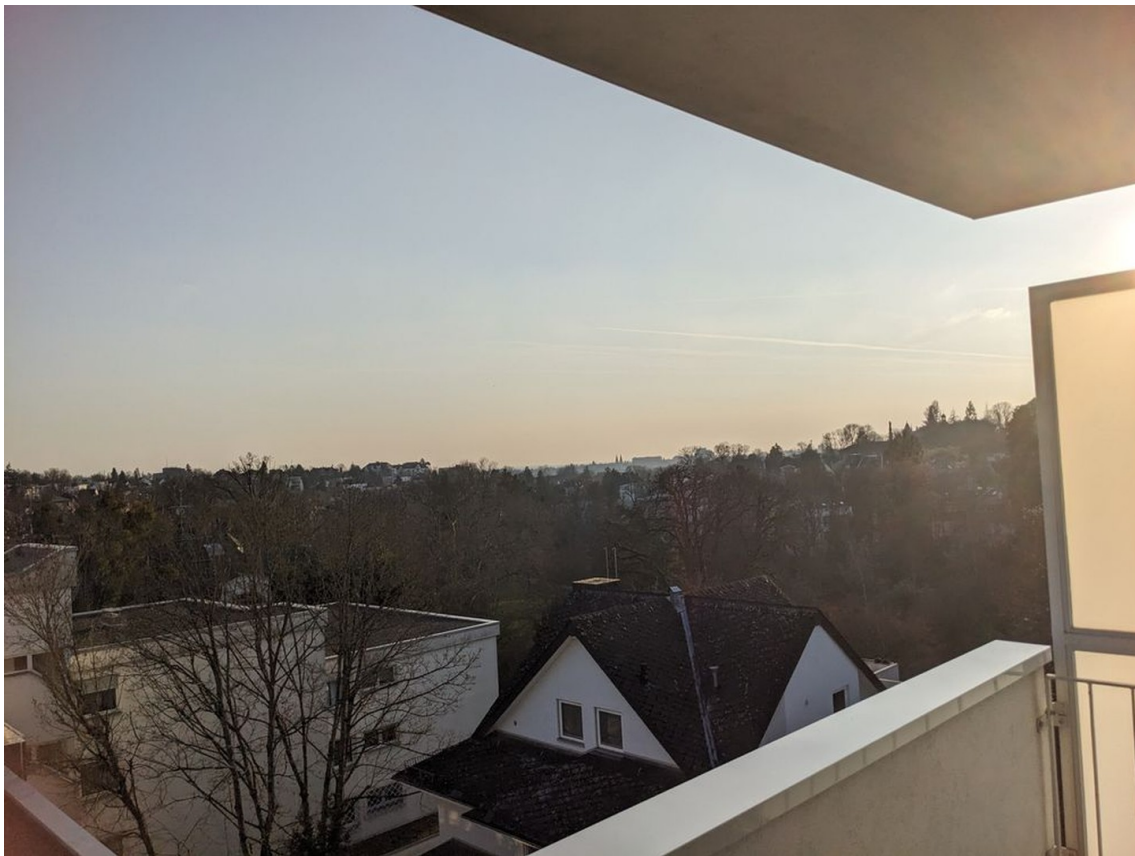
Balkon Richtung Kurpark